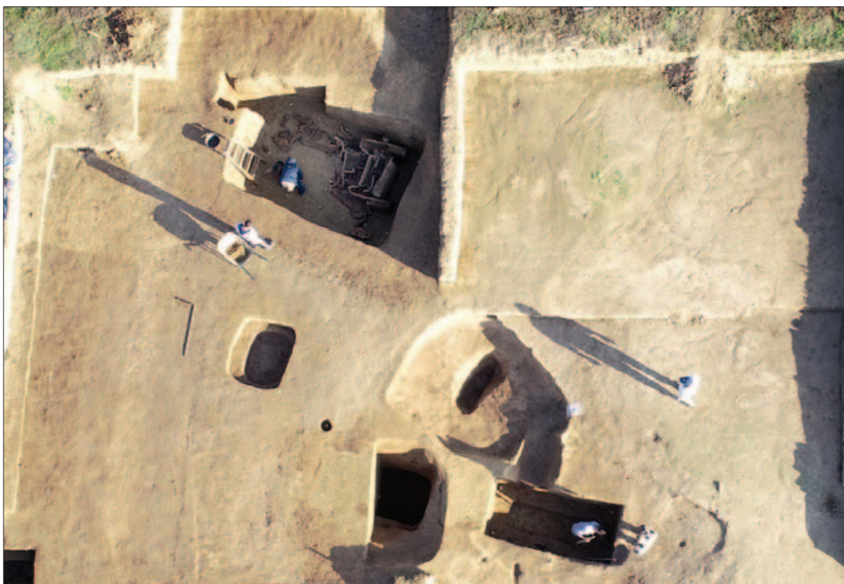
Sl. 14 Pogled na sjeverni dio tumula i komoru s dvokolicom