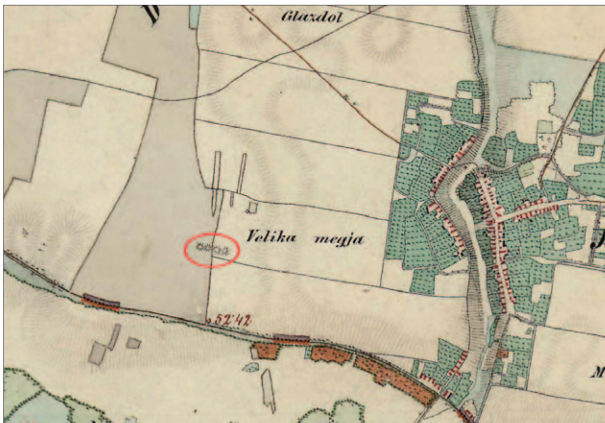
Sl. 2 Karta iz sredine 19. stoljeća s prikazana četiri tumula (izradio: H. Vulić; izvor: https://mapire.eu/en/ )