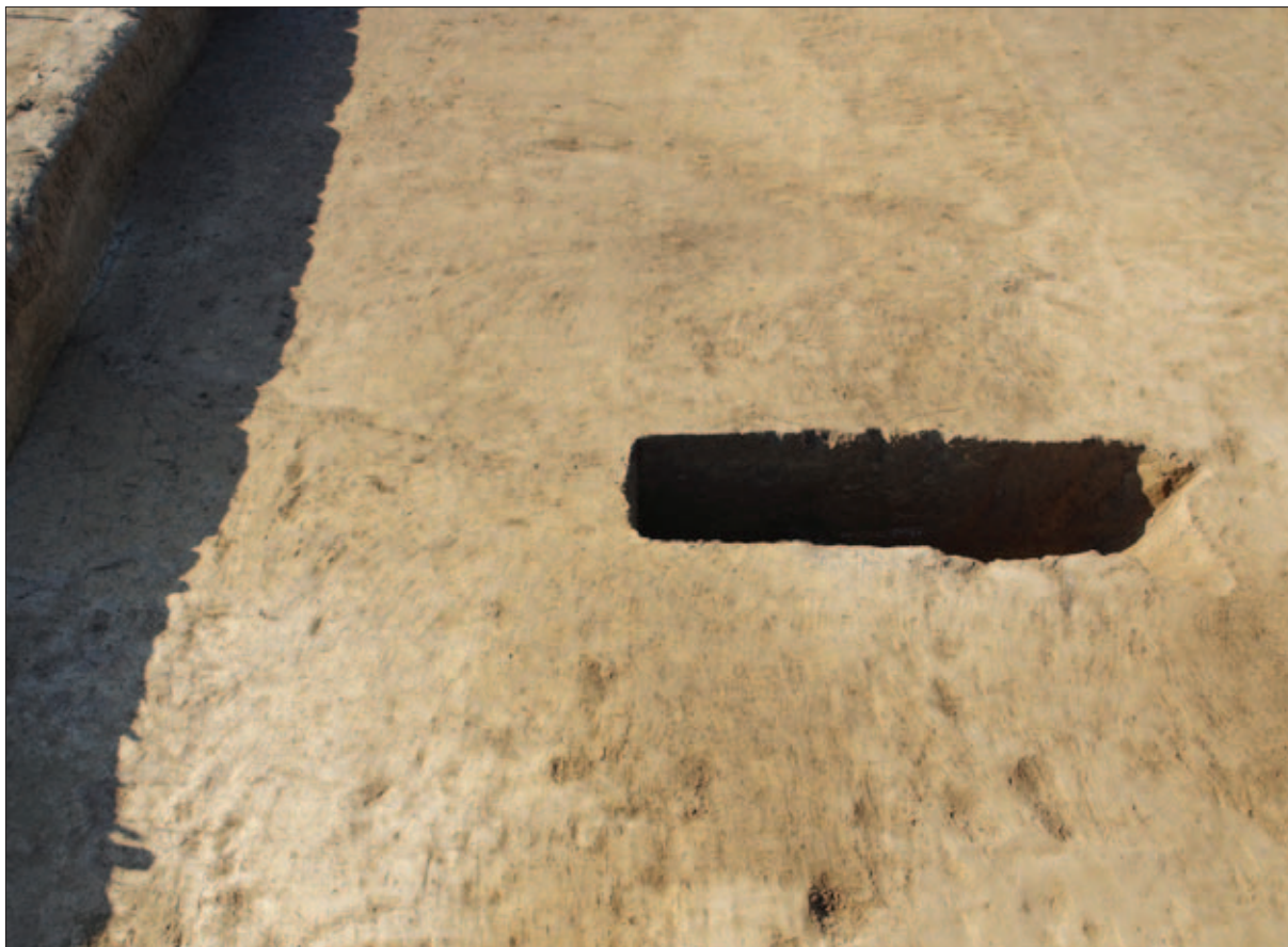
Sl. 11 Ukop jame koja je dijelom zahvatila zapunu komore s kočijom

Fig. 11 The pit that partly intersected the fill of the chamber with the carriage