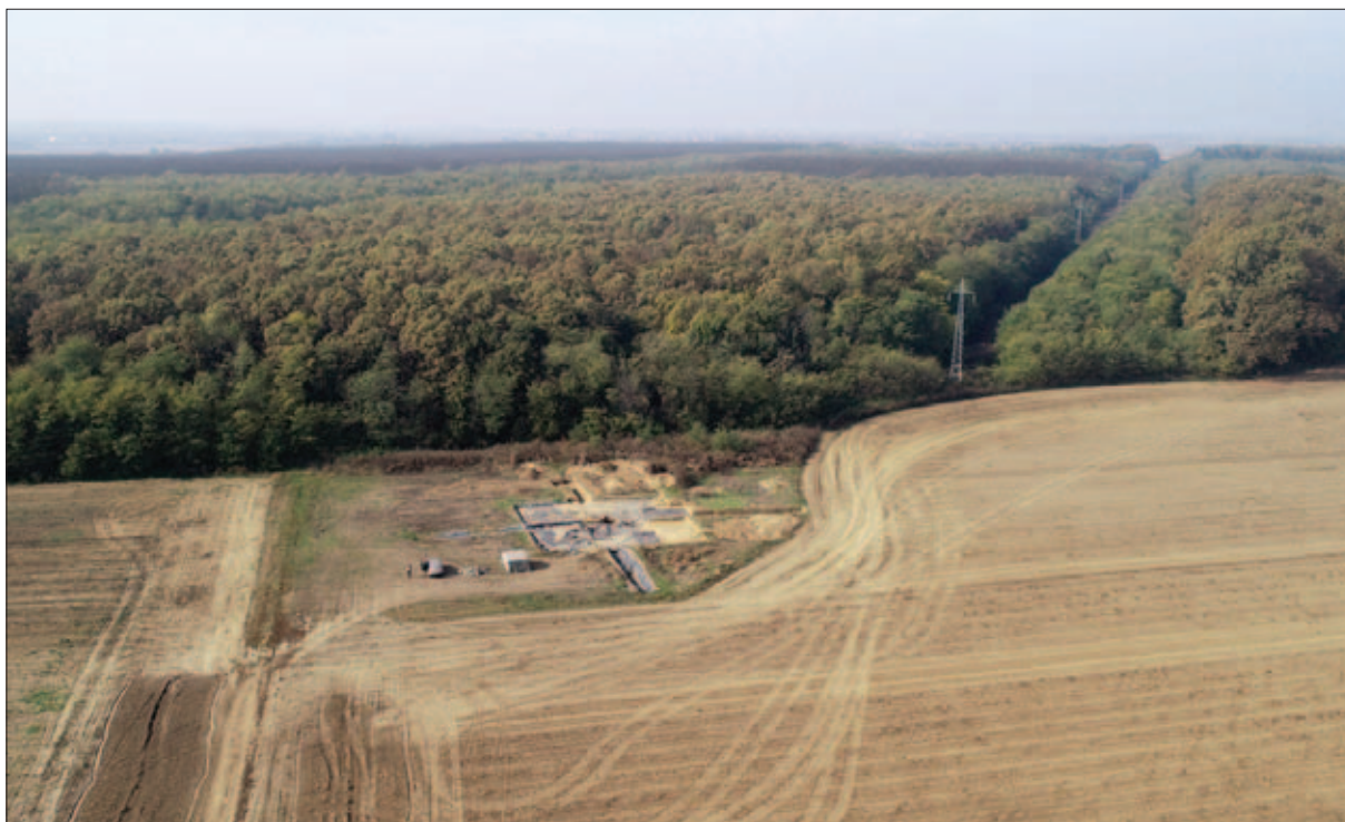
Sl. 13 Položaj istraživanja tumula 1 u odnosu na šumu