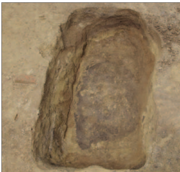
Sl. 8 Ukop jame u kvadrantu A nastale tijekom pljačke tumula s vidljivim nasipima tumula u rubovima

Fig. 7 The start of the 2017 excavations of tumulus 1 during the excavation of the humus layer