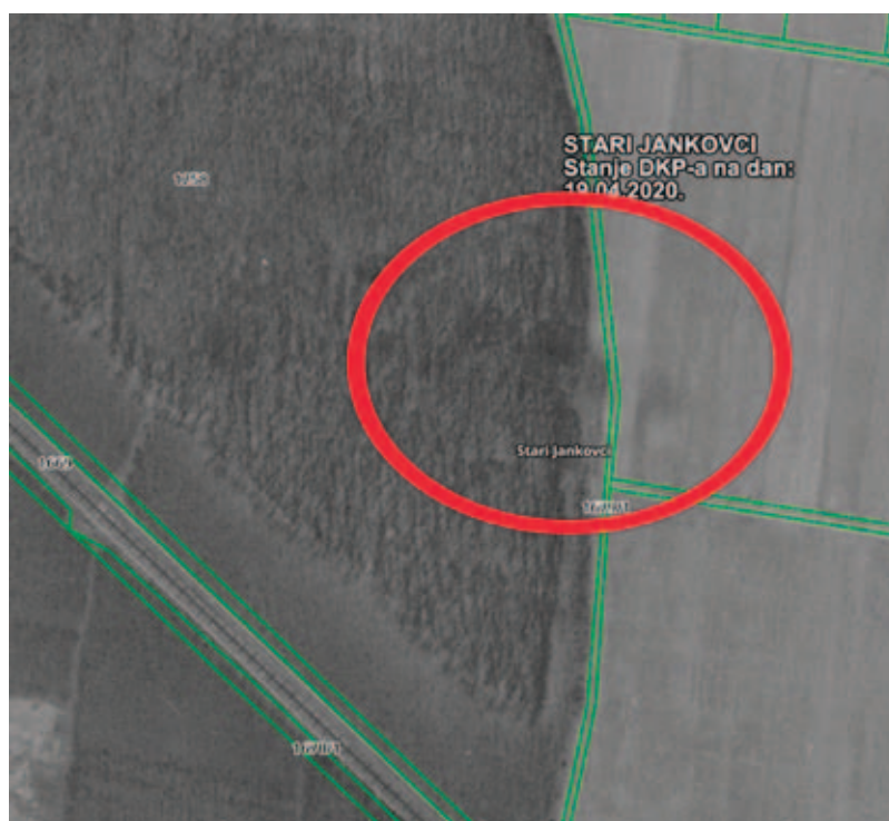
Sl. 3 Zračna snimka iz 1968. godine s vidljiva četiri tumula u šumi (izradio: H. Vulić; izvor: Državna geodetska uprava)