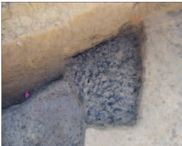
Sl. 12 Ostaci paljevinskoga groba i jama koja ga je presjekla u istočnome rovu

Fig. 11 The pit that partly intersected the fill of the chamber with the carriage