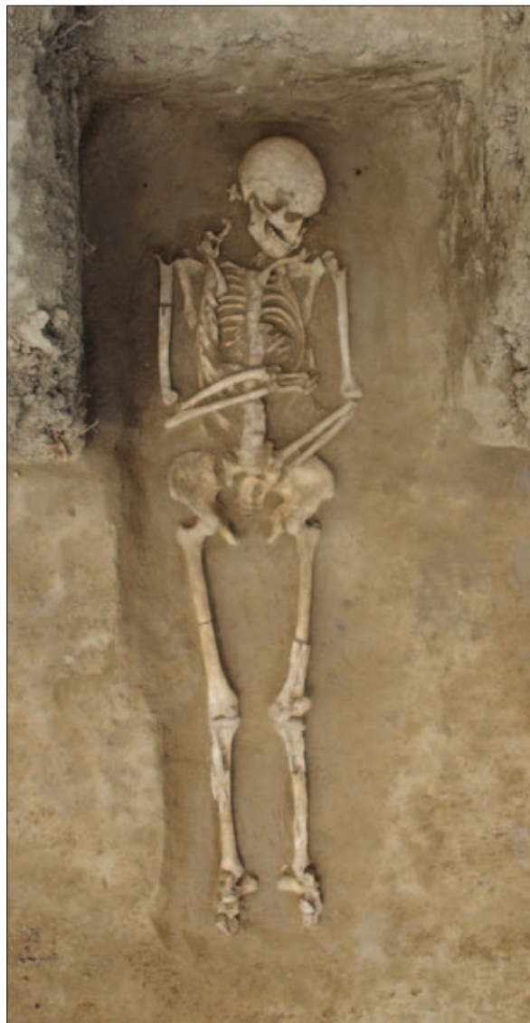
Sl. 10 Kasnoantički kosturni grob u kvadrantu C

U nastavku istraživanja poduzetom 2019. godine cilj je bio istražiti sjeverozapadnu od dvije velike strukture koje su vidljive na magnetometrijskoj snimci kao i središnji prostor tumula koji se počeo istraživati 2017. godine gdje su pronađeni i ostaci jednoga paljevinskog groba (sl. 13). Nakon iskopa najdonjega sloja nasipa tumula koji se sastojao od tamnosmeđe ilovače te polirana dosegnute razine na predzdravičnome sloju od smeđe ilovače, u kvadrantu A prepoznata je velika pravokutna zapuna pretpostavljene komore orijentacije sjeverozapad–jugoistok koja je odgovarala položaju strukture na ma-