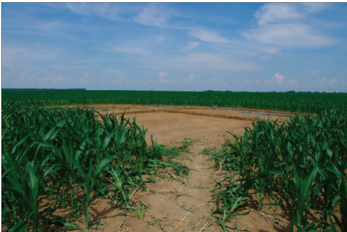
Sl. 7 Početak istraživanja tumula 1 2017. godine tijekom iskopa sloja humusa

Fig. 7 The start of the 2017 excavations of tumulus 1 during the excavation of the humus layer