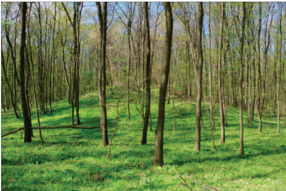
Sl. 6 Jedan od tri tumula koji se nalaze u šumi tijekom terenskoga pregleda 2016. godine