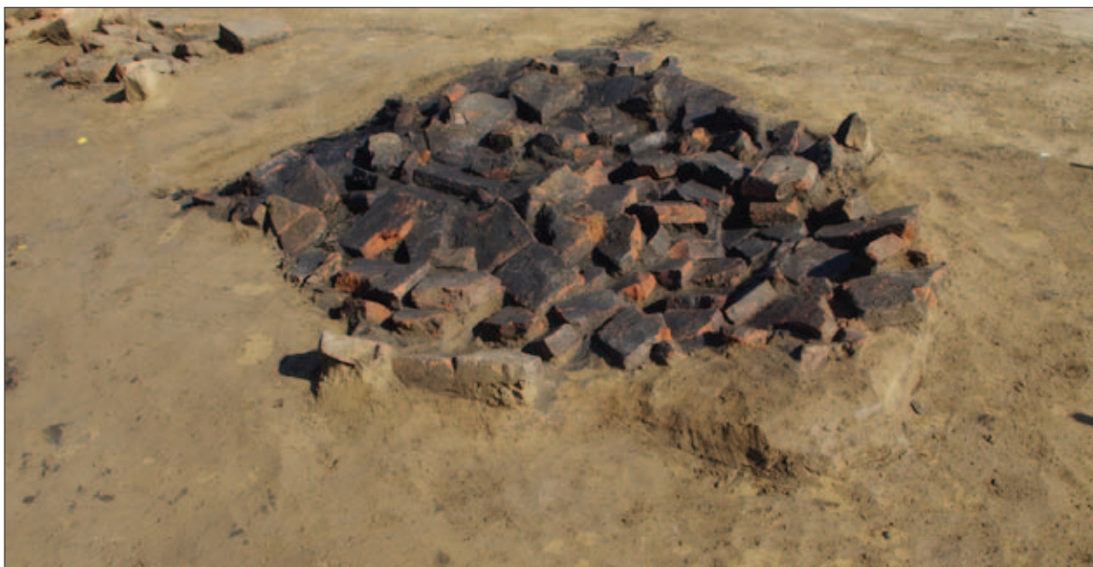
Sl. 9 Ostaci lomače od opeka

Fig. 9 The remains of a brick pyre