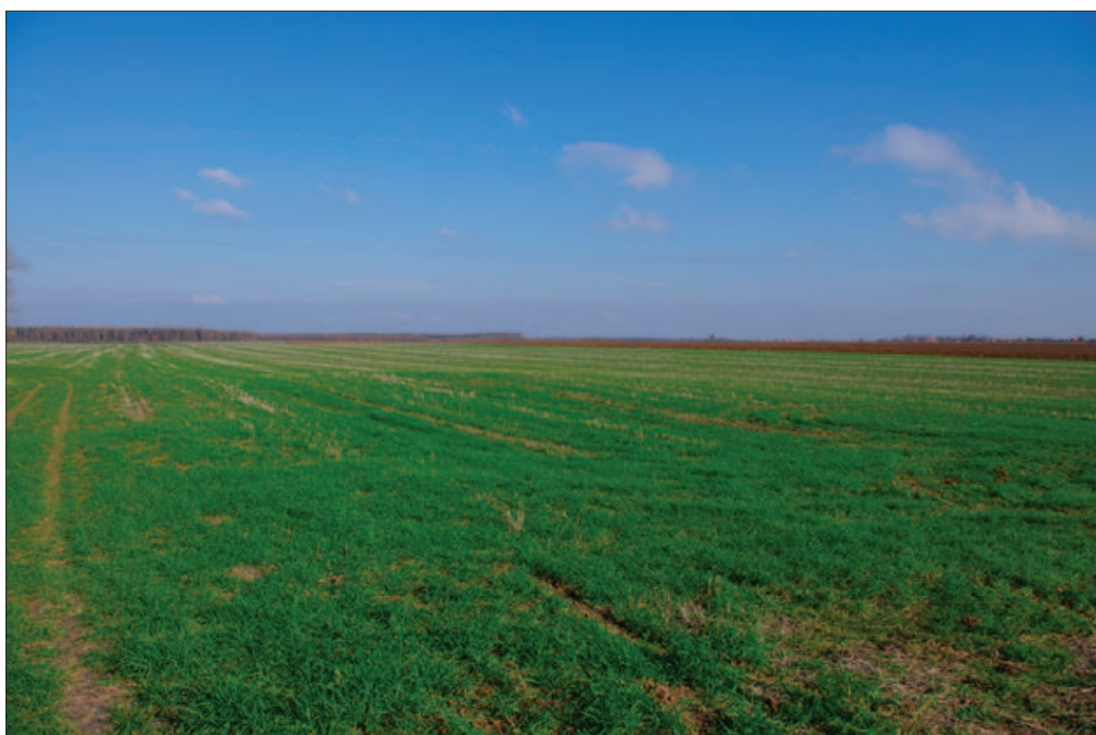
Sl. 5 Tumul 1 tijekom terenskoga pregleda 2012. godine (izvor: Fototeka GMV)

Fig. 4 The location of the site of Stari Jankovci – Jankovačka Dubrava/Stara Međa and the location of the tumulus (made by: H. Vulić; source: State Geodetic Administration)