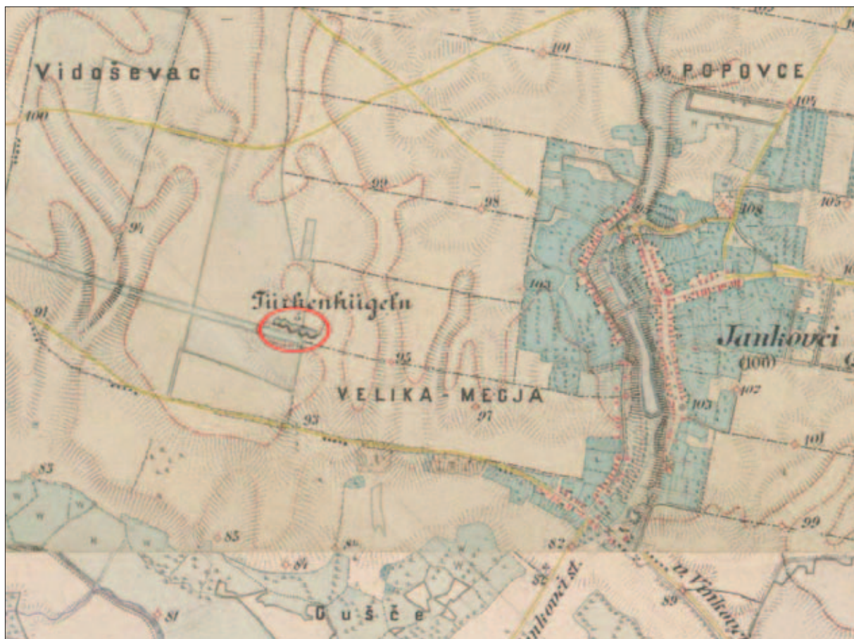
Sl. 1 Karta iz 19. stoljeća s pet dokumentiranih tumula (izradio: H. Vulić)

rimski novci (Ljubić 1880: 94). Tumule kod Starih Jankovaca potom spominje J. Brunšmid, no po njegovome opisu dva tumula nalaze se u polju, a tri su u šumi te ih datira u mjedeno doba (Brunšmid 1888: 71). Š. Ljubić ih još jednom spominje 1889. godine kada opisuje neke od nalaza – ulomak olovne ploče, dio željeznoga obruča te ulomke keramičkih posuda (Ljubić 1889: 163). 1 Tumuli nakon toga padaju u zaborav. Spominju ih tek Z. Vinski i K. Vinski-Gasparini 1962. godine kada navode sva poznata nalazišta u međurječju Save i Drave na kojima je zabilježeno postojanje tumula te ih okvirno povezuju s poznatim stariježeljeznodobnim tumulima s prostora sje-