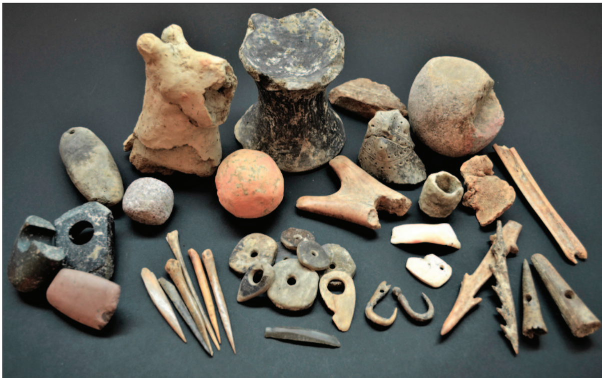
Sl. 11 Pokretni nalazi s lokaliteta AN 6 Hermanov vinograd 1

Fig. 11 Mobile finds from the site of AN 6 Hermanov Vinograd 1