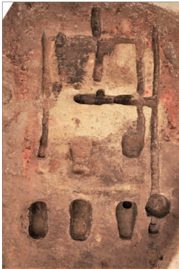
Sl. 10 Tlocrtna koncepcija ukopa mlađe faze objekta 7

Objekt 9, za kojega se smatra da pripada stambenoj arhitekturi, također dominira prostorom zapadnoga dijela lokaliteta. Paralelno se rasprostire tik uz objekt 6, s njegove zapadne strane. Zauzima oko 100 m 2 površine, orijentacije je sjever – jug. Tlocrtna shema ukopa objekta pokazuje sličnost i ujednačenost s tlocrtnom shemom starijih faza objekata 6 i 7. Naime, temeljni ukopi pojavljuju se u tri niza s po tri ukopa, a odlikuje ih masivnost. Specifičnost objekta 9 je u tome što je središnji prostor s istočne i zapadne strane omeđen temeljnim kanalima koji se protežu cijelom dužinom objekta kao temelji perimetralnih stijena na koje su okomito postavljeni nizovi manjih,