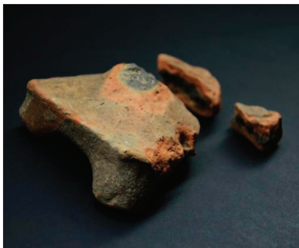
Sl. 13 Ulomci žrtvenika

Fig. 13 Fragments of the altars