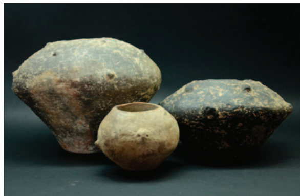
Sl. 18 Neolitičke posude iz grobova

Fig. 16 Fragment of a decorated Neolithic vessel