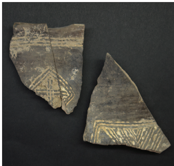
Sl. 19 Ulomci ukrašene keramike eneolitičke posude (snimio: B. Rožanković)

S obzirom na veličinu prostora na kojem se rasprostire lokalitet kao i koncentraciju arheoloških tvorevina i bogatstvo nalaza, za lokalitet AN 2 Beli Manastir – Popova Zemlja može se tvrditi da pripada arheološkim nalazištima koji svojim postojanjem neupitno obogaćuju hrvatsku arheološku baštinu. Postavlja se pitanje da li je lokalitet u jednome periodu neolitika egzistirao kao naselje, a u drugome kao groblje. Daljnje bavljenje problematikom lokaliteta koji zahtjeva podroban i ozbiljan znanstveni pristup mogao bi potvrditi ili opovrgnuti takvo promišljanje.