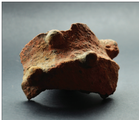
Sl. 17 Ulomak ukrašene neolitičke posude

Fig. 15 Fragment of a painted vessel of the Starčevo culture