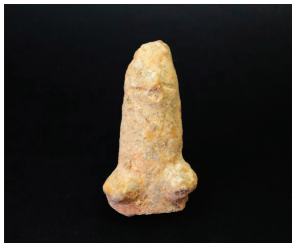
Sl. 14 Neolitička figuralna plastika

Fig. 13 Fragments of the altars