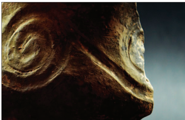
Sl. 16 Ulomak ukrašene neolitičke posude (snimio: B. Rožanković)

Rezultati istraživanja lokaliteta AN 2 Beli Manastir – Popova zemlja govore da je riječ o iznimno bogatome višeslojnom nalazištu. Mlađa faza se pripisuje antičkome periodu, a kao najznačajnije arheološke tvorevine ističu se dvije peći za proizvodnju opeke. Keramički materijal iz jama raznih namjena kao i iz pronađenog groba datiraju mlađi horizont lokaliteta u 3. stoljeće. Stariju fazu određuju brojne arheološke tvorevine koje pripadaju prapovijesnome periodu, a koje definiraju karakter lokaliteta kao nasebinski. Naime, posebnost lokaliteta je prostorna veličina prapovijesnoga naselja od gotovo 15.000 m 2 ko-