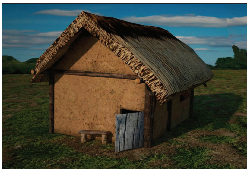
Sl. 2 Idealna digitalna rekonstrukcija kasnolateske nadzemne kuće u Novoj Bukovici čiji je tlocrt otkriven tijekom istraživanja 2014. godine (izradio: M. Mađerić)