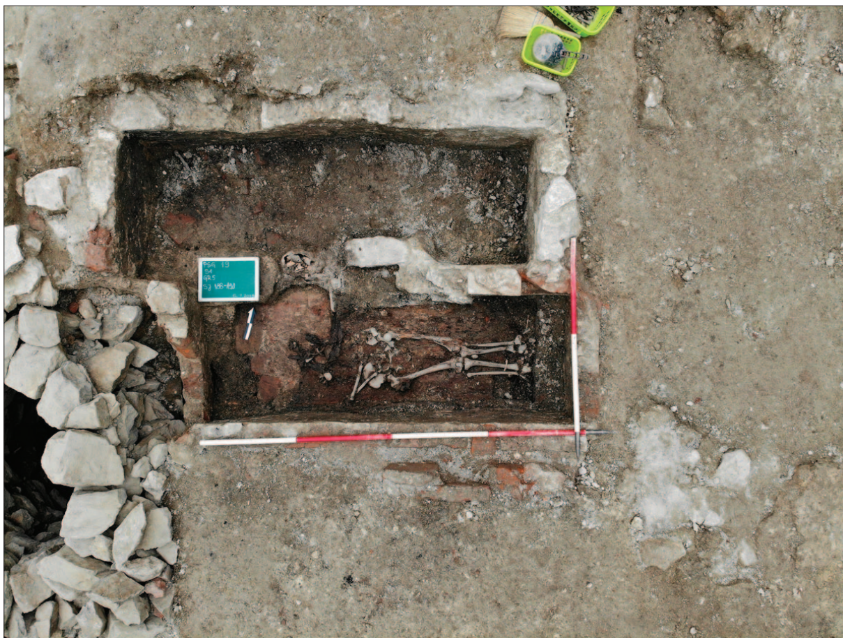
Sl. 15 Kamenom zidana grobnica (gore) i opekom zidana grobnica (dolje) s ostacima pokojnika i tragovima lijesa

Fig. 15 Stone masonry tomb (above) and brick masonry tomb (below) with the remains of the dead and traces of the coffin