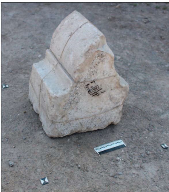
Sl. 3 Ulomak svodnoga rebra bademastoga presjeka

Fig. 2 Collapsed material in the western nave