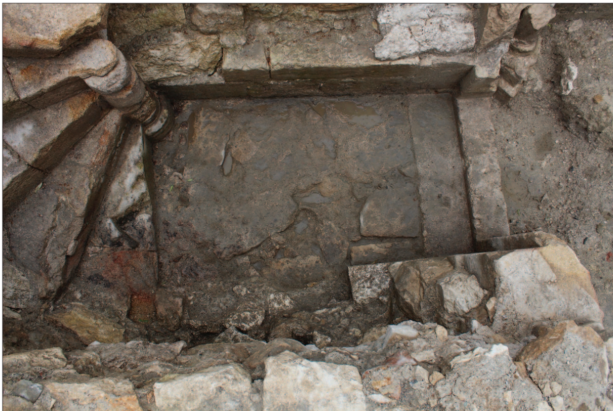
Sl. 8 Kameno popločenje u predprostoru stubišta te prag i najdonji dijelovi dovratnika na samome ulazu u njega

Fig. 8 Stone paving in the vestibule of the staircase and the threshold and lowest parts of the door jamb at the very entrance to it