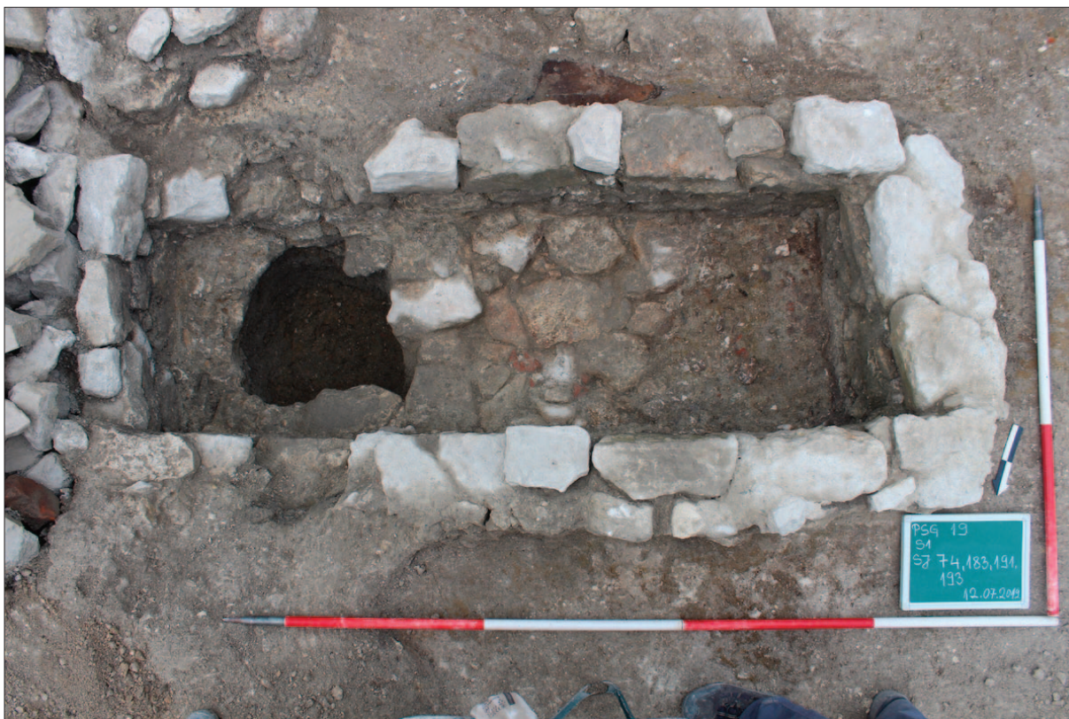
Sl. 10 Kamenom zidana grobnica s kamenom podnicom, naknadno probijena ukopom za stup

Fig. 10 Stone masonry tomb with a stone floor, later drilled to make a posthole