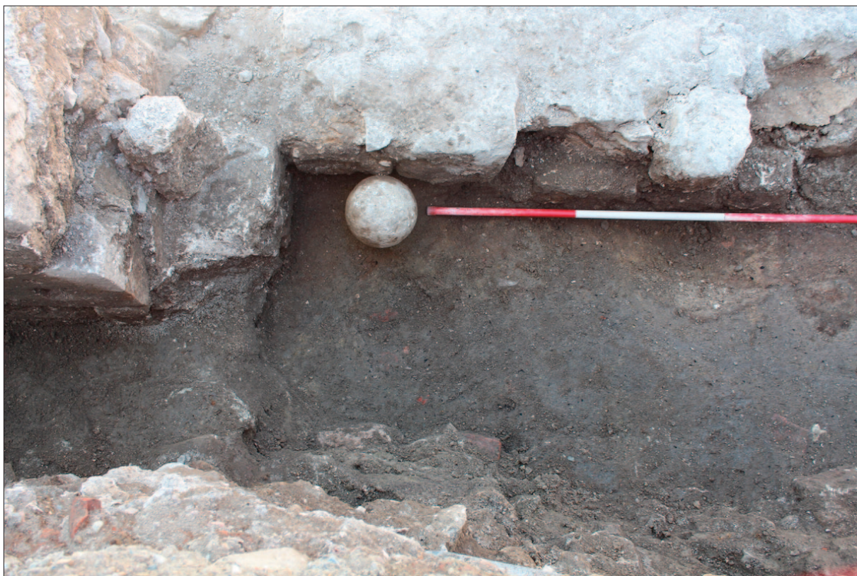
Sl. 9 Kameni kuglasti projektil pronaden s vanjske strane stubišta

Fig. 8 Stone paving in the vestibule of the staircase and the threshold and lowest parts of the door jamb at the very entrance to it