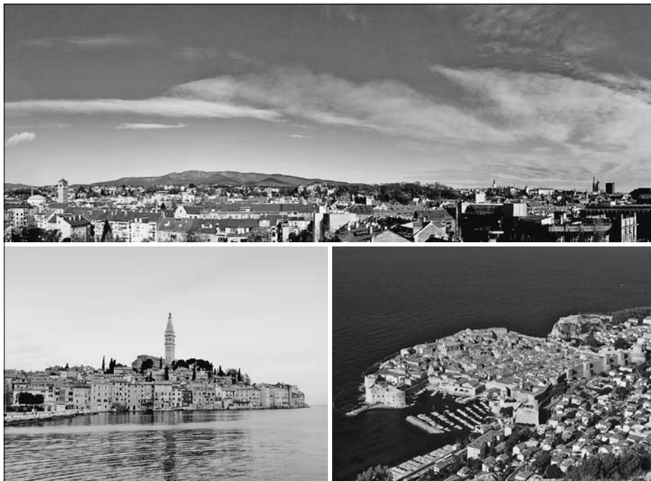
SL. 5. PANORAMSKE SLIKE GRADOVA FIG. 5 PANORAMIC IMAGES OF THE CITIES

na osnovi dva čimbenika: fizičkog i perceptivnog. Fizičke varijable estetike jesu ritam 70 , harmonija s pejzažom 71 , odnos prema nebu (težnja k visini) 72 , interpunkcija 73 , apstraktna forma 74 , slojevitost 75 , okvir 76 . Perceptivne varijable estetike jesu: dramatičan pristup 77 , sekvencijsko otkrivanje 78 , jukstapozicija 79 , metaforičko značenje/gledanje 80 . Booth u svojoj analizi Attoeva pristupa zaključuje kako su to najsveobuhvatnije postavljene kriteriji za vrjednovanje estetike skylinea dostupni u akademskoj literaturi. Kao estetske komponente prema kojima se mogu međusobno razlikovati vrlo vrijedni, vrijedni ili negativno utjecajni panoramski pogledi Lipovac navodi: teksturu, razlicitost, mjerilo, kontrast, posebnost, sekvence i kompoziciju . Kropf naglašava kako je promatranje grada kroz njegovo urbano tkivo samo jedan od načina percepcije grada. Ostale specifične perspektive uključuju statične i dinamične elemente koji su dio gradskoga karaktera. Kao primjer za to navodi poglede i perspektive, kao što su pogled na, pogled iz i pogled unutar grada, uključujući skylinee, sekvencijalne poglede , elemente ili kombinacije elemenata koji čine landmarke, rubove ili granice, ulazne točke ili prolaze , te uzorke javno dostupnog otvorenog prostora . 81