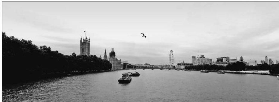
Sl. 3. SILUETA LONDONA – POGLED S LAMBETH BRIDGEA FIG. 3 SILHOUETTE OF LONDON – VIEW FROM LAMBETH BRIDGE