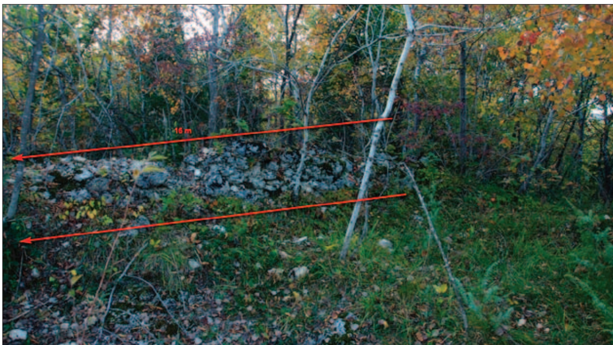
Sl. 5 Mogući ostaci grobljanskoga ili kasnoantičkoga zida na lokaciji Oranice – Groblje

Fig. 4 View of the location of the old chapel and cemetery in Cernik; toponym Oranice – Groblje