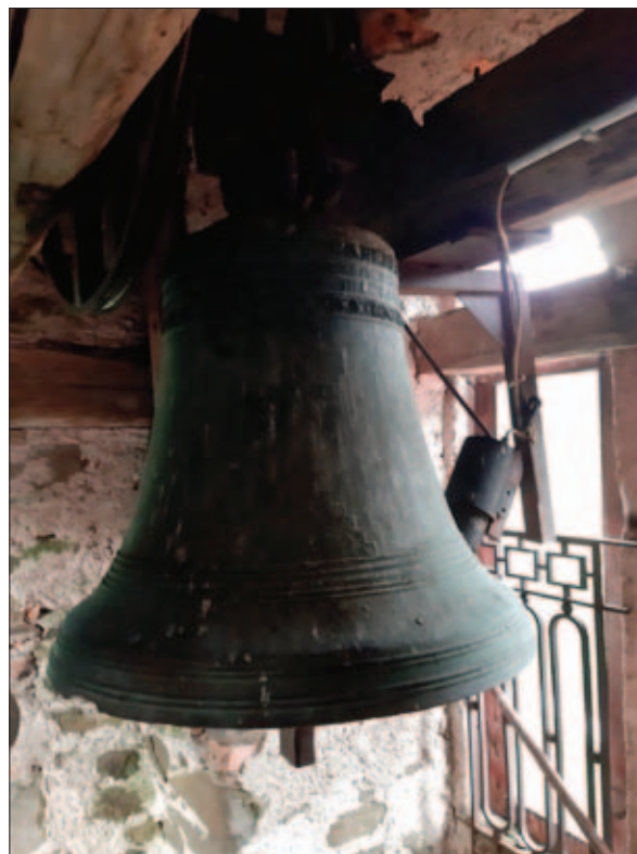
Sl. 10 Zvono u Osilnici

Fig. 9 Church bell in Cernik