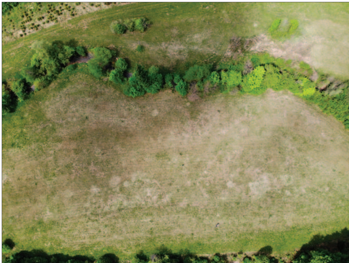
Sl. 12 Postojeće stanje na položaju Stupe – St. Tricze

Posljednja, treća toponimska grupacija nalazi se između mjesta Grič, Petričko Selo i Tomaševci. Na toponimu Palača – pod Mičila, u blizini mjesta Cerovica, nalazi se čeka i hranilište za divljač na platou oko kojega se šumski put spušta dalje u udolinu u kojoj se nalazi