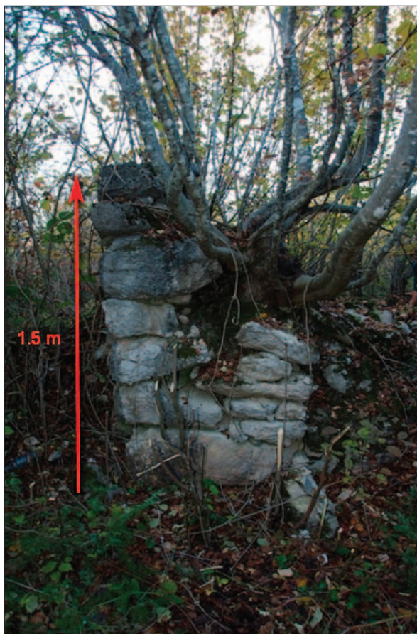
Sl. 8 Ostaci zida stare kapele na lokaciji Oranice – Groblje (snimila: J. Maslač; obradio: L. Štefan)

Fig. 8 Remains of the wall of the old chapel at the site of Oranice – Groblje (photo by: J. Maslač; modified by: L. Štefan)