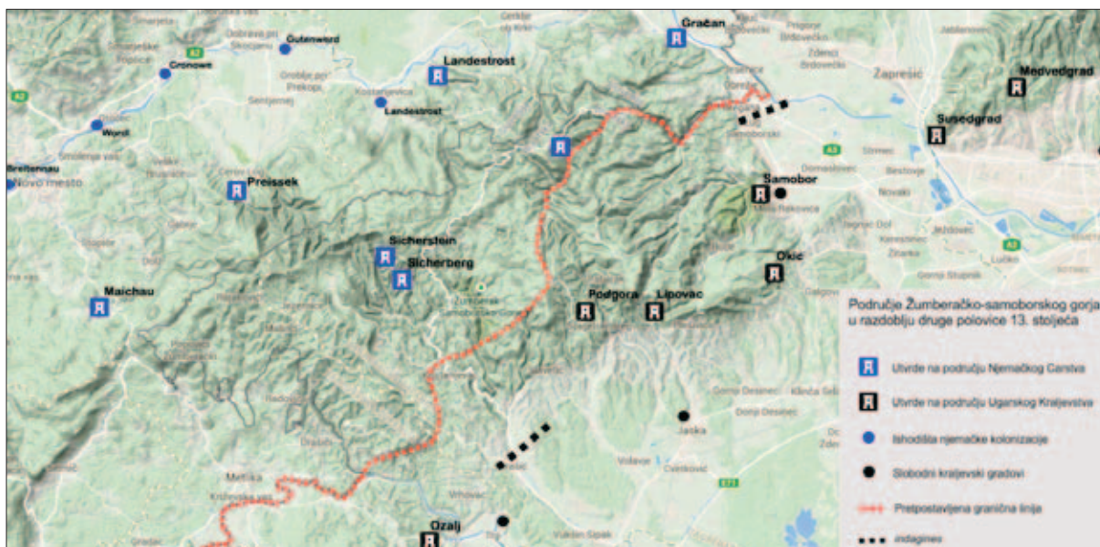
Karta 1 Utvrde s područja Žumberačkoga gorja u srednjem vijeku (prema: Sekulić 2017: 14)