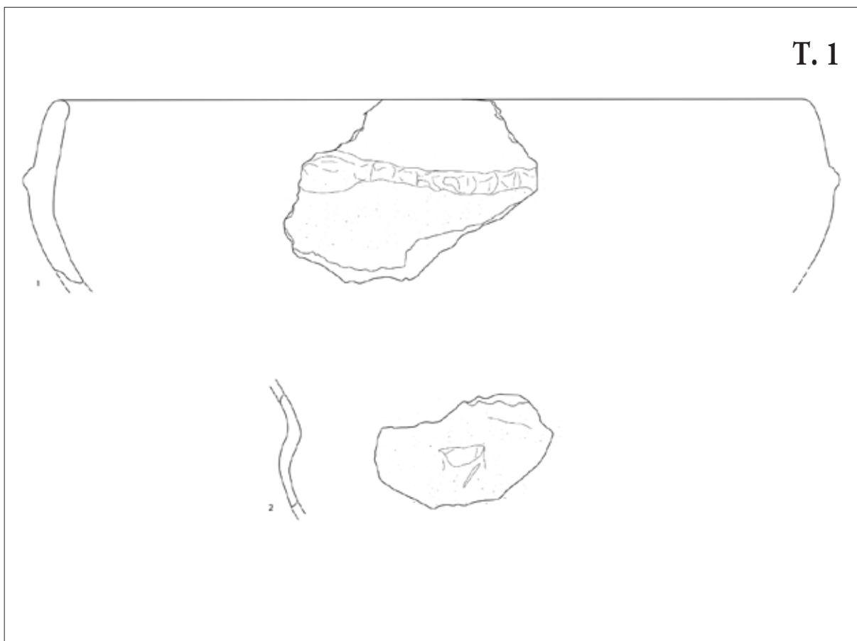
T. 1: 1 Ulomak posude s ukrasom i drškom; 2 ulomak posude sa slomljenom ručkom (crtež: M. Mrvelj, J. Maslač)

Pl. 1: 1 Fragment of a vessel with ornament and handle; 2 Fragment of a vessel with broken handle (drawing by: M. Mrvelj, J. Maslač)