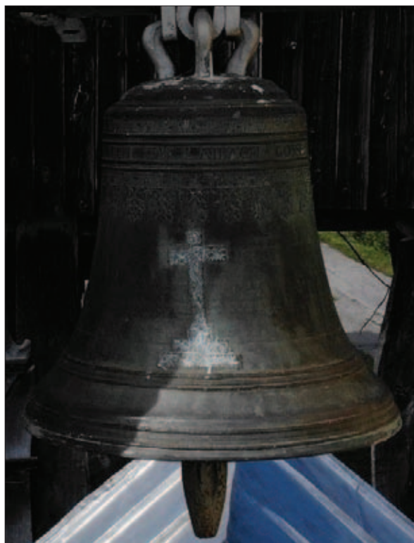
Sl. 9 Zvono u Cerniku

Fig. 9 Church bell in Cernik