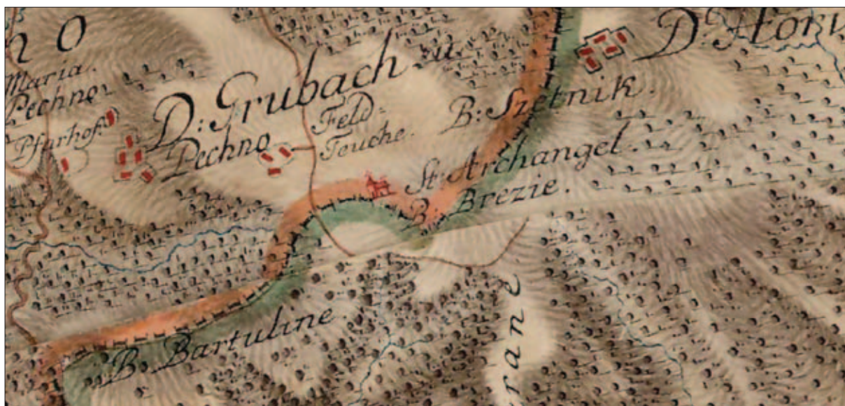
Sl. 13 Crkva St. Archangel B. Brezie na karti Karlovačkoga generalata iz 18. st. (izvor: https://mapire.eu ; pristupljeno 02. 10. 2019.)

Fig. 13 Church of St. Archangel B. Brezie on the 18th-century map of the Karlovac Generalat (source: https://mapire.eu ; accessed: 02 October 2019)