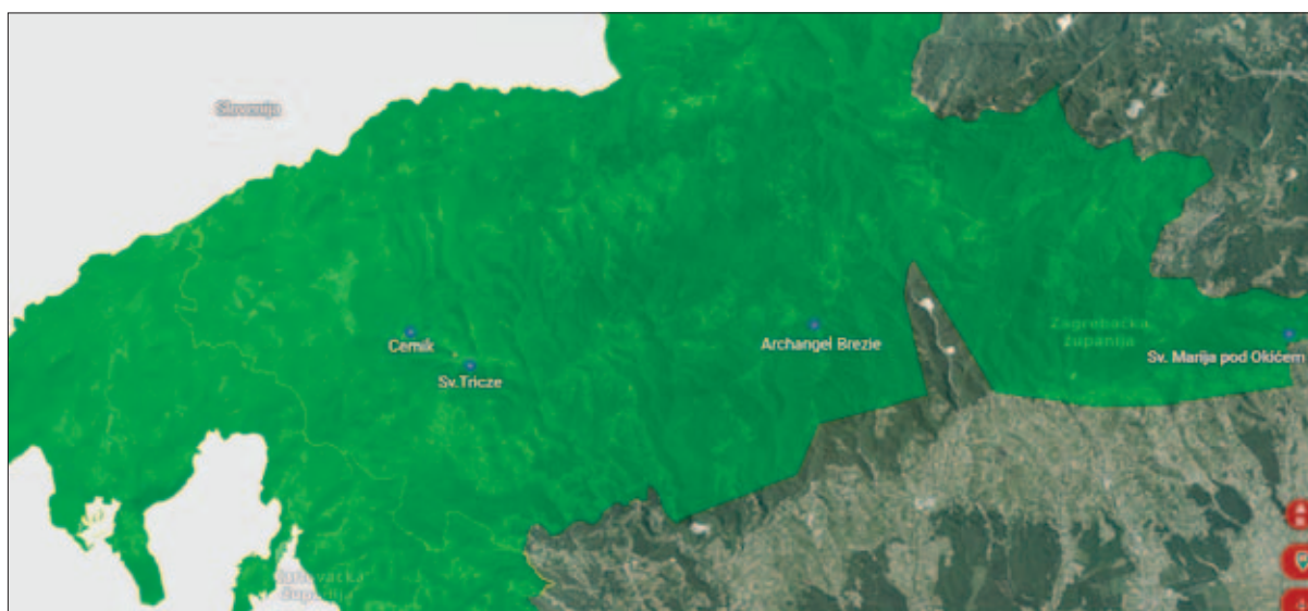
Karta 3 Položaj lokaliteta s najvećim arheološkim potencijalom