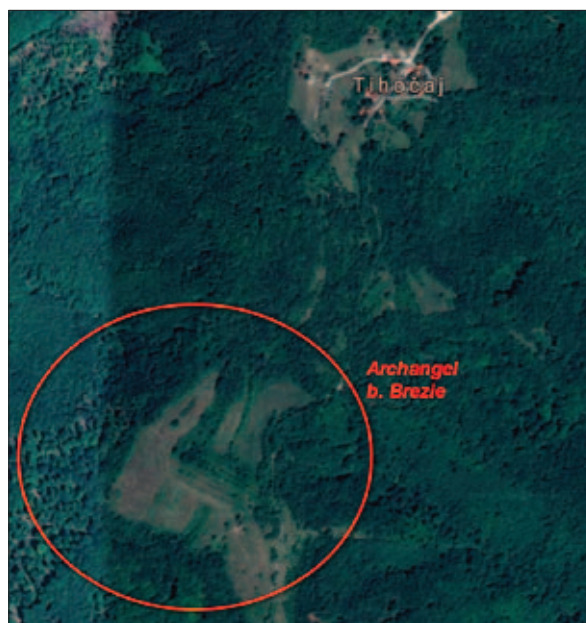
Sl. 14 Pretpostavljeni položaj crkve St. Archangel u odnosu na mjesto Tihočaj (izvor: https://maps.google.com ; obradio: L. Štefan)

Terenski pregled proveden je i u samome mjestu Gračac Slavetički kao odgovor na poziv stanovnika koji tvrde da su se na njihovome posjedu nalazili crkva i gro-