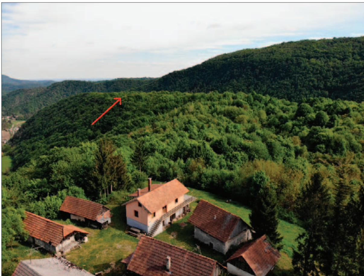
Sl. 4 Pogled na poziciju stare kapele i groblja iz Cernika; toponim Oranice – Groblje

Fig. 4 View of the location of the old chapel and cemetery in Cernik; toponym Oranice – Groblje