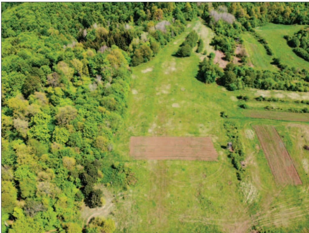
Sl. 15 Pogled na oranicu i položaj St. Archangel – Brezie iz zraka