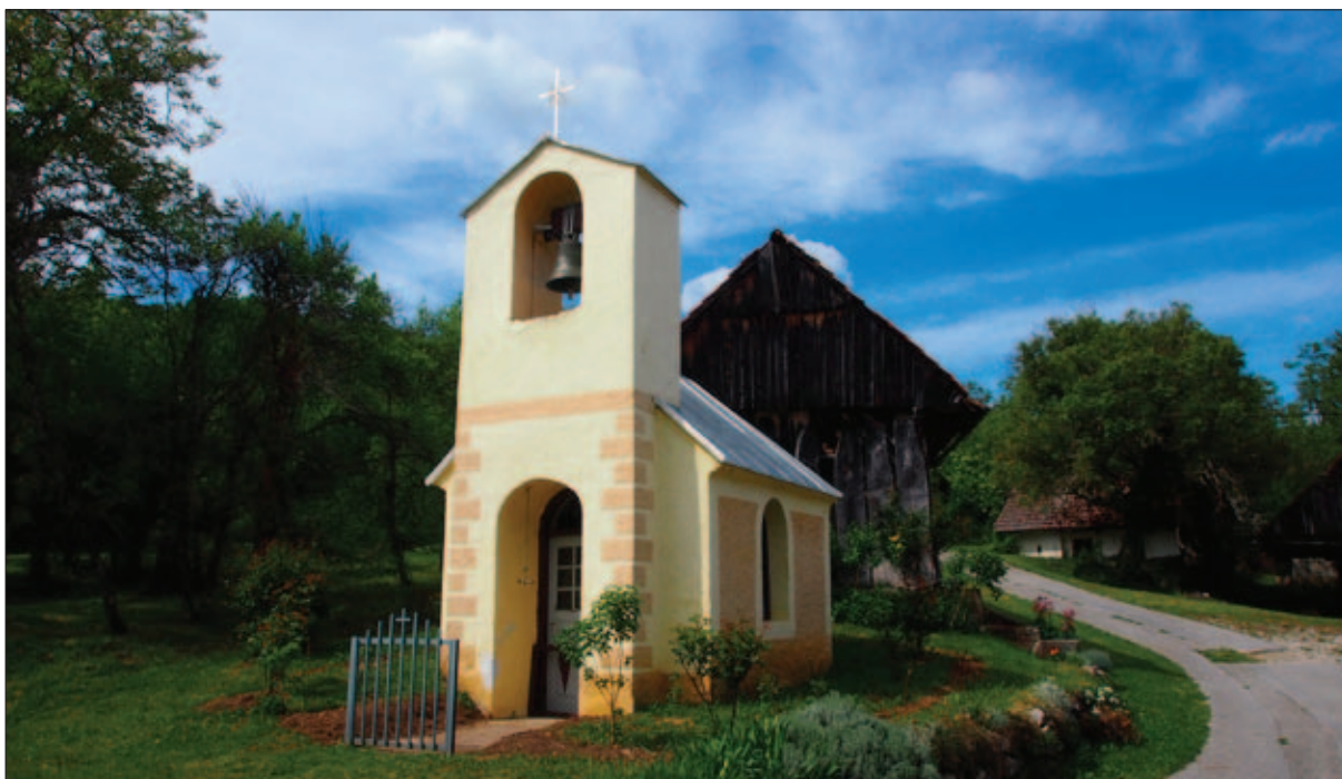
Sl. 2 Kapela sv. Jelene Križarice u Cerniku