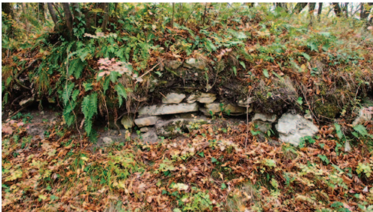
Sl. 16 Ostaci mogućega zida na lokaciji Sv. Marija pod Okićem