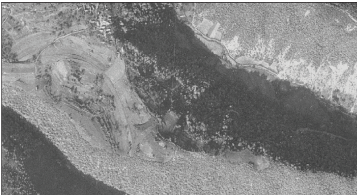
Sl. 6 Orto-foto snimak Cernika iz 1968. godine

Fig. 6 Orto-photo image of Cernik made in 1968 (source: https://ispu.mgipu.hr ; accessed: 02 October 2019)