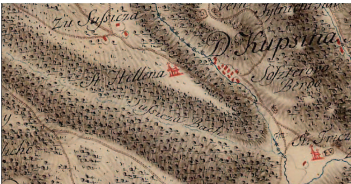
Sl. 3 Detalj s karte Karlovačkoga generalata iz 18. st. s ucrtanom kapelom sv. Jelene (St. Hellena) Križarice i sakralnoga objekta St. Tricze (izvor: https://mapire.eu ; pristupljeno 02. 10. 2019.)