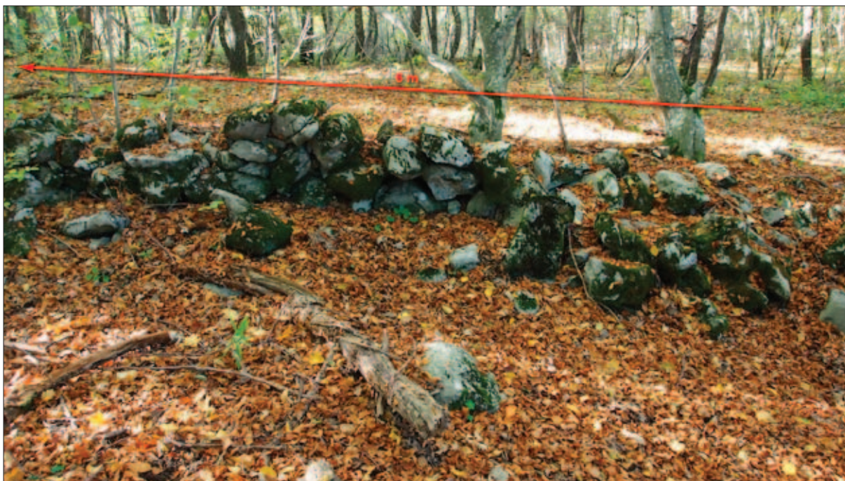
Sl. 1 Ostaci zida uz šumski put na lokaciji Šuma gradina (snimila: J. Maslač; obradio: L. Štefan)