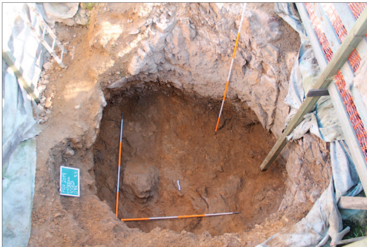
Sl. 2 Ukop cisterne, pogled s juga