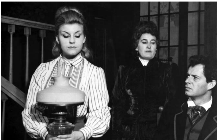
Henrik Ibsen: Sablasti , ZDK, 1963.

predstava u Parovoj režiji biser je u kruni hrvatskih scen-skih uprizorenja. To je tako i tu nema dvojbe. O toj je izvedbi napisano mnogo mudrih stvari, ali evo ipak i moga skromnog priloga u obliku sjećanja na rad. Lako, smireno, bez lutanja i sumnji, Parova koncepcija primila nas je u svoje krilo i ostavila nam slobodu da se prema vlastitim mogućnostima i sklonostima u potpunosti izrazimo. No čujmo čega se sjeća Žorž. Citiram: Prvi čitači pokusi su se zbivali kod Tonka i Neve u Zatonu Malom. Sunčali smo se i kupali. Bilo je to više nalik nekom antičkom simpoziju nego onom što podrazumijevamo pod čitačim pokusima. Ta ležernost, kad danas o tome razmišljam, bila je zapravo prava i dragocjena priprava za samu estetsku bit koncepta dubrovačkog Areteja. Kao što je poznato glumci su se na toj predstavi fizički dodirivali s publikom. U toj i takvoj situaciji bilo je deplasirano docirati Krležin tekst na što naizgled navodi njegova povišena retorika... upravo obratno, trebalo je svesti Krležine literarne rečenice na nivo dnevnog govora i tako omogućiti da filozofska i moralna dimenzija Krležina teksta bude prihvaćena od