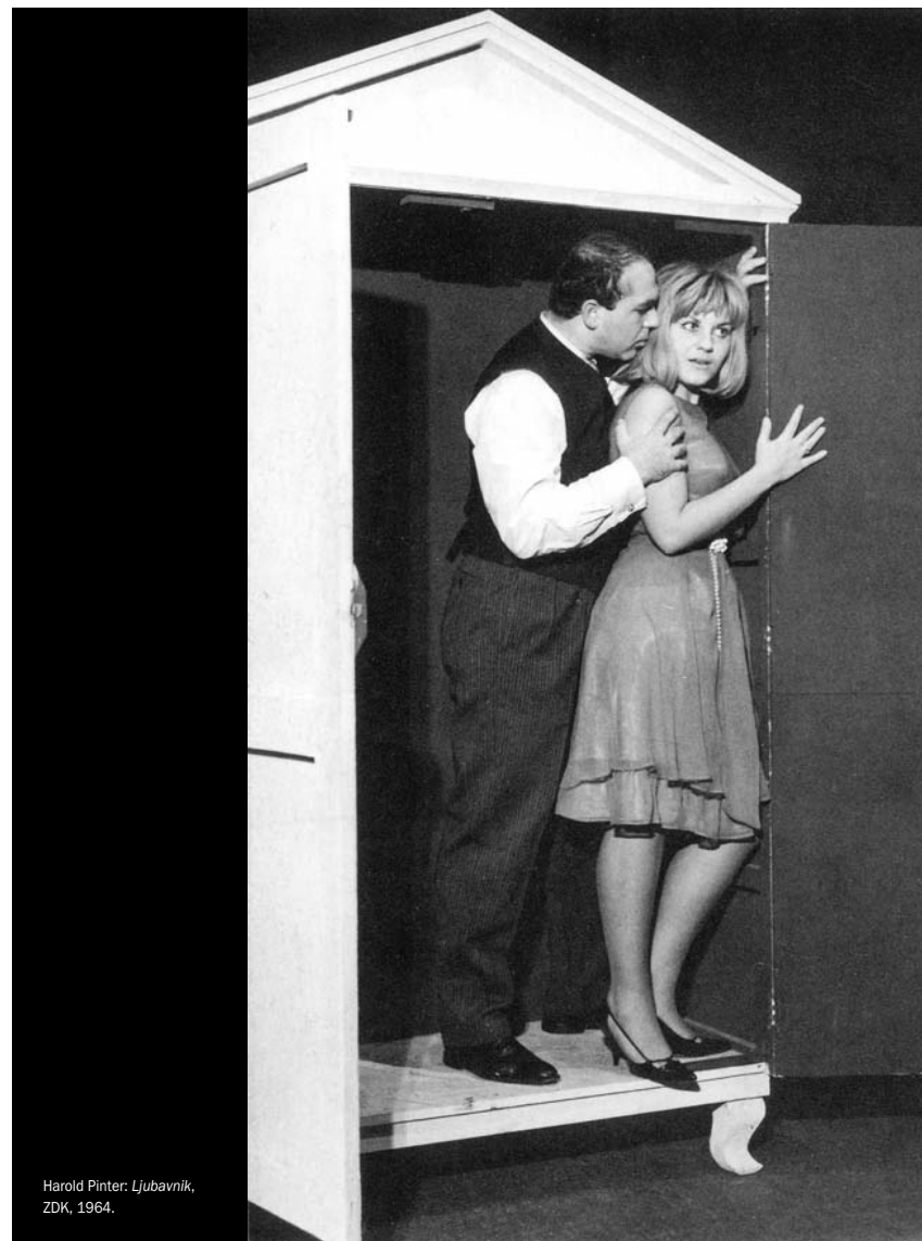
Harold Pinter: Ljubavnik , ZDK, 1964.