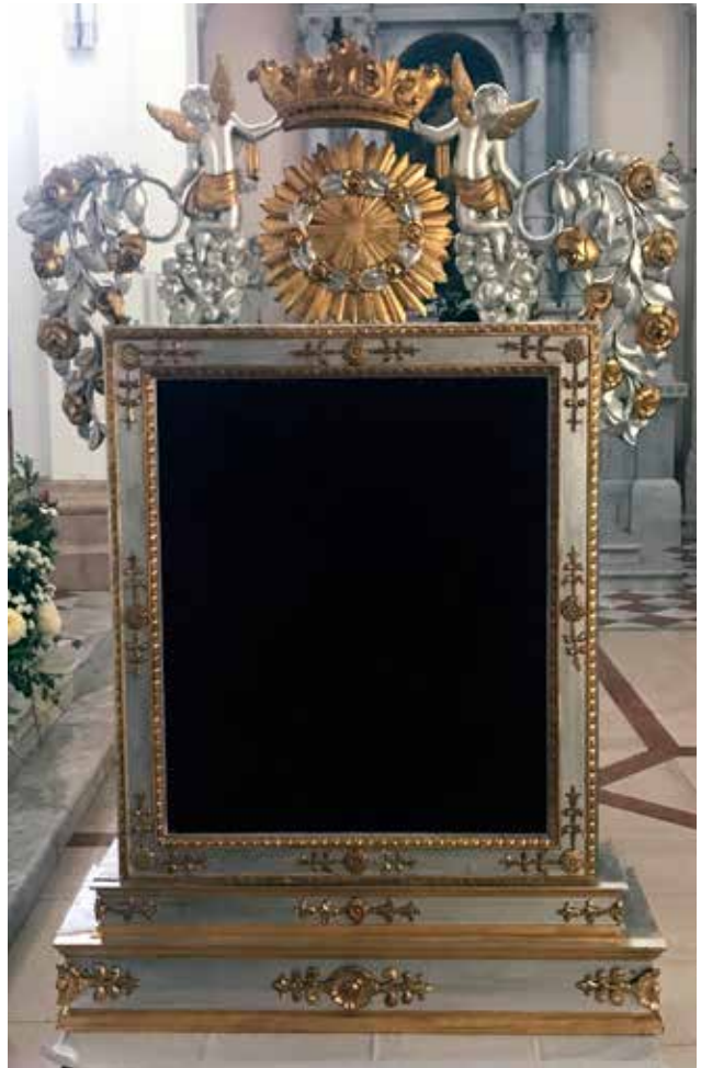
20 Stražnja strana okvira nakon zahvata Back side of the frame after restoration

Pastorizaciji oslobođenih prostora Dalmatinske zagore uvelike su doprinijele svete Prilike koje su vjernici na poseban način štivali. U Imotskom, uz zavjetnu sliku Gospa od Anđela , na osobit način štuje se slika Gospa od Zdravlja . Sliku je iz Venecije 1738. godine u Imotski poslao hrvatski književnik i filozof fra Filip Grabovac. Uz ovu sliku, fra Filip je franjevačkom samostanu na Dobrom u Splitu poslao gotovo istovjetnu sliku Bogorodice s Djetetom koja se također štuje kao Gospa od Zdravlja . Kako su otprilike u isto vrijeme slične Bogorodičine slike stigle u