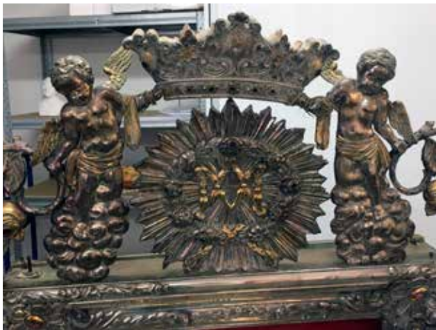
13 Zatečeno stanje atike Condition of the upper tier before restoration

sjedeće skulpture anđela s krilima koji u rukama drže cvijeće, dok se na vrh zabata isturena u prostoru oslanjaju dva anđela koji svojim podignutim rukama pridržavaju metalnu krunu. Iznad zabata je atika čije su bočne stranice ukrašene volutama i vegetabilnim motivima u visokom reljefu. Na njenom vrhu je križ. Nakon što je oltar izrađen i u crkvi montiran, u njegovu nišu postavljena je slika Gospe od Zdravlja u srebrnom okviru, gdje se i danas nalazi (sl. 11).