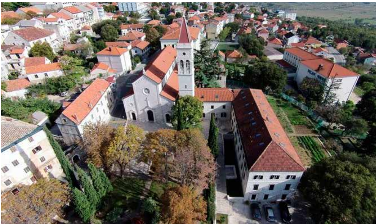
6 Crkva sv. Franje Asiškog i samostan Church and convent of St Francis of Assisi

sv. Marka, ali i radi odnosa koji rt ima prema otoku San Giorgio, trgu sv. Marka i zavjetnoj crkvi Il Rendetore , s kojima tvori simbolički luk. Crkva se gradila od 1631. do 1681. godine i nazvana je Santa Madona della Salute (Gospa od Zdravlja). 28 Štovanje i slavljenje blagdana Gospe od Zdravlja, koji se slavi na dan Marijinog prikazanja u hramu, vrlo brzo se proširio na sve krajeve pod Mletačkom vlašću pa tako i u Dalmaciju.