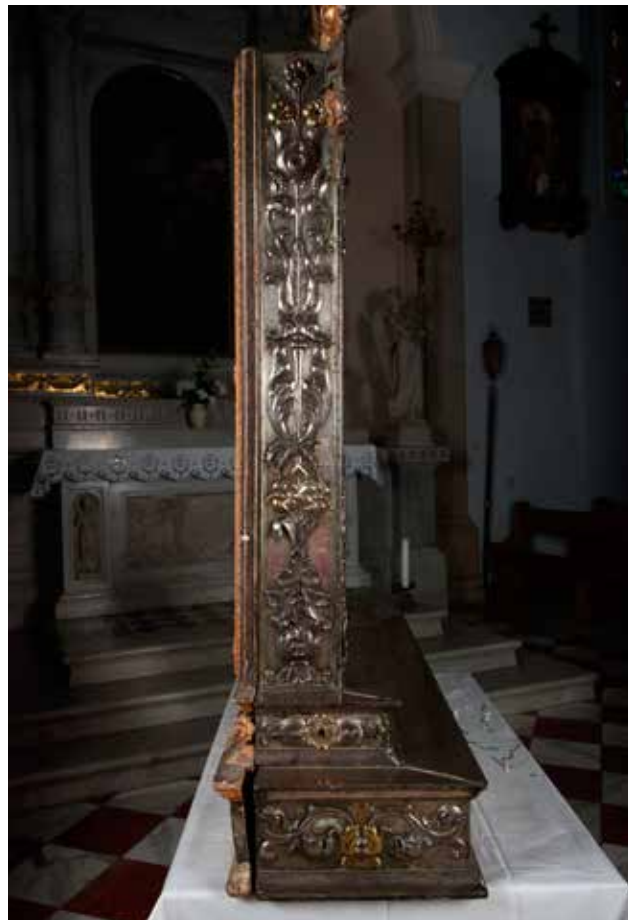
14 Zatečeno stanje bočne strane okvira Condition of the lateral side of the frame before restoration

Protokom vremena okvir je pretrpio znatna oštećenja (sl. 12). Srebrni lim je oksidirao te je dijelom bio prekriven produktima korozije i nečistoćama tamnosrebrne, bijele, tamnožute i zelene boje. Nataloženi sloj nečistoće, vidljiv s obje strane okvira, nastao je dugogodišnjim nakupljanjem prašine i čađe kao produkta izgaranja svijeća i voska. Na površini srebra bili su vidljivi tragovi čišćenja, površinskih ogrebotina i udubljenja. Na više mjesta nedostajali su čavlići koji su ga spajali s drvenom podlogom. Na pojedinim mjestima čavli su bili zamijenjeni recentnim željeznima koji su korodirali te povećali svoj volumen, mehanički oštetili predmet te ga dodatno obojili korozijom željeza (sl. 13). Pozlata je na pozlaćenim dijelovima bila istrošena te se ispod nje naziralo srebro. Bila je prekrivena produktima korozije i nečistoćama tamnožute, crne i bijele boje. Srebrni dio bio je oštećen mehaničkim putem u vidu nedostajućeg materijala, savijenoga srebrnog lima, napuknuća materijala kao i tragova prijašnjih intervencija. Fino izrađeni ukrasi nagrđeni su na mnogo mjesta upravo savijanjem i gnječanjem tankog lima te rupicama prijašnjih popravaka. Velik broj ukrasa kao što su fragmenti cvjetnih vitica, listova akantusa i pozlaćenih cvjetova nedostajao je, kao i neki ukrasni kamenčići (raznobojna stakalca). Prijašnjim neadekvatnim intervencijama oštećeni i odvojeni dijelovi