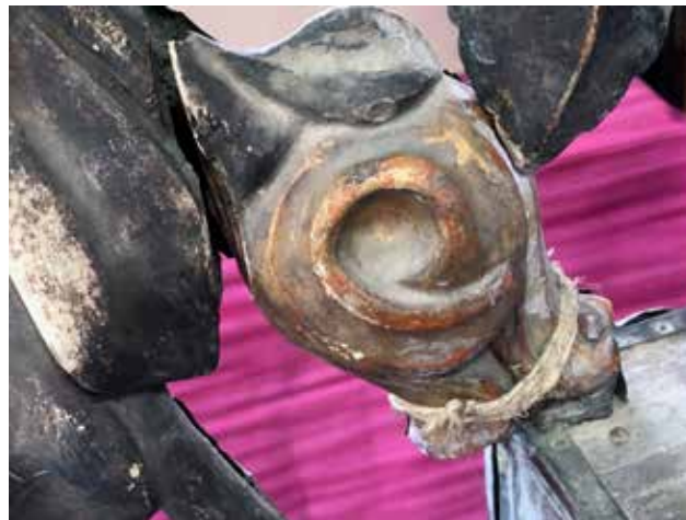
16 Zatečeno stanje vitice (fototeka KIM, 2019.) Condition of a tendril before restoration (KIM photo library, 2019)