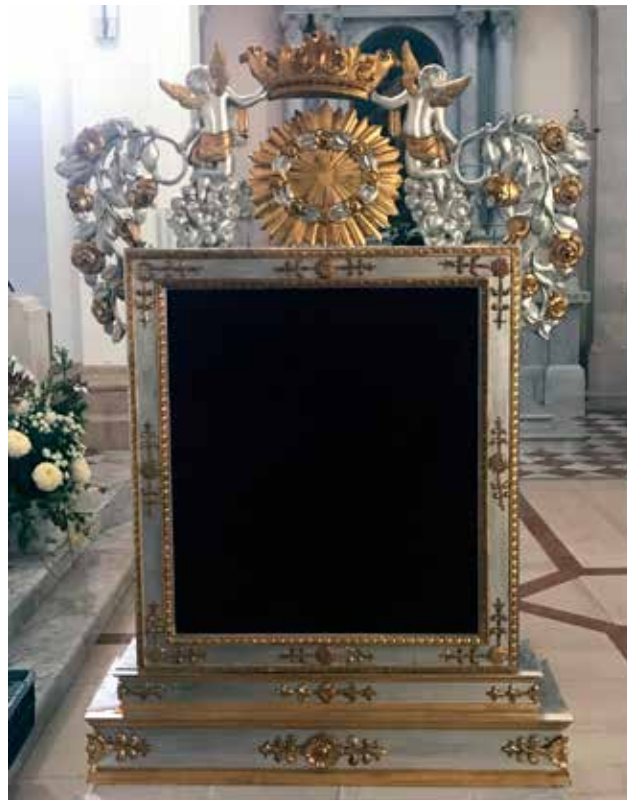
10 Stražnja drvena strana okvira slike Gospe od Zdravlja (fototeka KIM, 2019.)

Wooden back side of the frame of the painting of Our Lady of Health (KIM photo library, 2019)