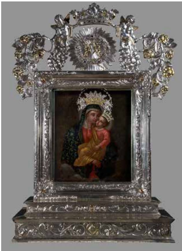
9 Srebrni okvir sa slikom Gospe od Zdravlja Silver frame with the painting of Our Lady of Health