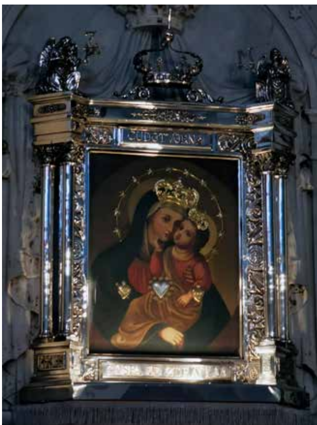
2 Slika Gospe od Zdravlja iz crkve Gospe od Zdravlja u Splitu

Painting of Our Lady of Health from the church of Our Lady of Health in Split