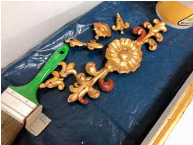
19 Rekonstrukcija nedostajućih dijelova (fototeka KIM, 2019.) Reconstruction of missing parts (KIM photo library, 2019)

na kruni retuširana je nakon pozlaćivanja akrilnim bojama. Posrebrjeni dijelovi koji nisu bili sačuvani ispolirani su, jer je površina preparacije bila dobro sačuvana i kompaktna. Za poliranje površine korišteni su brusni papiri fine granulacije, nakon čega je površina zaštićena slojem šelaka. Srebrni listići lijepljeni su na mikstionu te su nakon sušenja zaštićeni slojem laka. Prije spajanja drvenog i metalnog dijela u cjelinu očišćena je i obnovljena konstrukcija koja se nalazila između njih. Oštećeni i šuplji dijelovi podkonstrukcije izrađeni su od novog drva. Prilikom spajanja dijelova u cjelinu bila je potrebna velika pažnja kako se dijelovi metala, pozlate i posrebrjenja ne bi oštetili jer su svi dijelovi vraćeni na izvorni način, ukucavanjem sitnih čavlića u drvenu konstrukciju. Nakon pričvršćivanja metalnog okvira za drveni dio okvira nanese sloj voska ispoliran je do sjaja. Staro staklo, unatoč nesavršenosti u vidu mjehura zraka na donjem dijelu površine, zbog njegove vrijednosti i autentičnosti zadržano je i ponovno montirano na obnovljeni okvir (sl. 20, 21). Okvir je krajem listopada 2019. godine vraćen u crkvu te je u njega vraćena slika Gospa od Zdravlja , a potom je montiran na svoj oltar. Ovaj dugotrajan i skup, ali neophodan zahvat financirao je imotski vjernički puk.