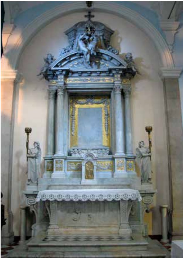
11 Bogorodičin oltar u crkvi sv. Franje Asiškog Altar of the Madonna in the church of St Francis of Assisi