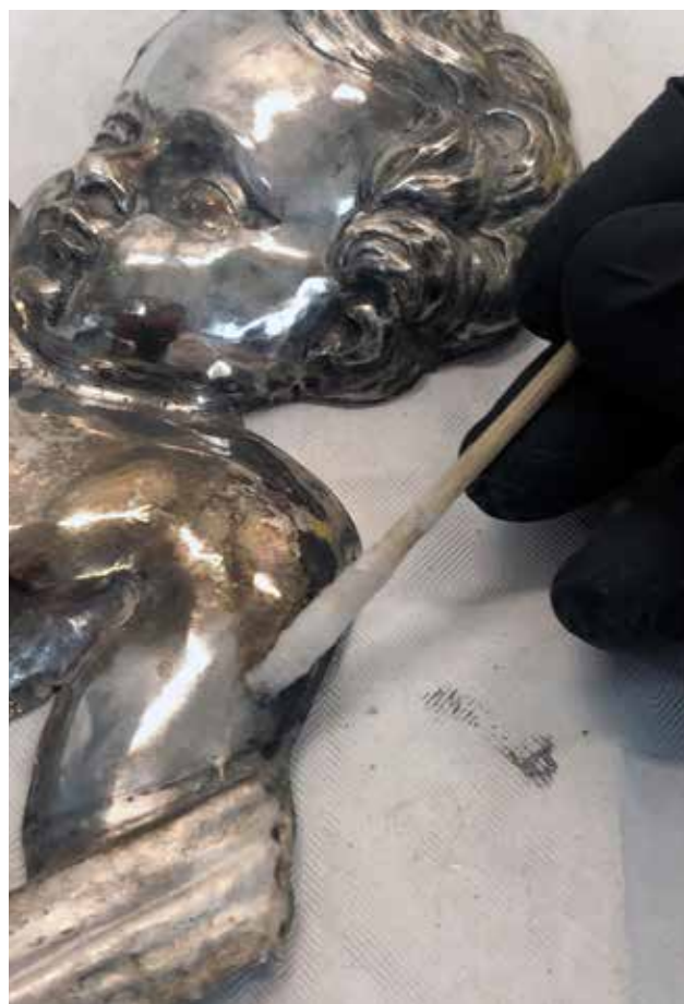
18 Čišćenje oštećenih dijelova (fototeka KIM, 2019.) Cleaning of damaged parts (KIM photo library, 2019)

Drveni dio okvira sa zlatom i srebrom očišćen je od površinskih nečistoća. Uklanjanje je izvršeno kombinacijom kemijskog i mehaničkog čišćenja. Nataložena nečistoća uklanjala se vatenim tamponima namočenim različitim otapalima, alkoholom, white spiritom i acetonom. Dijelovi pozlate i posrebrjenja na kojima je bila nataložena čvršća inkrustacija i vosak dodatno su čišćeni mehanički upotrebom skalpela. Posrebrjenje većim dijelom nije bilo sačuvano. Svi dijelovi preparacije koji su bili napukli ili su se odvojili od podloge podlijeplje-