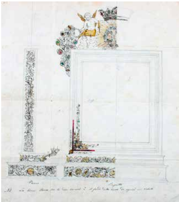
7 Nacrt za srebrni okvir slike Gospe od Zdravlja Design for the silver frame of the painting of Our Lady of Health

od Zdravlja, budući da se zavjetna slika Gospe od Anđela čuvala u njenoj crkvi na tvrđavi Topani.