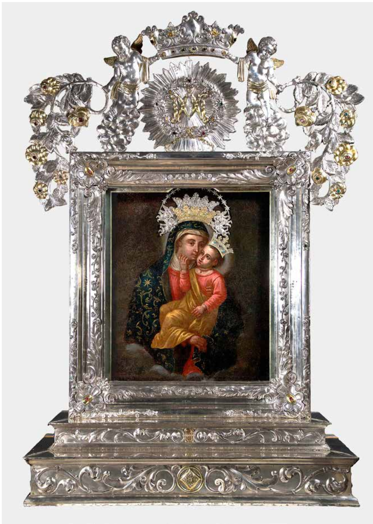
21 Prednja strana okvira nakon zahvata Front side of the frame after restoration