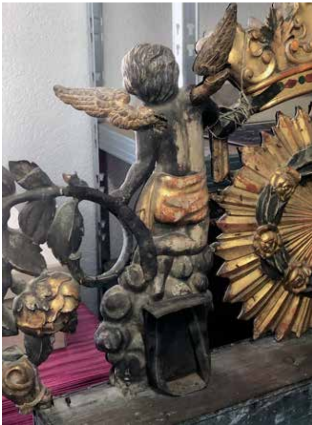
15 Zatečeno stanje anđela Condition of angel figures before restoration

Zajedničkim dogovorom imotskog gvardijana fra Kristiana Stipanovća i nadležnih konzervatora odlučeno je kako je, zbog jako lošeg stanja, nužno obnoviti srebrni okvir slike. 46 U veljači 2019. godine okvir je poslan na restauraciju u restauratorsku radionicu tvrtke Kvinar d.o.o. iz Podstrane.