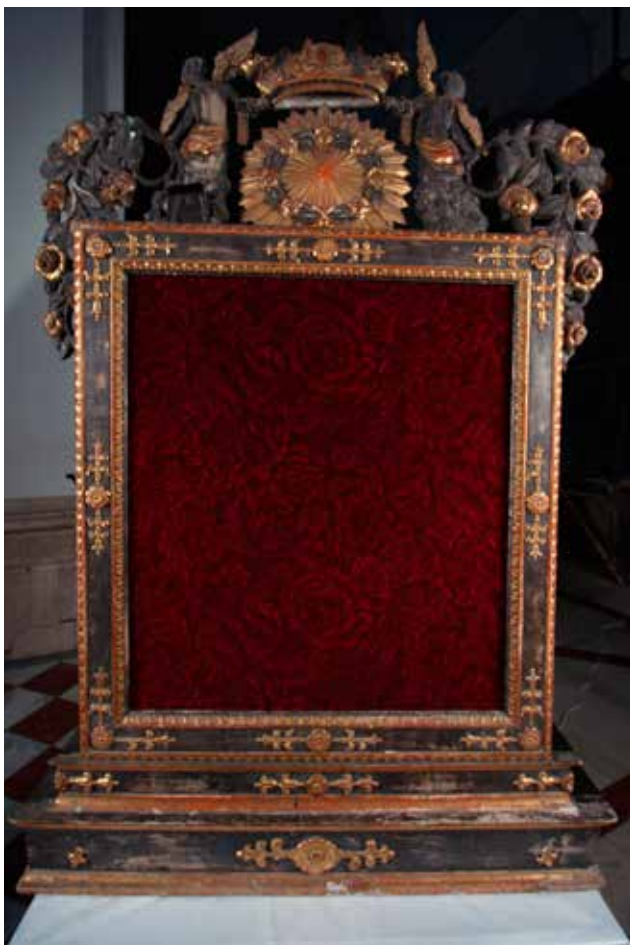
17 Zatečeno stanje stražnje strane okvira (fototeka KIM, 2019.) Condition of the back side of the frame before restoration (KIM photo library, 2019)

dijelovi koji su rekonstruirani, na takav način da su one teksturom i sjajem malo drugačije. Rekonstrukcije nedostajućih dijelova spajane su s originalom upotrebom dvokomponentnog epoksi ljepila prilikom čega su karbonska vlakna umetana u spojeve rekonstrukcije i originala kako bi se dodatno armirao spoj. Pozlaćeni dijelovi metalnog dijela okvira čišćeni su blažim otapalima kojima se vlažio tampon i lagano nanosio na pozlatu kako bi se sačuvala pozlata. Kada su svi dijelovi na metalnoj strani okvira bili očišćeni, rekonstruirani, spojeni i podlijepljeni, metal je u cijelosti zaštićen voskom.