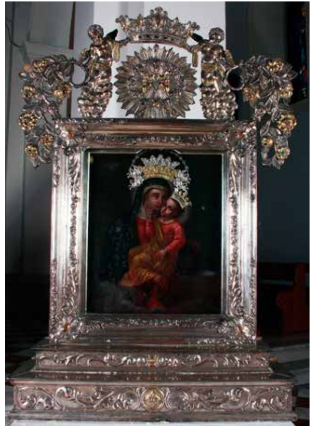
12 Zatečeno stanje prednje strane okvira Condition of the front side of the frame before restoration

sv. Paškala Bajlonskog. 42 No, kako se nešto kasnije odlučilo napraviti mramorne oltare, ovi drveni su prodani: Gospin oltar crkvi sv. Roka u Vinjanima Donjim, i to je današnji glavni oltar sv. Roka, oltar sv. Antuna Padovanskog crkvi sv. Mihovila u Prološcu, i to je današnji bočni Gospin oltar, te oltar sv. Paškala Bajlonskog crkvi sv. Franje Asiškog u Posuškom Gradcu. 43 Oltar sv. Paškala Bajlonskog više ne postoji. Vjerojatno je uništen nakon liturgijskih promjena koje su uslijedile poslije Drugoga vatikanskog koncila. Nakon prodaje ovih oltara za crkvu je početkom 20. stoljeća izrađeno pet mramornih oltara od kojih su četiri djelo klesarske radionice Pavla Bilinića iz Splita (glavni oltar Presvetog Sakramenta, oltar sv. Franje Asiškog, oltar sv. Paškala Bajlonskog i Gospin oltar), a jedan (oltar sv. Ante) rad je Vicka Tagliaferra i Gaetana Voltolinija, također iz Splita. 44 U sjevernom brodu crkve, prema apsidi, nalazi se Gospin oltar. O nacrtu i narudžbi oltara nema podataka. Najvećim dijelom financirao ga je fra Alfonso Nikola Ivanović, dok su ostali troškovi podmireni prodajom starog drvenoga Gospinog