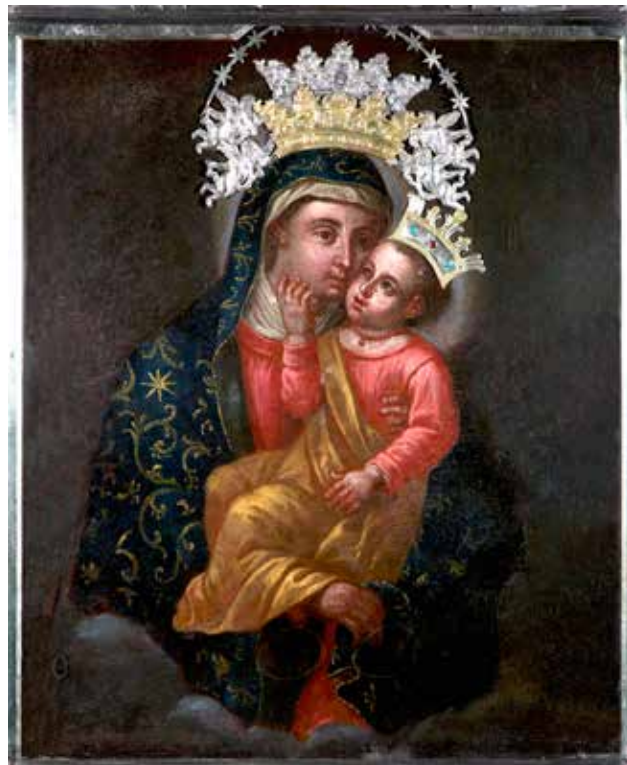
5 Slika Gospe od Zdravlja iz imotske crkve sv. Franje Asiškog

Painting of Our Lady of Health from the church of St Francis of Assisi in Imotski