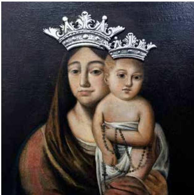
4 Slika Gospe od Ružarija iz Vrlike ( httpswww.facebook.comzupavrlika.gosparuzaricaphotosa.9932107074093192450370431693332typeer ) Painting of Our Lady of the Rosary from Vrlika ( httpswww.facebook.comzupavrlika.gosparuzaricaphotosa.9932107074093192450370431693332typeer )