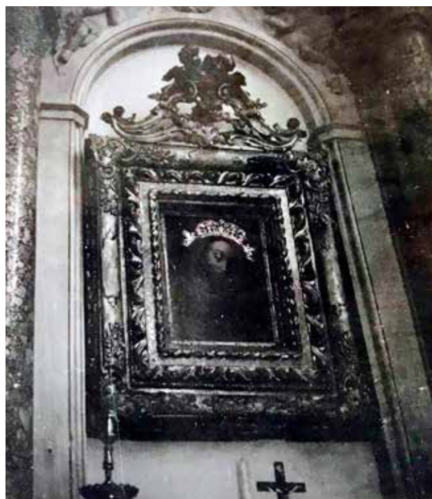
3 Kninska slika Gospe Žalosne ili Milosne (fototeka KST, 1975.)

Painting of Our Lady of Sorrows or of Mercy in Knin (KST photo library, 1975)