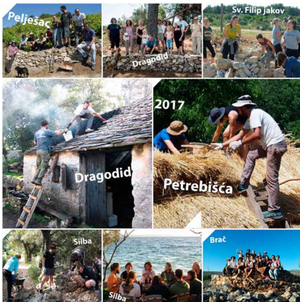
5 Kolaž fotografija mjesta u kojima su tijekom 2017. godine održane brojne radionice s volonterima

Photo collage of locations where a number of workshops with volunteers were held during 2017