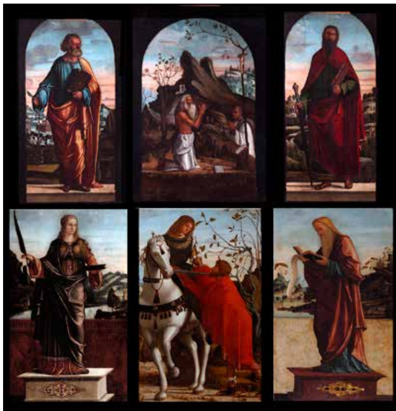
4 Restaurirani poliptih sv. Martina koji je za zadarsku katedralu sv. Stošije naslikao Vittore Carpaccio