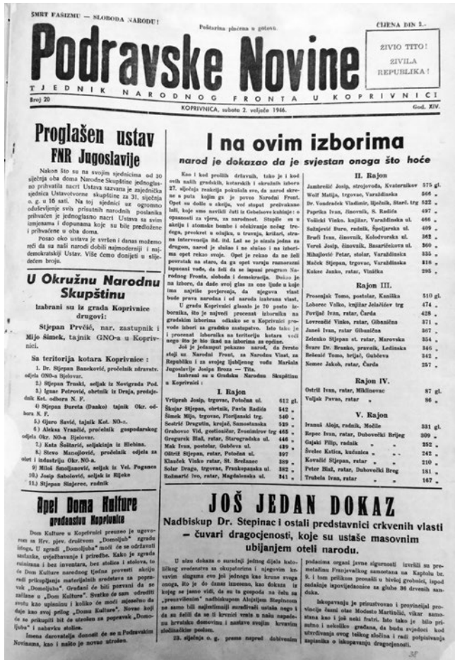
SI. 4. Naslovnica »Podravske novine« od 2. 2. 1946.

nje Radničkog doma na Jelačićevom trgu 28 u Koprivnici, upise u koprivničku Realnu gimnaziju, pokretanje rasprave o premalom broju željezničkih linija prema hrvatskoj metropoli, kao i formiranje gradske i kotarske Komisije za utvrđivanje zločina okupatora i njihovih pomagača. Od nepolitičkih tema treba izdvojiti najavu utakmice mršavih i debelih, informacije o rođenima i umrlima (objavljivane su u svakom broju), obavijesti o potrebi podnošenja prijava za proizvodnju duhana, obveznoj prijavi vlasništva nad nekretninama i radio aparatima, ali i zabrani prošnje »ubogara« na gradskim ulicama.