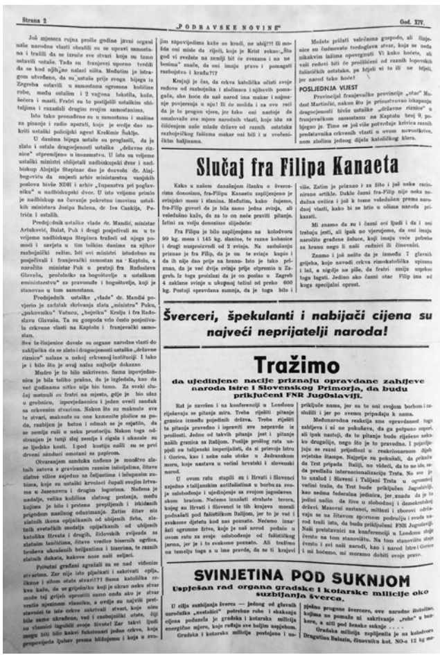
Sl. 3. Druga stranica »Podravske novine«, 23. 12. 1945.

U tom je prvom broju otvorena i bolna tema koja će možda i u najvećoj mjeri obilježiti izlaženje Podravske novine . Riječ je bila o »otkupu viškova žita«, kasnije i drugih živežnih namirnica, kao nužnosti za »spašavanje gladnog naroda u opljačkanim odnosno pasivnim krajevima«, uz upozorenje da trebaju biti strogo kažnjeni svi »špekulanti« i »saboteri« koji se tome protive. Od ostalih tema, također indikativnih za svrhu pokretanja lista, svakako treba naglasiti najavu kongresa Srba u Zagrebu, otvara-