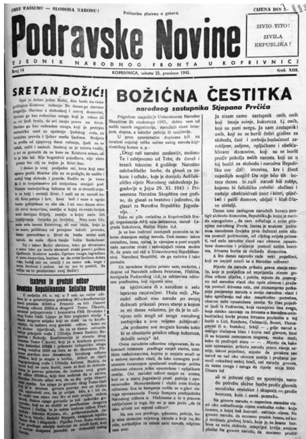
SI. 2. Naslovnica »Podravske novine« od 23. 12. 1945.