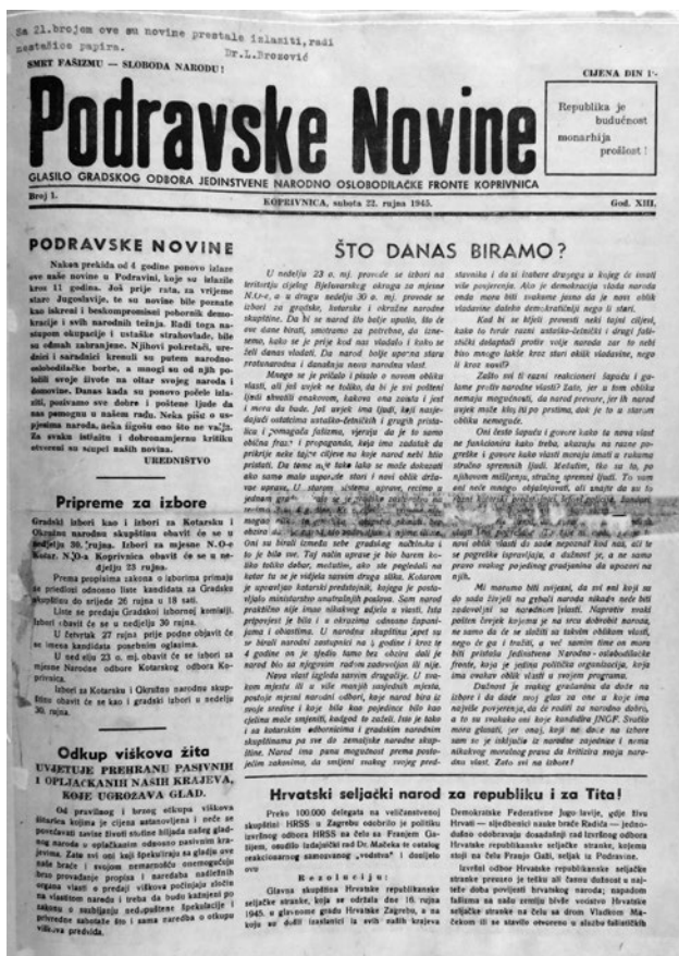
Sl. 1. Naslovnica »Podravske novine« od 22. 9. 1945.