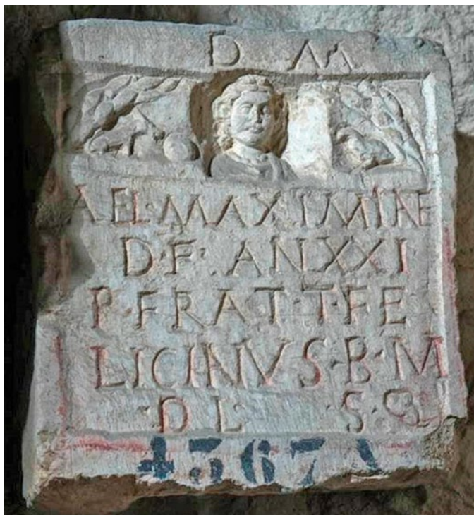
4. Stela s prikazom pokojnice, ptice i psa s loptom, Arheološki muzej Split

Stella depicting the deceased woman with a bird and a dog with a ball, Archaeological Museum in Split