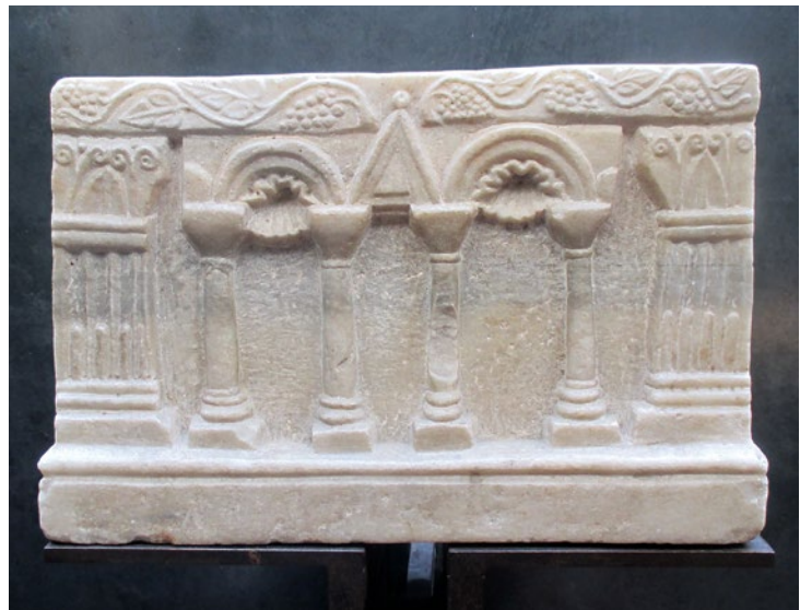
3a, b. Relikvijar u Muzeju Castelvecchio u Veroni

Reliquary at the Castelvecchio Museum in Verona