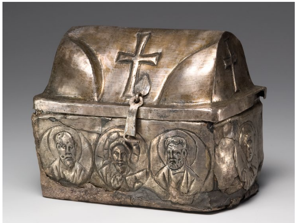
17. Relikvijar iz Hersonesa, Muzej Ermitaž u Sankt-Peterburgu

nje za dragocjenosti – nisu međusobno isključiva, jer kameni relikvijar na neki način utjelovljuje i jednu i drugu ideju. Svetačke relikvije, naime, nisu samo posmrtni ostaci svete osobe s posebnim moćima, već i najveća moguća materijalna vrijednost. 51 U tom je smislu zanimljivo prisjetiti se čuvene srebrne škrinjice iz Çirge, datirane između kasnog 4. i kasnog 5. stoljeća, koja se čuva u Arheološkom muzeju u Adani u Turskoj (sl. 16a, b). I ovaj je maleni relikvijar zaključen visokim polukružnim poklopcem, pa je zbog njegova oblika škrinjice i iznimno bogate figuralne dekoracije nedavno iznesena pretpostavka da je tek naknadno upotrijebljen za pohranu relikvija. 52 Ipak, važno je uočiti da su u bočne stranice poklopca decentno upisane forme zabata, što bez sumnje priziva izgled i ideju sarkofaga (sl. 16b). 53 Stoga nema razloga sumnjati da je formom i dekoracijom ovog predmeta upravo namjerno sugerirano