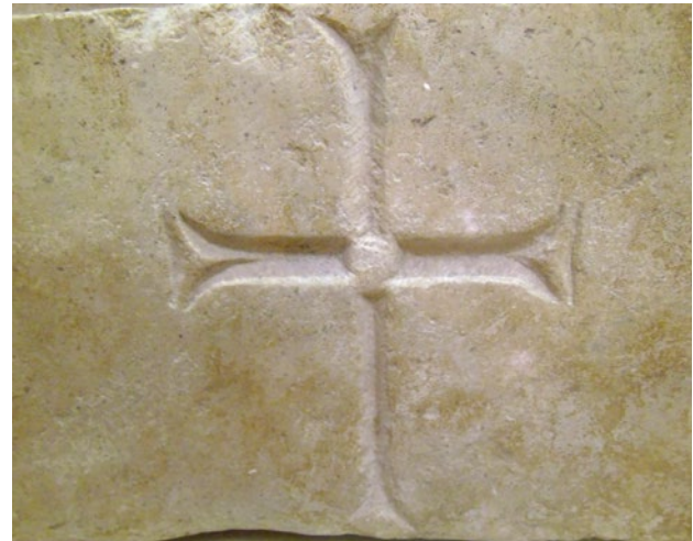
21a, b. Relikvijar iz Lovrečine na Braču, Arheološki muzej u Splitu

Reliquary from Lovrečina on the island of Brač, Archaeological Museum in Split