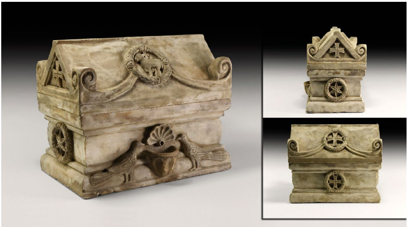
7a, b, c. Relikvijar Justinijanova doba Reliquary from Justinian's era

menu zaštitu, te konačno povezivanje relikvija direktno s mjestom Euharistije čime se stvara teološka i liturgijska osnova kulta relikvija koja otklanja dojam idolopoklonstva. 29 Praksa u istočnom kršćanskom svijetu (osobito u Siriji i Svetoj Zemlji) razlikovala se od one na Zapadu, tako da je pristup relikvijarima i kontakt s relikvijama bio moguć, posljedično i neposrednije djelovanje svetačke moći ( virtus ). 30 Relikvijari-sarkofazi mogli su imati otvore kroz koje se ulijevalo ulje ili voda kako bi se proizvele kontaktne relikvije, a s obzirom na to da su ostajali vidljivi, takvi su relikvijari imali i veće dimenzije. 31 Osim prije spominjanog relikvijara iz Richmonda, na