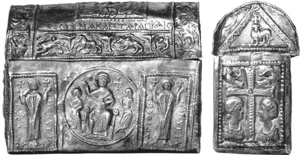
16a, b. Relikvijar iz Çirge, Arheološki muzej u Adani (preuzeto iz: ANJA KALINOWSKI /bilj. 1/, sl. 127a/b)

Reliquary from Çirga, Archaeological Museum in Adana