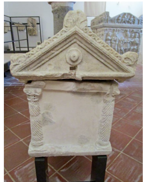
5a, b. Relikvijar u Dijecezanskom muzeju u Anconi

Reliquary at the Diocesan Museum in Ancona