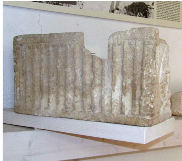
1a, b. Relikvijar iz crkve Sv. Ivana Evandjelista u Rabu, Gradski lapidarij u Rabu

Reliquary from the church of St John the Evangelist in Rab, Municipal Lapidarium, Rab