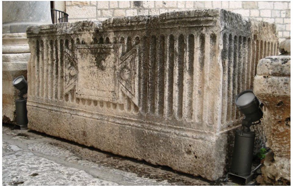
6. Sarkofag u peripteru splitske katedrale Sarcophagus in the peripteros of the Split cathedral

menu zaštitu, te konačno povezivanje relikvija direktno s mjestom Euharistije čime se stvara teološka i liturgijska osnova kulta relikvija koja otklanja dojam idolopoklonstva. 29 Praksa u istočnom kršćanskom svijetu (osobito u Siriji i Svetoj Zemlji) razlikovala se od one na Zapadu, tako da je pristup relikvijarima i kontakt s relikvijama bio moguć, posljedično i neposrednije djelovanje svetačke moći ( virtus ). 30 Relikvijari-sarkofazi mogli su imati otvore kroz koje se ulijevalo ulje ili voda kako bi se proizvele kontaktne relikvije, a s obzirom na to da su ostajali vidljivi, takvi su relikvijari imali i veće dimenzije. 31 Osim prije spominjanog relikvijara iz Richmonda, na