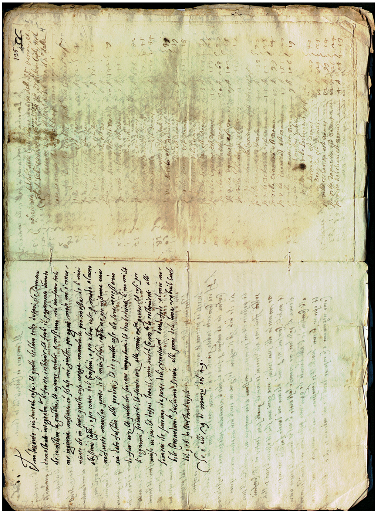
Prilog 1. Popis župa i naselja Šibenske biskupije u rukopisu Šibenski zbornik turskih, mletačkih i hrvatskih listina iz XV – XVII. v., Arhiv Hrvatske akademije znanosti i umjetnosti, Zbirka rukopisa, sign. II d 106., str. 4r (136r) – 5r (137r) (preslika se objavljuje temeljem odobrenja HAZU br. 10-22/33-1-2020, Zagreb, 14. listopada 2020.)

Annex 1. List of parishes and villages of the Šibenik diocese in the manuscript Šibenik anthology of Turkish, Venetian and Croatian documents from the XV - XVII cent., Archives of the Croatian Academy of Sciences and Arts, Manuscript Collection / sign. II d 106., p. 4r (136r) - 5r (137r) (the copy is published on the basis of the approval of the HAZU no. 10-22 / 33-1-2020, Zagreb, 14 October 2020)