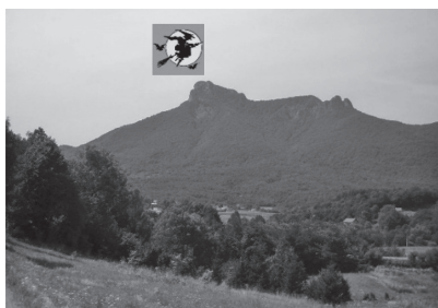
Slika 11. Klek

Gledan s istoka i juga doimlje se kao usnuli div kojemu su stijene Klečice noge, a vršna stijena glava. Prema narodnoj predaji, vrh Klek sijelo je vještica koje su svojevrsan simbol Kleka i Ogulina. Porijeklo imena Klek vjerojatno je slavensko, potječe od imena stabla, klekovine, vrste bora koji raste na velikim visinama.