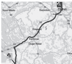
Slika 10. Autocesta Zagreb – Ogulin

I danas je Ogulin dobro povezan s unutrašnjošću Hrvatske, Karlovcem i Zagrebom, te s Primorjem odnosno Rijekom.