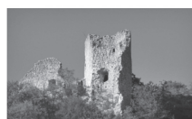
Slika 5. Grižane