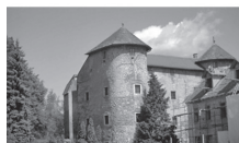
Slika 6. Ogulin