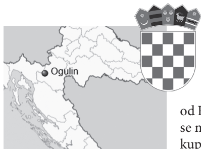
Slika 1. Položaj Ogulina na karti Hrvatske