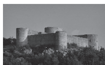
Slika 4. Drivenik