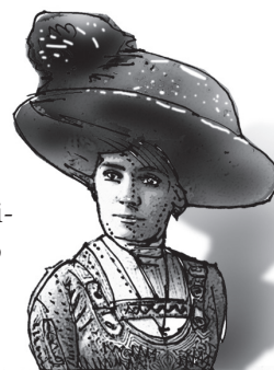
Slika 12. Ivana Brlić Mažuranić

Likovi iz bajki koje je pisala potječu iz pretkršćanske, slavenske mitologije. Jedinstvene su bajke iz ciklusa Priče iz davnine – Šuma Striborova, Regoč, Ribar Palunko i njegova žena, Sunce djever i Neva Nevičica, Lutonjica Toporko i devet župančića, Kako je Potjeh tražio istinu, Bratac Jaglenac i sестrica Rutvica te Jagor.