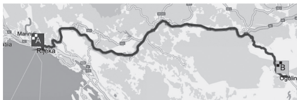
Slika 9. Autocesta Rijeka – Ogulin

Duljina autoceste od Zagreba do Ogulina iznosi 106 km. Cestarina je 41 kn.