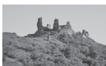
Slika 3. Modruš