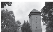
Slika 7. Dubovac