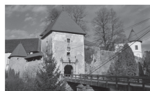
Slika 8. Ozalj

nardin Frankopan bio je jedan od najmoćnijih velikaša svoga vremena, a izgradio je mnoge utvrde u središnjoj i primorskoj Hrvatskoj.