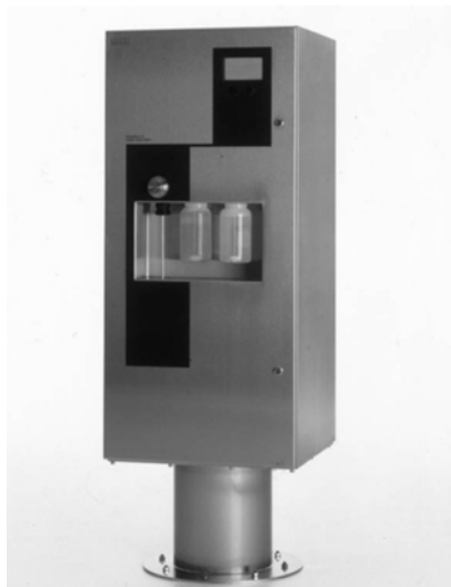
Slika 3: In-line FTIR spektroskop (ProcesScan™ FT) (FOSS, 2007.)