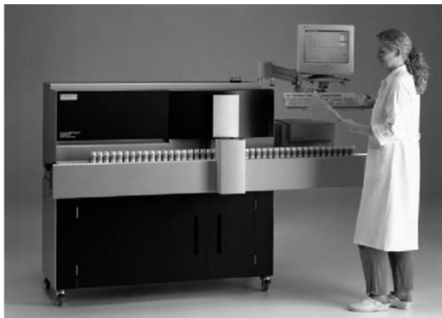
Slika 4: FOSS Bactoscan™ FC (Mills, 2006.)

Ova metoda se može koristiti za utvrđivanje razlika između sirovog, toplinski obrađenog i homogeniziranog mlijeka (Dufour i Riaublanc, 1997.), a istražena je i primjena za praćenje Maillardovih reakcija posmeđivanja mlijeka tijekom toplinske obrade (Schamberger i Labuza, 2006.). Fluorescentna spektroskopija se primjenjuje i u praćenju procesa koagulacije mlijeka u proizvodnji sira uz glukono- \delta -laktan, sirilo i kombinaciju glukono- \delta -laktana i sirila (Karoui i sur., 2007.).