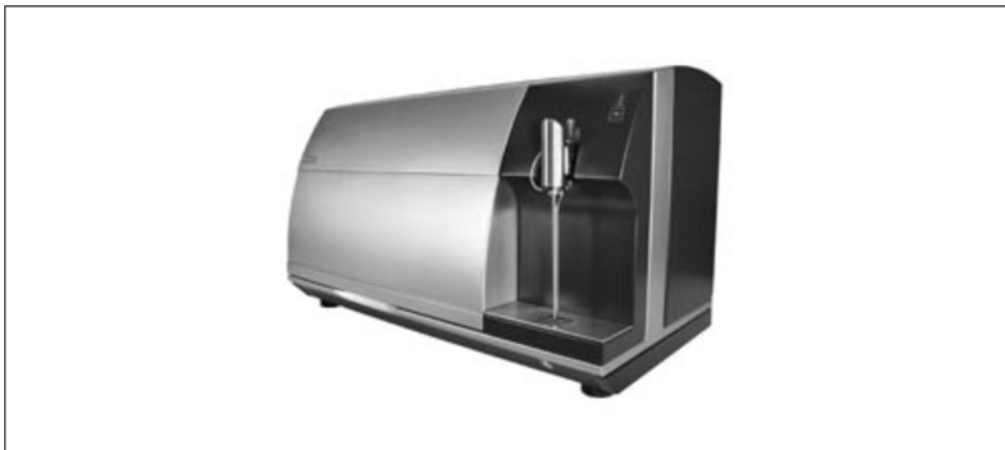
Slika 2: FTIR analizator mlijeka i mliječnih proizvoda (MilkoScan TM FT 120) (FOSS, 2007.)