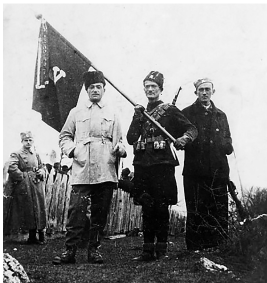
Slika 1. Generalštabni major VJ Slavko Bjelajac (u sredini sa zastavom)

Figure 1. Headquarters Major of the Yugoslav Army Slavko Bjelajac (in the middle with a flag)