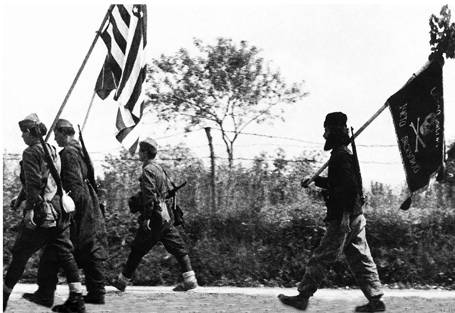
Slika 16. Predaja četnika zapadnim saveznicima (između Gorice i Palmanove)