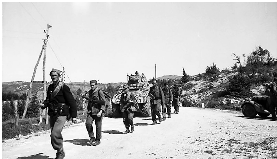
Slika 7. Četničke i njemačke postrojbe na području Klane u srpnju ili kolovozu 1944. godine

Figure 7. Chetnic and German military formations in the area of Klana during the July or August 1944.