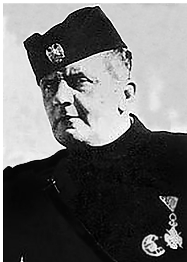
Slika 5. Četnički vojvoda Dobrosav Jevđević