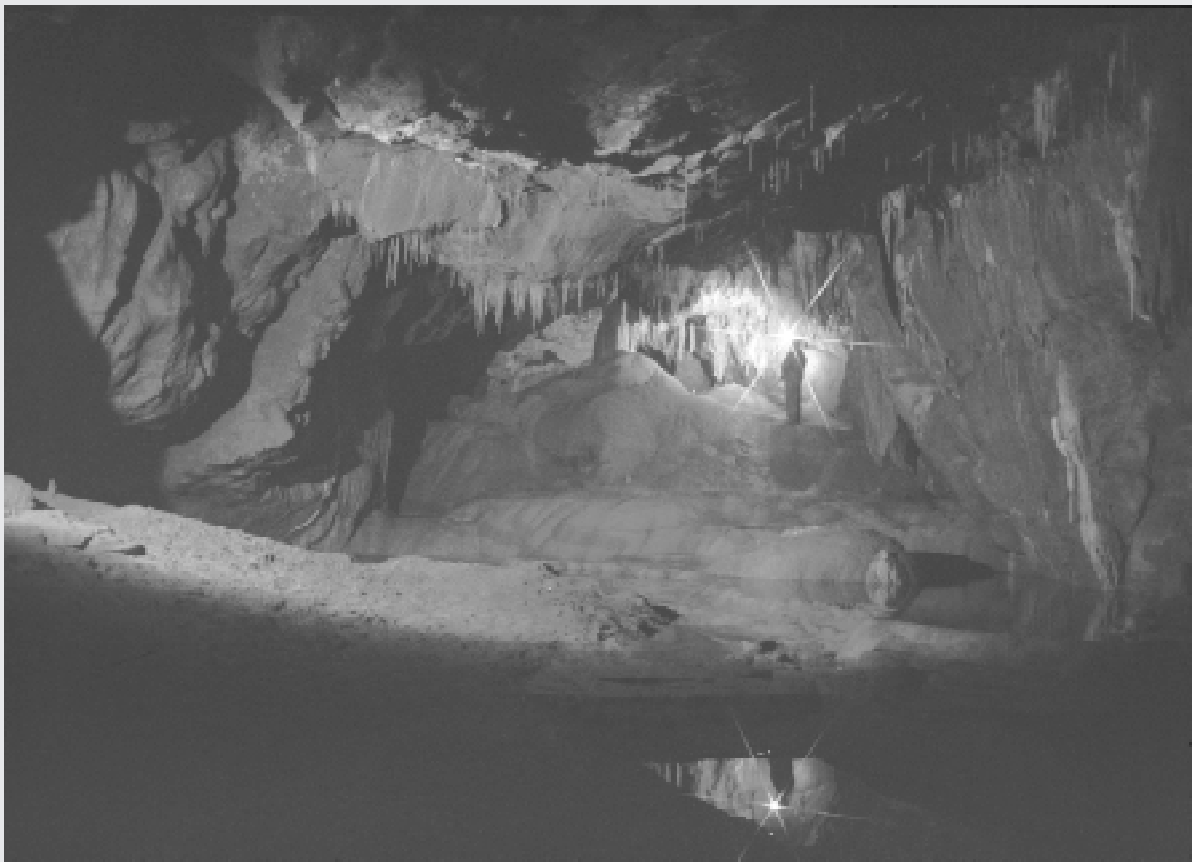
Špilja u kamenolomu Tounj