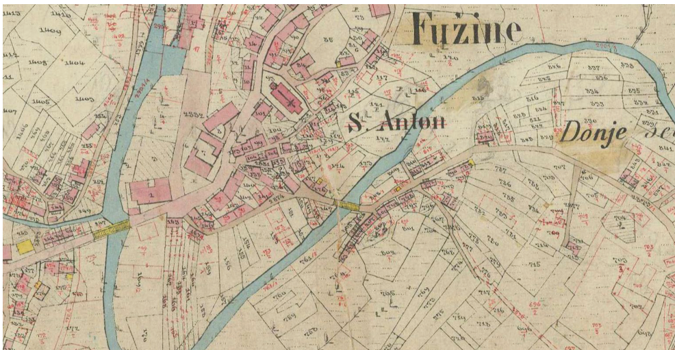
Slika 1. Prikaz današnje crkve sv. Antuna Padovanskog na katastarskoj izmjeri 1862. godine

Što se tiče smještaja u odnosu na dijelove naselja, analiza povijesnih zemljovida i povijesnog katastra, uz pregled postojećeg stanja, dovodi do zaključka da je prvotno naselje zbijenoga tipa bilo smješteno na padinama brijega, uokolo kojega je meandrirao potok Ličanka. S obzirom na okolnosti izgradnje nove fužinske župne crkve u prvoj polovini 19. stoljeća, za analizu prostornog razvoja Fužina nisu nam bile od koristi inače dragocjene austrijske vojne izmjere iz druge polovine 18. i prve polovine 19. stoljeća. Poznato je da je grafički izvrsna austrijska katastarska izmjera u ovim krajevima koji su već imali josefinski katastar provedena relativno kasno. To se dogodilo stoga što je Austriji zbog razreza poreza u prvoj polovini 19. stoljeća bilo primarno novim tehnikama snimanja i kartiranja obuhvatiti ona područja unutar svojih novih granica koja su nekad pripadala Mletačkoj Republici. Katastarska izmjera Fužina iz 1862. godine u zoni uokolo nove župne crkve, a i što se tiče same crkve, praktično je dokumentirala i danas postojeće stanje (slika 1). Ranije vojne izmjere izvanredno su važne za urbanističku analizu naselja, ali posve nepouzdanе za slučaj oblikovanja i smještaja na razini topografskog znaka shematski ucrtane prvotne crkve. 15