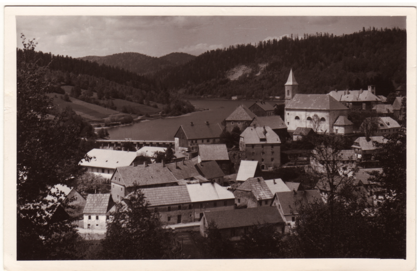
Slika 10. Klasicistička crkva sv. Antuna Padovanskog kao dominantna u kulturnom krajoliku naselja razvijenoga na Karolinskoj cesti, fotografija iz polovine 20. stoljeća

kojima su se mala naselja često znala naći pri pokretanju arhitektonskih zahvata čija je cijena premašivala njihove financijske mogućnosti (slika 10). Spomenuti arhivski podatci dobar su komparativni primjer i za poznavanje prilika oko uređenja, opremanja, održavanja i popravka crkvenih zdanja u Gorskom kotaru, osobito u vremenu druge polovine 19. i prvim desetljećima 20. stoljeća. Ovdje arhivski potvrđeni majstori poput altarista i zidnog slikara i šire su poznati po svojim realizacijama, osobito onima s riječkoga i vinodolskoga područja.