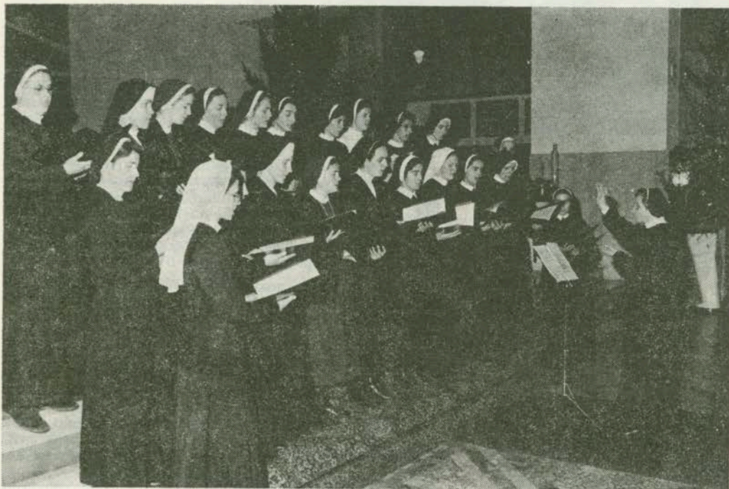
Zenski zbor Instituta za crkvenu glazbu KBF na koncertu crkvenih zborova grada Zagreba