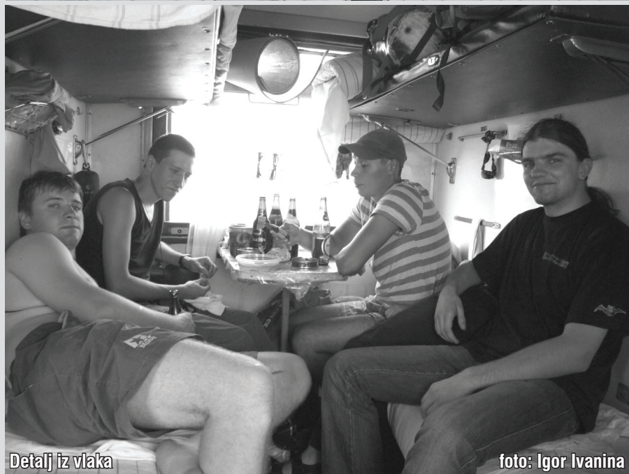
Detalj iz vlaka