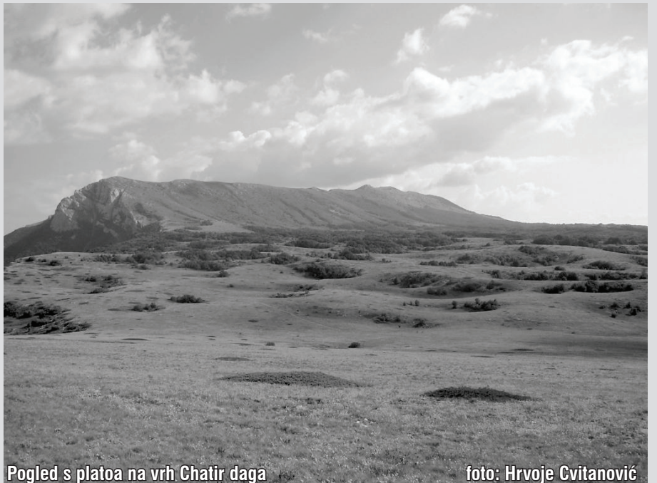
Pogled s platoa na vrh Chatir daga