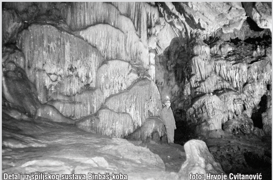
Detalj iz špiljskog sustava Binbaš-koba