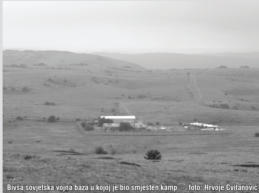
Bivša sovjetska vojna baza u kojoj je bio smješten kamp