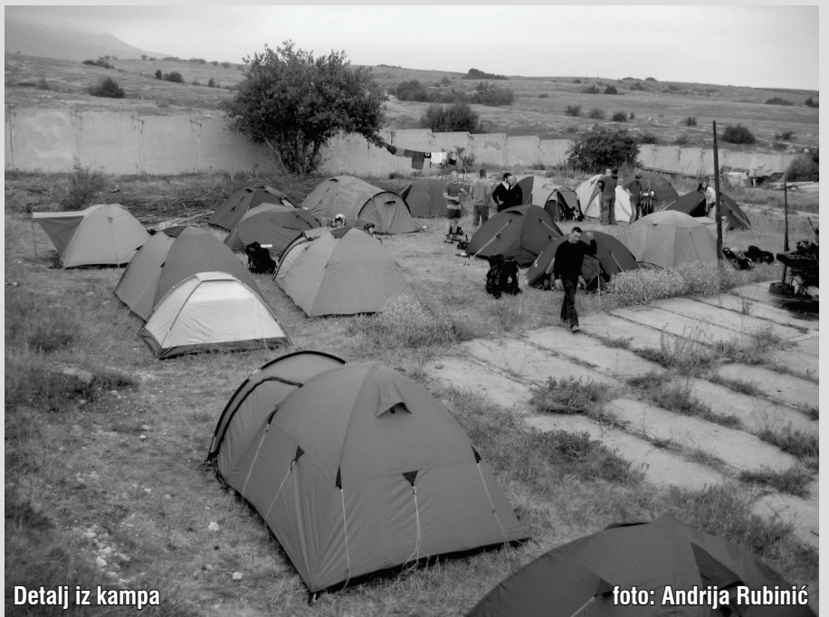
Detalj iz kampa

A što sada? Tri šaltera kroz koje vjerojatno valja proći i stroge tete u uniformama. Pošto su neki od nas imali već nekog iskustva kod prelaska ukrajinske granice podučili su ostale kako ispuniti minijaturne obrasce pisane naravno na ukrajinskom jeziku. Uz nedovoljno olovaka pokušavamo što prije odraditi taj nimalo lak zadatak i što prije proći kroz šaltere jer u glavi je pitanje hoće li nas vlak čekati? Strogo pitanje tete u uniformi, nešto stila "svrha putovanja" i začuđeni pogled uperen u našu šarenu družbu i prtljagu. Odgovor- "Speleološka ekspedicija" -namamila je na tom ozbiljnom licu lagani smiješak i prvi znakovi simpatije su bili tu. Prelazak je olakšan. Novi šok je uslijedio ulaskom u prostranu čekaonicu sa šalterima za kupnju karata i nešto kao kafićem. Kao da se vraćaš daleko u prošlost. Socijalističko-komunistički glomazni crteži koji su nekada bili simboli Sovjetskog Saveza svuda po zidovima. Hladnoća i jednostavnost interijera te drečavi zvuk mikrofona kojim službenica komunicira s putnicima. Opet poteškoće kod sporazumijevanja koje nam je olakšao igrom slučaja čovjek sa znanjem njemačkog. Nema karata... Kako nema karata?... Što sada?... Pitanja, pitanja... Panika! Dijelimo se u dvije ekipe. Gorana, Danko i Antonio putuju direktno za Ternopil, a ostatak ekipe prvo do L'vova pa hvata vezu za Ternopil.