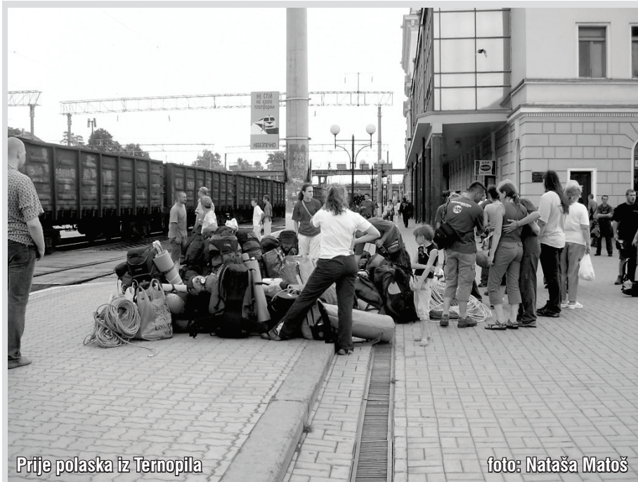
Prije polaska iz Ternopila

U 18:22 sati ostavljamo Budimpeštu iza nas. Vlak je krcat tako da se naša mala družba razdijelila po vagonu. Noć se lagano spustila, kotrljamo se Mađarskom i čudnovato, unatoč doslovce cijelom danu provedenom zajedno još uvijek si imamo što za reći. Igrom slučaja ili bolje reći tuđe