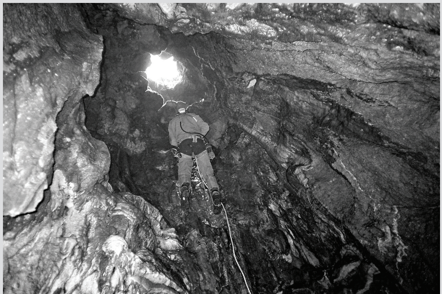
Detalj iz Obijeve jame

Jedan dan je bio rezerviran za obilazak dviju turističkih špilja koje su se nalazile u našoj neposrednoj blizini. Dobrom reklamom na moru, koje je u blizini, posjećuju ih mnogi turisti što organiziranim što vlastitim prijevozom, tako da se na ispred špilja nerijetko nalazi i petnaestak autobusa. Prva špilja je Zmine-Bair-Hosar gdje je turistički uređeno oko 1500 m staza. Ova špilja je značajna po paleontološkim nalazima mamuta, bizona, jelena i antilope koji su najvjerojatnije upali kroz jamski otvor. Rekonstruirani su i izloženi 2 m od staze. Druga špilja je Mramornaja s dužinom staza od 2050 m i lijepim speleotemima. U sklopu tih dviju špilja nalazi se speleobar koji smo nakon ovih posjeta više puta obišli.