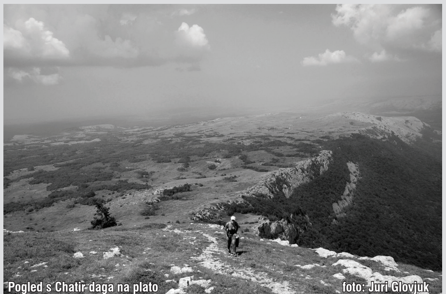
Pogled s Chatir-daga na plato