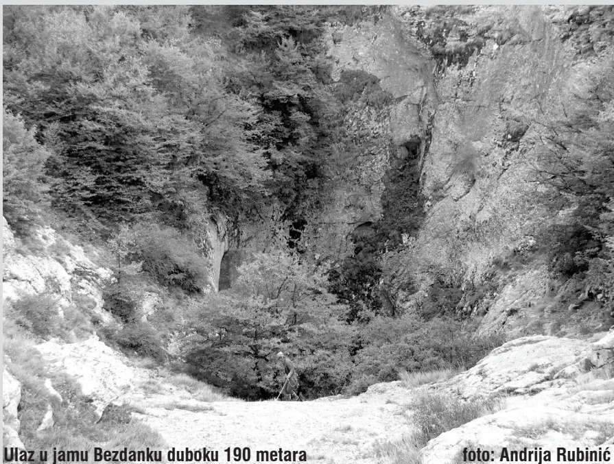
Ulaz u jamu Bezdanku duboku 190 metara

Cesta do logora je dosta strma i zavojita. Svaka čast našim vozačima na umješnosti. Tijekom vožnje motor kamiona sa stvarima se na jednoj uzbrdici malo zapalio. Nije to ništa. Dečki hladnokrvno vade aparat za gašenje požara, špric-špric, pa kratko hlađenje i idemo dalje. Očigledno da imaju iskustva sa tom pojavnosti. Iznenadenje na cilju. Logor je smješten u napuštenoj bazi za radarske sustave vojske bivšeg SSSR-a i radi se na tome da se preuredi u planinarski kamp. Posvuda ostaci bivših vlasnika. Stare prikolice kamiona za vezu, kosturi ogromnih tegljača, stambeni objekti sa vodom i tuševima i najljepši betonirani dio nadsvođen maskirnom vojnom mrežom sa stolovima i klupama