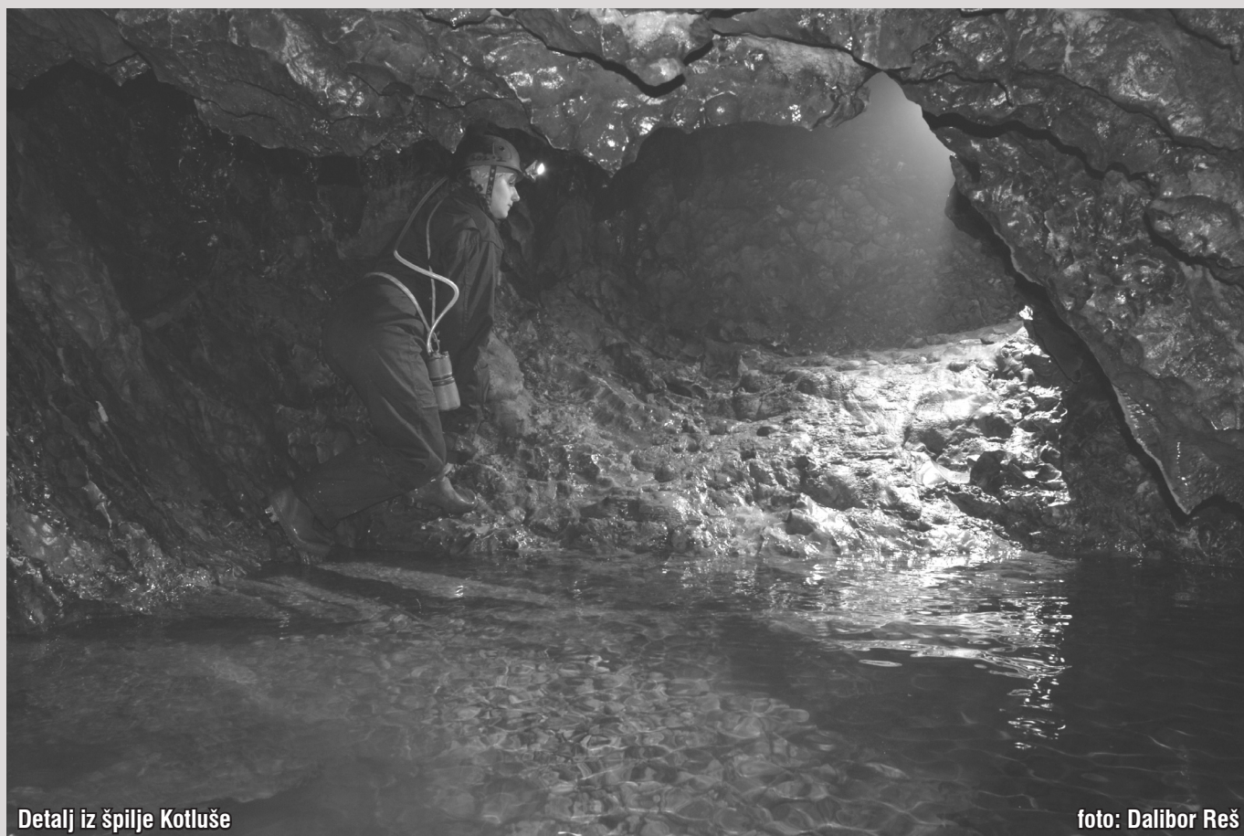
Detalj iz špilje Kotluše