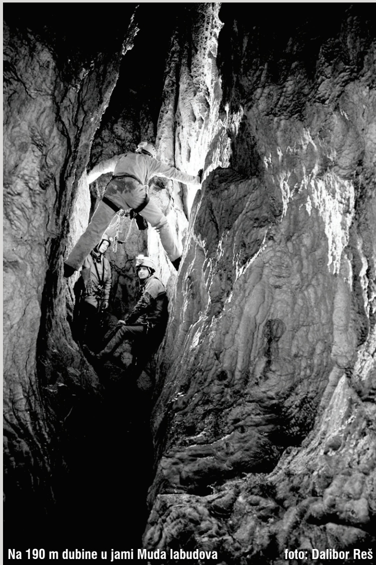
Na 190 m dubine u jami Muda labudova