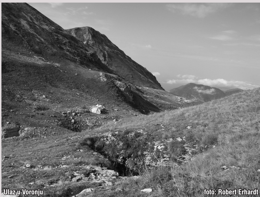
Ulaz u Voronju