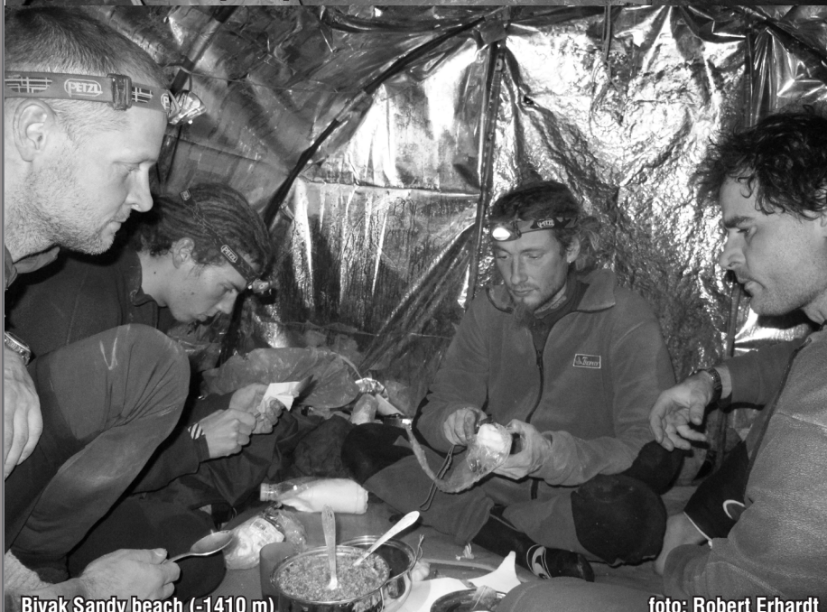
Bivak Sandy beach (-1410 m)