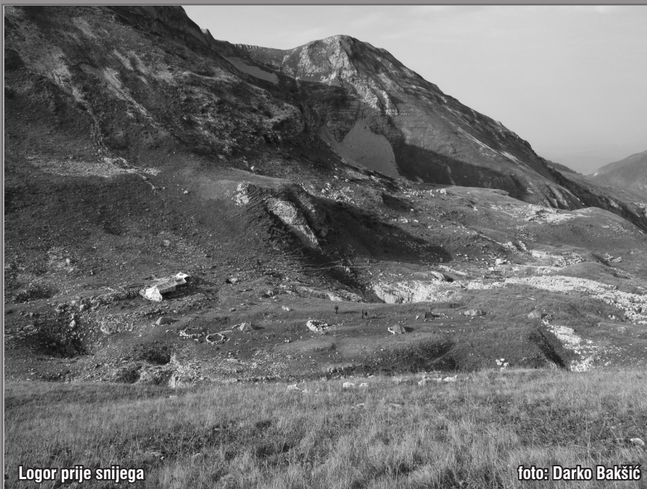
Logor prije snijega