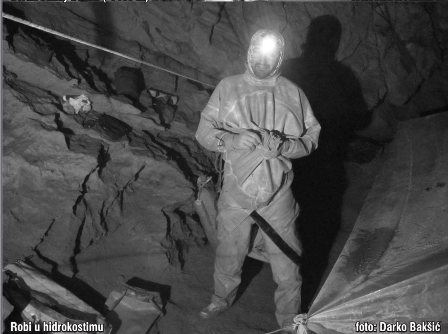
Robi u hidrokostimu