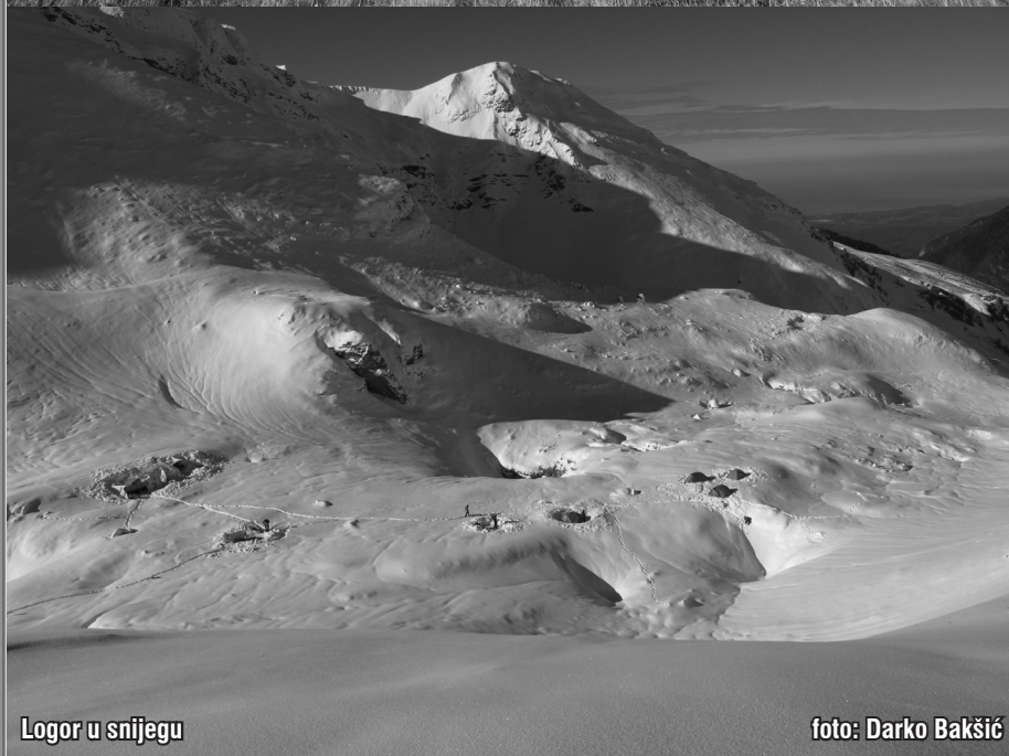
Logor u snijegu