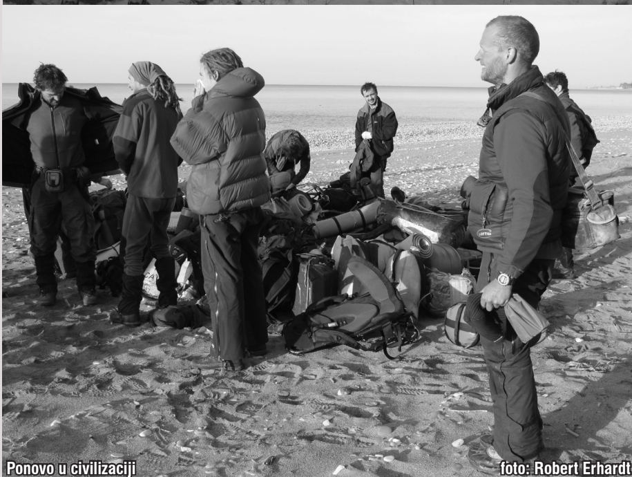
Ponovo u civilizaciji