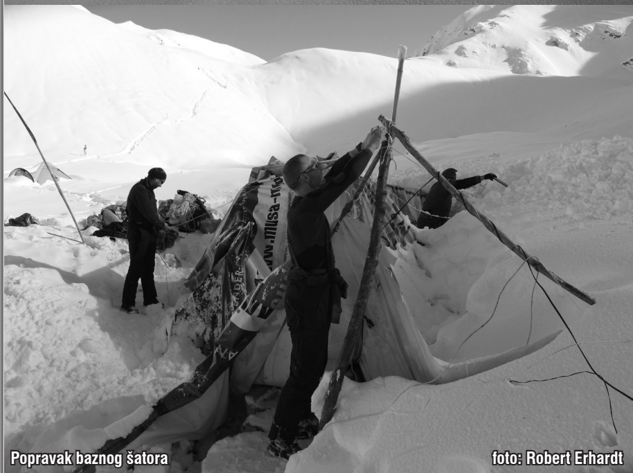
Popravak baznog šatora