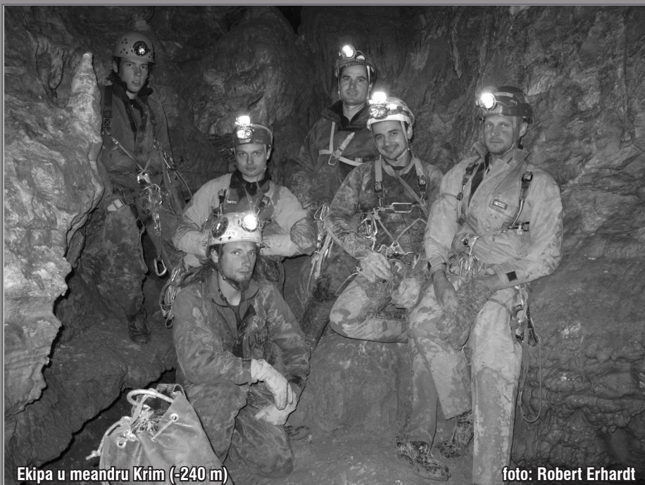
Ekipa u meandru Krim (-240 m)