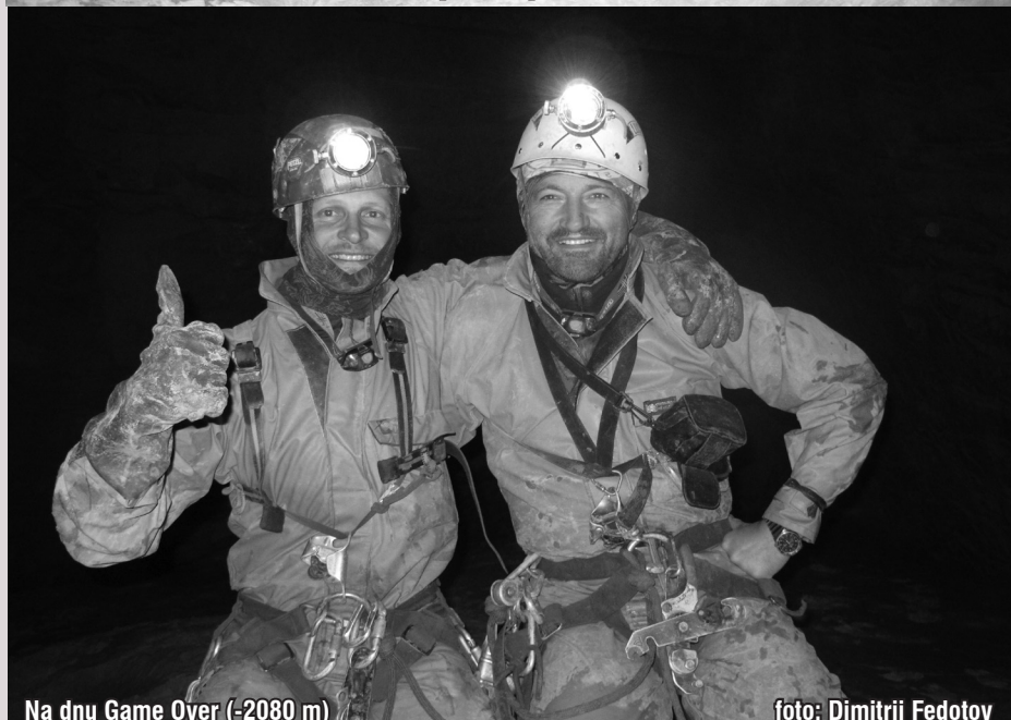
Na dnu Game Over (-2080 m)