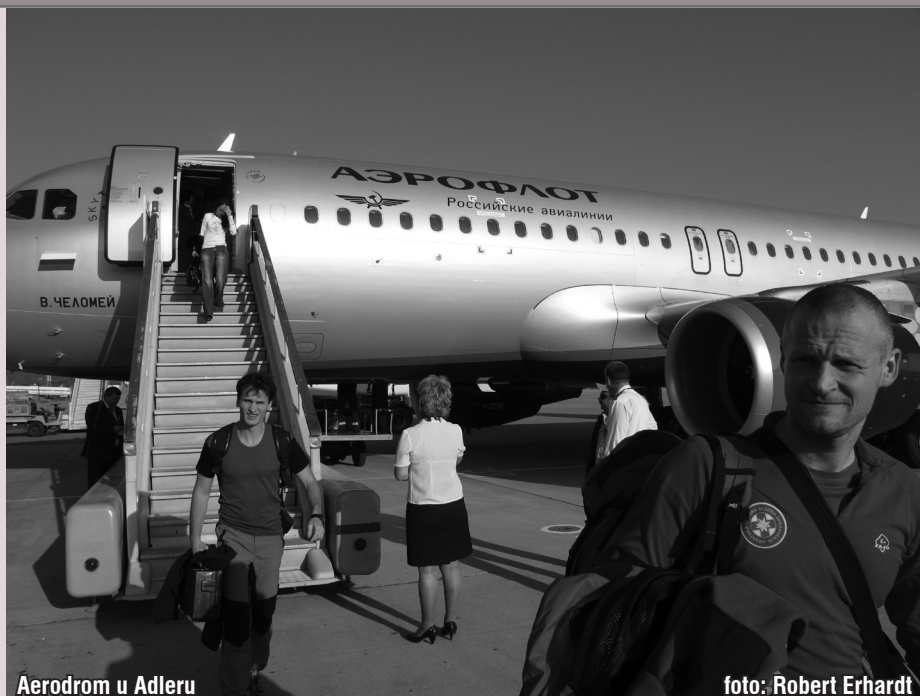
Aerodrom u Adleru

http://www.speleogenesis.info/spotlights/spotlight_areas.php?expl_area_id=4 http://en.wikipedia.org/wiki/Voronja_Cave