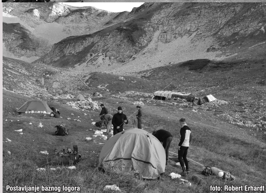
Postavljanje baznog logora