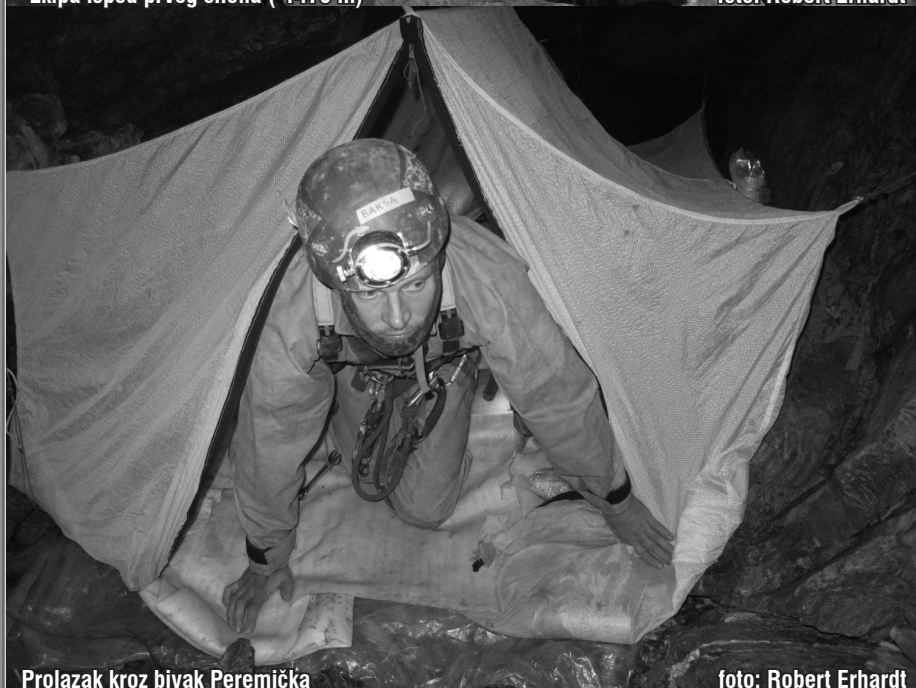
Prolazak kroz bivač Peremička