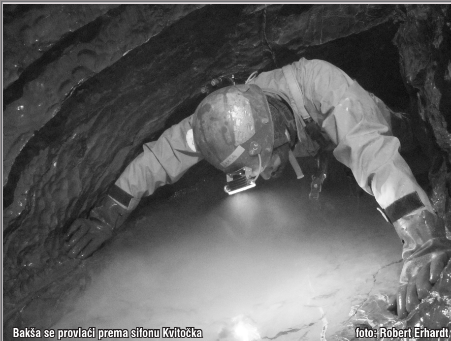
Bakša se provlači prema sifonu Kvitocka