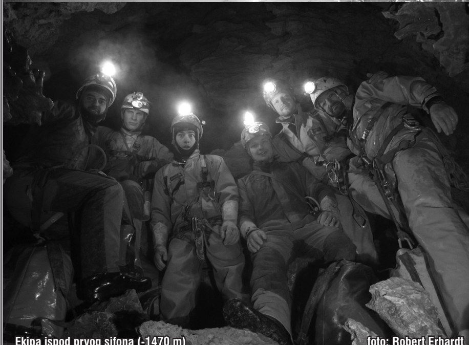
Ekipa ispod prvog sifona (-1470 m)