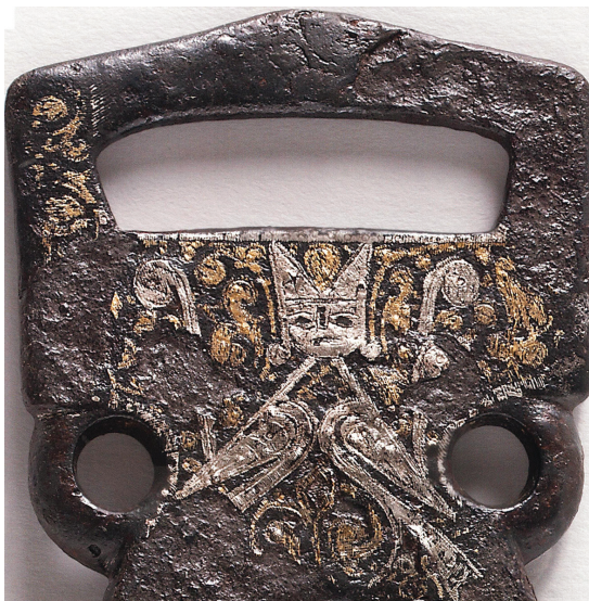
Slika 7: Stremen s likom vladara, 10. st., Katalog str. 126. i 140.

Prva cjelina uvodi u izložbu, prikazujući lokalitet i povijest njegova istraživanja (79–83). Druga je posvećena Bribirskoj glavici prije dolaska Rimljana (84–97). Tipični su izlošci obredne posude i predmeti neolitičke danilske kulture, željeznodobna liburnska i uvozna keramika te fibule iz mlađeg željeznog doba. Autohtonim se liburnskim uratkom smatra plitki reljef s opscenim prizorom (kat. br. 2.30, željezno doba, str. 94, Slika 4 ). Ulomak višebojnog privjeska od staklene paste potvrđuje veze s feničkim svijetom (kat.