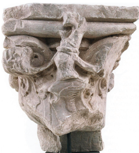
Slika 8: Glavica stupa s grbom Šubića Bribirskih, 14/15. st., Katalog str. 165.

Tumači se da oštećeni monumentalni nadgrobni natpis muškarca s doimenom Liburnus pokazuje kakvu je karijeru u rimskome sustavu mogao postići čovjek ovdašnjega podrijetla. Prema natpisu, zapovijedao je Četvrtom kohortom nepoznatog pridjevka, Trećom tračkom kohortom i Dvadeset drugom legijom, da bi napokon obnašao neku funkciju u gradu Augusta Praetoria (dan. Aosta, sjeverozapadna Italija; kat. br. 3.21, str. 108–109, 1–2. st.). Plitki reljef s likom osobe vezane uz jarbol broda, poput Odiseja na prolasku između Scile i Haribde, duboko je simboličan u sferi kulta plodnosti: brod je faličan, a uplovljava u prikladan dio nadnaravnog ženskog lika (kat. br. 3.19, str. 108, 1. st., Slika 5 ). Reklo bi se da su se na Bribirskoj glavici drevni autohtoni koncepti plodnosti u rimsko vrijeme nastavljali slaviti novom, internacionaliziranom likovnošću.