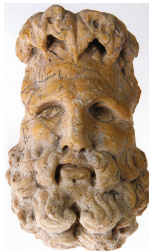
Slika 3: Glava muškog božanstva, 2–3. st., Katalog str. 100. i 102.