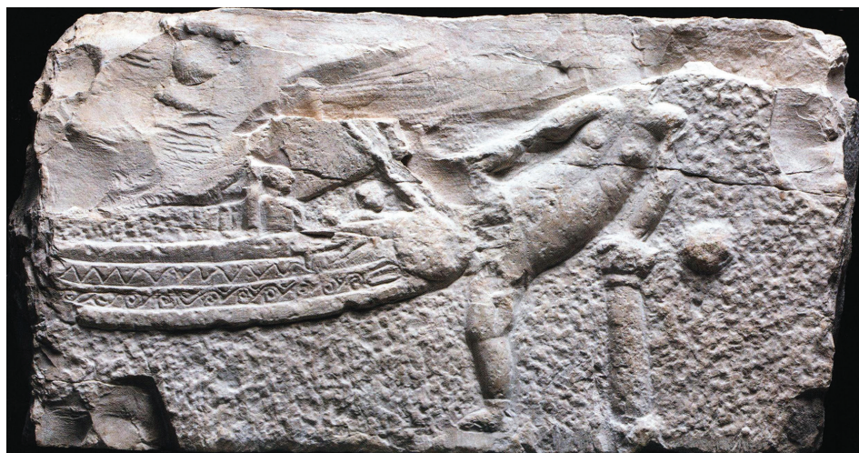
Slika 5: Reljef s faličkim brodom, 1. st., Katalog str. 108.