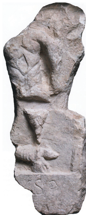
Slika 2: Silvanov reljef s posvetom, 2–3. st., Katalog str. 101.

Bribirskom glavicom završava Ostrvičko-otreski brdski lanac od kojega je blago odijeljena prijevojem Planičnik. Osigurana je prirodnim strminama, a na njoj se na približno 300 m 2 prostire zaravan od 72.000 m 2 . U podnožju Bribirske glavice izvire nepresušna pitka voda i leži plodna, obrađiva ravan. Stoga se pod Glavicom obitavalo od neolitika, a na njoj stalno barem od burnog kasnog brončanog doba. Ništa se u krajoliku nadaleko nije moglo pomaknuti a da to žitelji Glavice ne opaze – i nitko nije mogao proći preko Planičnika, nisu li to htjeli dopustiti gospodari Bribirske glavice i Ostrovice. Na Glavici se živjelo i iz nje vladalo okolnim područjem, jednako u autohtonom sustavu liburnskih gradina, u rimskom sustavu samoupravnih gradova i u hrvatskome srednjovjekovnom sustavu županijskih, a zatim feudalnih središta. Spomenička baština Glavice i njezinoga najbližeg okruženja pokazuje blagostanje i visoki standard života u svim razdobljima. Njezini su je istraživači nazivali hrvatskom Trojom (fra Lujo Marun) i hrvatskim Ilijem (Mate Suić), ne samo zbog veličanstvena izgleda i povijesnog značenja, već i zbog doslovne asocijacije na impresivni slijed kulturnih slojeva na Schliemannovom Hissarliku. „Slojevi” u naslovu izložbe obuhvaćaju i duže razdoblje. Materijal s ovog lokaliteta i s njime usko povezan može, naime, u dijakronom kontinuitetu ilustrirati i povezati sva raz-