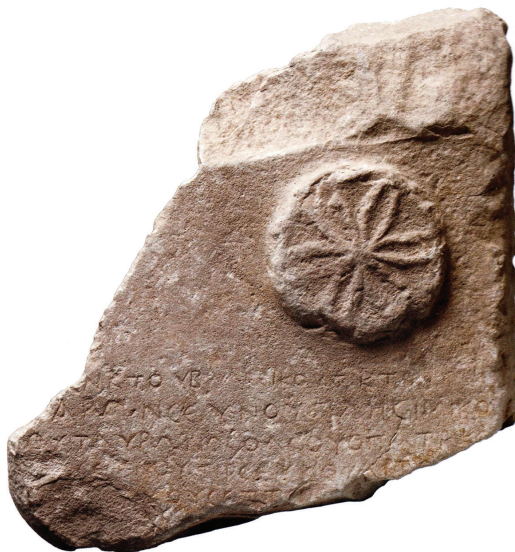
Slika 1: Grčki natpis, 2. st. pr. Kr., Katalog str. 97.

Ažurnom obaviješću na svojim stranicama ( www.hismus.hr ) Muzej je umirio sve koji znaju kakvo blago inače izlaže i čuva, a pogotovo one koji znaju kakvo je