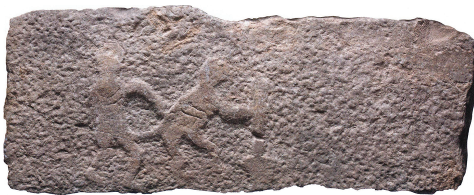
Slika 4: Reljef s opscenim prizorom, Željezno doba, Katalog str. 94

Izložbu su organizirala tri hrvatska muzeja iz tri grada, Hrvatski povijesni muzej u Zagrebu (HPM), Muzej hrvatskih arheoloških spomenika u Splitu (MHAS) i Muzej grada Šibenika (MGŠ). Samo posljednji, gradski, raspolaže gotovo dovršenim prostorom i stalnim postavom. Oba nacionalna to još očekuju. Bribirska je izložba bila prilika da oba iznesu na svjetlo dana i predmete koji inače leže u njihovim spremištima. Znatan broj izložaka dopremljen je iz nedavno uređene