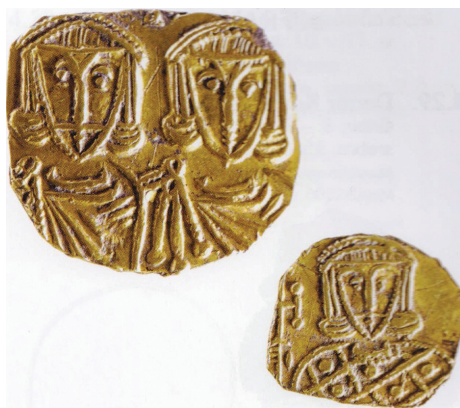
Slika 6: Solid cara Konstantina V. Kopronima, 760 - 775, Katalog str. 135.