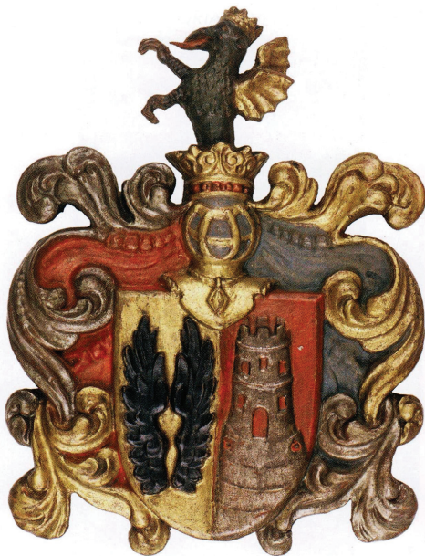
Slika 10: Grb knezova Zrinskih, 17. st., Katalog str. 204.

Kako su članovi roda obnašali kneževsku dužnost u dalmatinskim gradovima, imali posjede i vladali duboko u kopnenoj unutrašnjosti, a priznavali su krunu Hrvatskog i slijedom Ugarsko-Hrvatskog Kraljevstva, u dva se posljednja dijela izložbe mogu najbolje razumjeti uvjeti i oblici protjecanja povijesnog toka na hr-