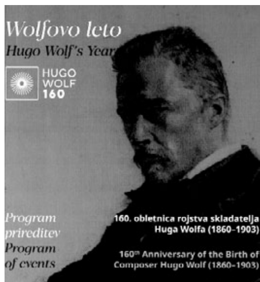
Naslovna stranica Wolfove programske knjižice, 2020.

nosno ciklusa, crkvene tematike. Njegov stvaralački i životni credo bio je kratak - njegovi život i djelo trajali su samo 43 godine.