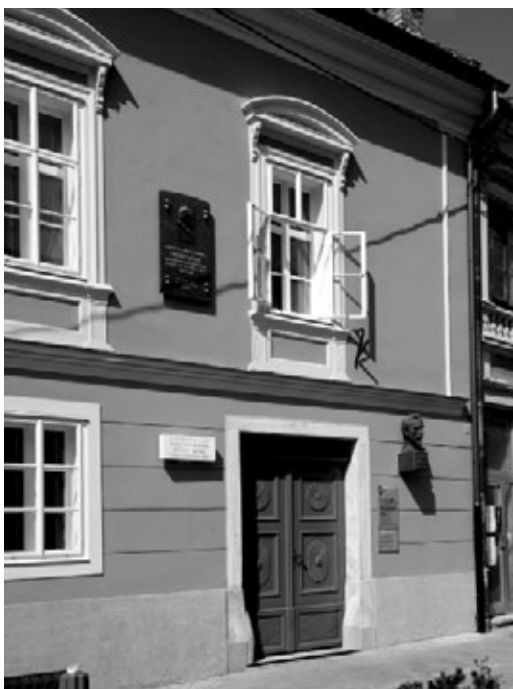
Wolfova rodna kuća u Slovenj Gradcu.

rad, Tri pjesme na liriku B. Michelangelola (1896.). Wolf je bez sumnje bio umjetnik istančanog književnog ukusa i vještine, te je riječi prelijevao u glazbu i dao im novu dimenziju. Njegove solo pjesme ponajprije i najdublje znače vezu između te dvije umjetnosti: književne i glazbene. Inspiriran podjednako poznatima F. Schubertom i R. Schumannom, Wolf je svojstvenom upotrebom novih dostignuća oblikovao vlastiti stil i zajedno s J. Brahmsom stvarao nove vrhunce njemačke vokalne lirike 19. stoljeća. U Europi je postao slavan nakon 1894. godine, naravno zahvaljujući solo pjesmi . Na vrhuncu stvaralaštva nazivali su ga »Wagnerom pjesama« odnosno liričarem pjesme. Iako ga je 22. veljače 1903. godine u Beču pobijedila bolest, u svojim djelima i danas isijava snagom. U njima je, naime, postigao potpunu cjelinu pjesme i veliku muzikalnost.