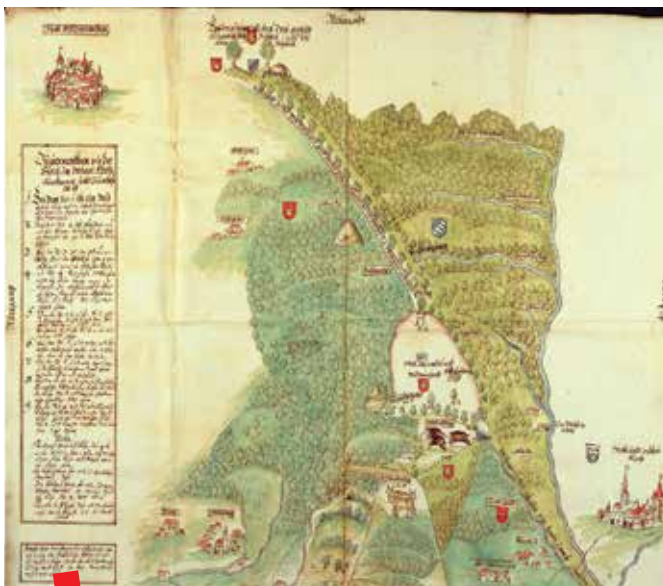
Digitalizirana anonimna kopija karte iz 1592. nastala u 18. stoljeću koja prikazuje šumu između Waldmünchena, Furth im Walda i češke granice.

Porta fontium Facebook stranica: https://www.facebook.com/portafontium.eu/