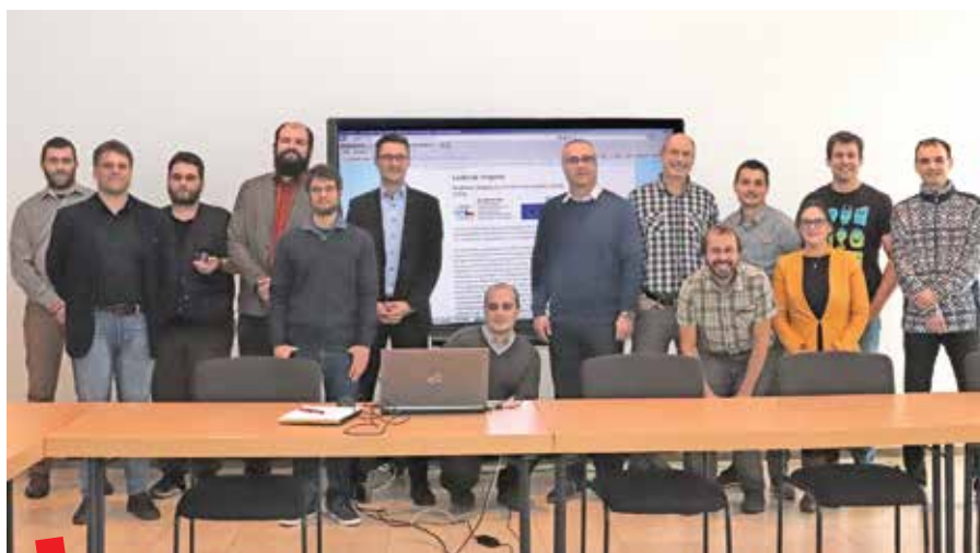
Sudionici projekta na radionici u Münchenu, prosinac 2019.

U Republici Češkoj partneri su Državni regionalni arhiv u Plzeňu ( Státní oblastní archiv v Plzni ), Sveučilište zapadne Češke u Plzeň ( Západočeská univerzita v Plzni ) i Zapadno češki institut za zaštitu kulturne baštine i dokumentaciju ( Západočeský institut pro ochranu a dokumentaci památek ). U Bavarskoj su u projekt su uključeni državni regionalni arhivi u Ambergu i Landshutu te glavni državni arhiv u Münchenu ( Staatlichen Archive Bayerns ) i Sveučilište Friedrich-Alexander u Erlangen-Nurembergu.