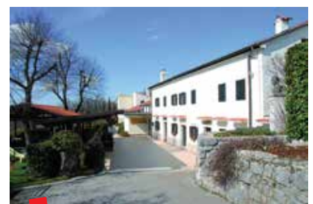
Spomen dom Ivana Matetića Ronjgova