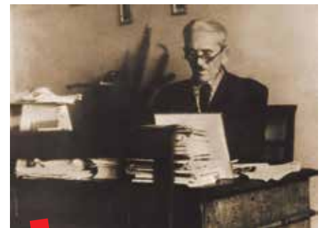
Ivan Matetić Ronjgov za svojim radnim stolom u Brajšinoj 20 u Rijeci 1950-ih

je zvučni zapis u mp3 formatu koji oslikava osnovnu melodijsku liniju. Na taj je način svaka pjesma popraćena digitalnim notnim, midi i zvučnim zapisom što omogućuje online reprodukciju pjesama, ali i njihovu reinterpretaciju i preoblikovanje u neko novo, još nečuvano glazbeno ruho.