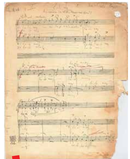
Autograf skladbe Čaće moj

Cilj je novonastale platforme Zaspal Pave integrirati različite izvore, reprezentirati kontekstualiziranu baštinu na suvremeni način te tako obogaćenu dati na korištenje, uživanje i reinterpretaciju novom naraštaju. ■