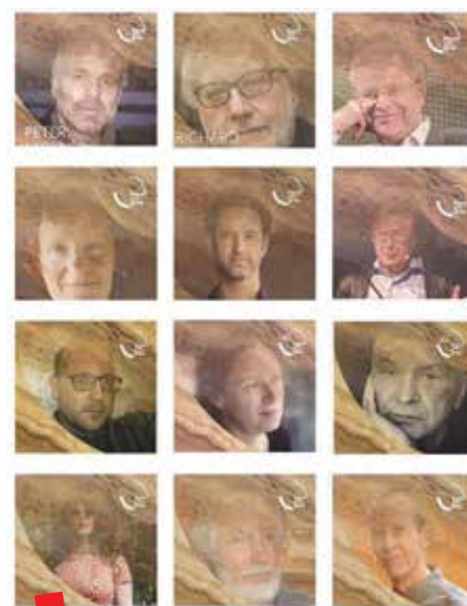
Portreti na mrežnoj stranici projekta „Archiv der Gegenwart“