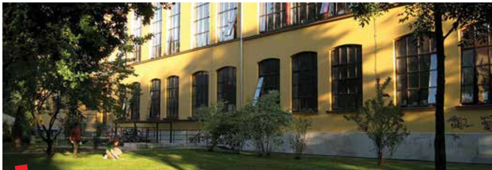
Akademija likovnih umjetnosti, Ilica 85

Što je prethodilo osnivanju i tko su bili inicijatori otvaranja takve likovne ustanove u ovom dijelu Europe?