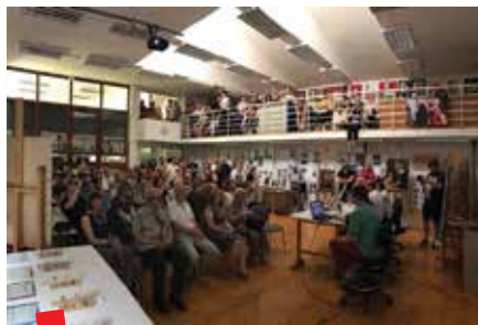
Predstavljanje monografije 20 godina OKIRU