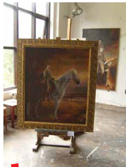
Slikarski odsjek ALU

Danas se nastava odvija u zgradama u Ilici, Jabukovcu i Zamenhoffovoj te u prostorijama zgrade u Zagorskoj ulici. ALU danas provodi šest studijsko-obrazovnih programa: slikarski, kiparski, grafički, nastavnički, restauratorski te studij animiranog filma i novih medija, koji su usklađeni s bolonjskim procesom u visokom školstvu.