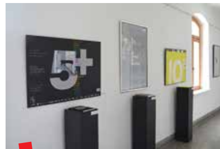
Izložbe u prostorima Akademije