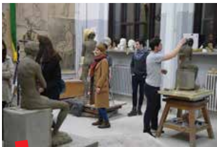
Posjetitelji Akademijinih programa u Noći muzeja © ALU