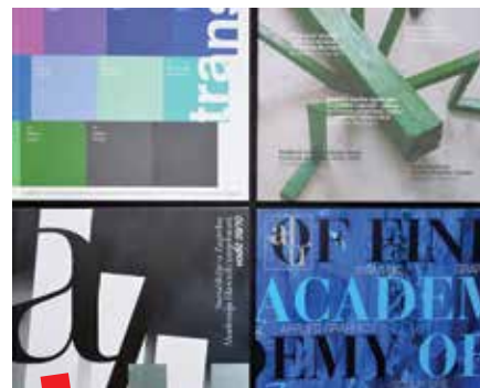
Izložba publikacija Akademije likovnih umjetnosti

Kontinuirani proces digitalizacije fondova u skoroj budućnosti otvara mogućnost suradnje Akademije likovnih umjetnosti s drugim hrvatskim i međunarodnim institucijama kroz projekte vezane uz digitalizaciju kulturne baštine. ■