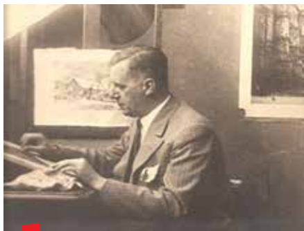
Branko Šenoa

A rhiv Akademije likovnih umjetnosti (ALU) Sveučilišta u Zagrebu specijalni je arhiv koji posjeduje gradivo od posebnog povijesnog i kulturnog značaja. Arhivsko gradivo na ALU sakupljalo se od samog osnutka ustanove. Iako prvih desetljeća djelovanja Arhiv nije bio organiziran kao služba, arhivsko i registraturno gradivo iz tog razdoblja je prilično dobro očuvano. Tada su Arhiv vodili profesori, tajnici i službenici ALU prema raspoloživim mogućnostima. Akademija likovnih umjetnosti uvrštena je u grupu imatelja arhivskog i registraturnog gradiva I. i II. kategorije, a ta kategorizacija obvezuje ALU da se s posebnom brigom odnosi prema svojem gradivu koje predstavlja jedan od najznačajnijih izvora za povijest umjetnosti 20. stoljeća u Hrvatskoj.