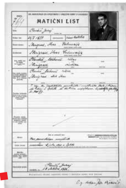
Matični list Juraja Plančića s Kraljevske akademije za umjetnost i umjetni obrt

Više informacija o Arhivu Akademije likovnih umjetnosti dostupno je na: http://www.alu.unizg.hr/alu/cms/front_content.php?idcat=136&lang=1