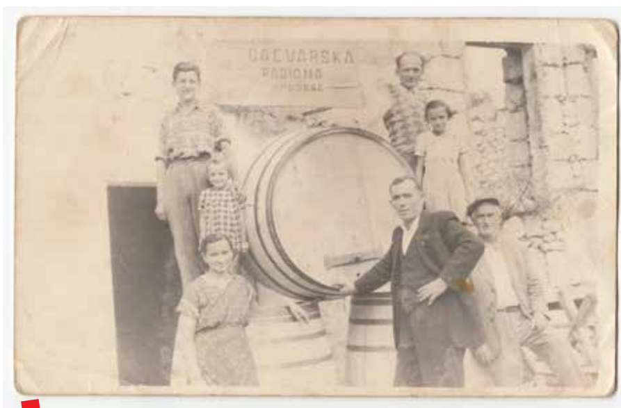
Bačvari obitelji Trlin, Vrgorac 50-ih godina

Međutim, nema smisla čekati dok Vrgorac dobije institucije za čuvanje pamćenja i dok se iz poboja razvije njegova historiografija, već je potrebno ne gubiti dragocjeno vrijeme i odmah djelovati. Iz toga razloga sam pokrenuo projekt „Vrgorac nekad“ koji ima za cilj čuvati sjećanje i istraživati povijest Vrgorca kroz sličice društvenog života njegovih stanovnika i tako kreirati vrijedan povijesni mozaik za generacije koje dolaze.