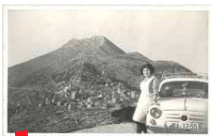
Vrgorac, 60-ih godina