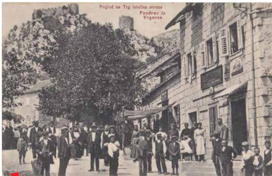
Centar Vrgorac, najstarija ulica Pijaca 1913.