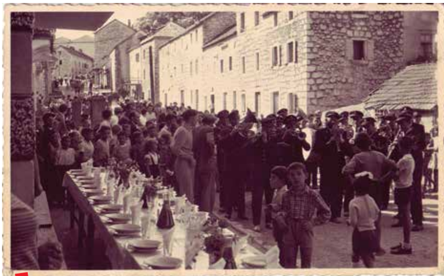
Limena glazba Vrgorac

Ovim projektom stare fotografije Vrgorca (i ljudi na njima) su ponovno oživjele, inače bi skrivene u nekoj ladici bile osuđene na propast zaborava i „zuba vremena“. Ovako su sačuvane i omogućile su popularizaciju lokalne povijesti u najširoj javnosti koja je prezentirana na svima razumljiv i dostupan način. I što je najvažnije – čuvaju vrgorski lokalni identitet. ■