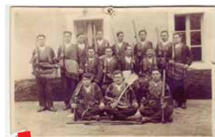
Rondari župe Vrgorac