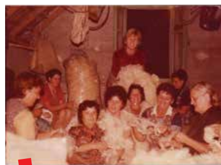
Čekupanje vune, Ercegovo selo, Vrgorac, 70-ih godina