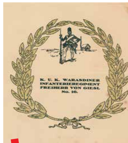
Grb Kraljevske i carske varaždinske pješake regimente baron von Giesl

Izvorni dokumenti nastali tijekom rata, bilo kao potreba za komunikacijom s bližnjima ili službeno evidentiranje dužnosti, predstavljaju vrijedan izvor o jednom vremenu i sudbini tzv. „malih ljudi“ u Velikom ratu. Potreba ljudi da ostave dokumentirani trag pismom, crtežom ili fotografijom o događajima, osobama i krajevima pomažu da se danas, ali i ubuduće, stvori što objektivnija slika o Prvom svjetskom ratu i njegovom utjecaju na pojedinca i društvo u cjelini. Nekada su istraživači morali osobno dolaziti u arhive kako bi proučavali izvorne dokumente dok je u današnje vrijeme, digitalizacijom izvornog arhivskog gradiva i njegovim distribuiranjem, to moguće pregledati i putem društvenih mreža, portala i internetskih stranica. ■