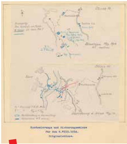
Skice položaja 16. pješačke pukovnije prije prelaska Drine i položaj na dan 6. kolovoza 1914.

des k.u.k. Warasdiner Infanterieregiment Nr. 16 ), jubilarne markice povodom obilježavanja 333. godine osnivanja 16. pješačke pukovnije. Posebno treba istaknuti spomenar 16. pješačke pukovnije ( Gedenkbuch des Offizierskorps des k.u.k. Warasdiner Infanterieregiments ) ukoričen u smeđu kožu, koji sadrži potpise časnika prije odlaska na ratište u Srbiju, sliku austrougarskih časnika s časnicima japanske carske vojne misije prilikom njihove posjete 16. pješačkoj pukovnici 22. srpnja 1914., ilustraciju uniformiranih časnika sa oznakama 16. pješačke pukovnije i uspomenu na tečaj albanskog jezika 7. travnja 1914. s potpisima polaznika.