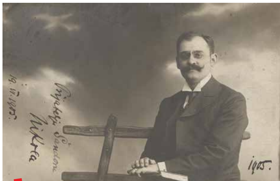
Nikola Andrić (posveta Ksaveru Šandoru Gjalskom, 1905.), Virtualna izložba „Parižanin s Vuke“

Gradska knjižnica Vukovar osvojila je 2018. prvu nagradu na natječaju Nacionalne i sveučilišne knjižnice u Zagrebu „Baština na mreži: izradi virtualnu izložbu u NSK“. Na natječaj je bio prijavljen prijedlog izrade izložbe „Parižanin s Vuke – Život i djelo Nikole Andrića“.