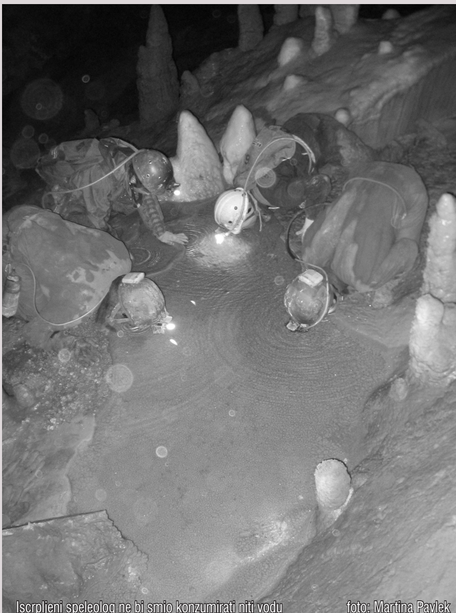
Iscrpljeni speleolog ne bi smio konzumirati niti vodu

Kako je pokretanje ovakva postupka teško i dugotrajno, ostaje rješenje o pokretanju upravnog spora u roku od 30 dana nakon primitka rješenja nekog nadležnog državnog tijela. Čl. 1 Zakona o upravnom sporu (NN 53/91, 9/92, 77/92) navodi da pravo pokretanja upravnog spora ima pojedinac ili pravna osoba ako smatra da joj je upravnim aktom povrijeđeno kakvo pravo ili neposredan osobni interes utemeljen na zakonu. Kako je npr. rješenje Ministarstva kulture o godišnjem dopuštenju za obavljanje