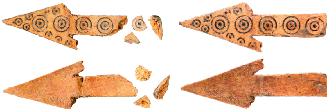
13. Fragmentirana koštana strelica s prednje i stražnje strane, stanje prije (lijevo) i nakon radova (desno). Dimenzije: 50 x 17 mm (fototeka HRZ-a, snimio J. Škudar, 2019.) Fragmented bone arrow head from front and back, condition before (left) and after (right) conservation. Dimensions: 50 x 17 mm (HRZ Photo Archive; J. Škudar, 2019)