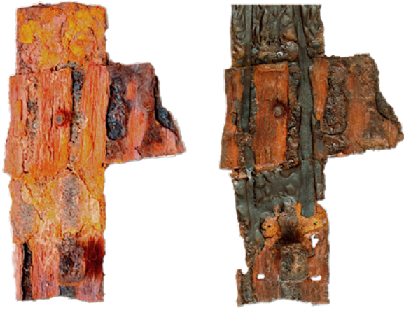
12. Detalj željeznog okova, stanje prije (lijevo) i nakon radova (desno). Dimenzije: 85 x 30 mm Detail of iron fittings, condition before (left) and after (right) conservation. Dimensions: 85 x 30 mm