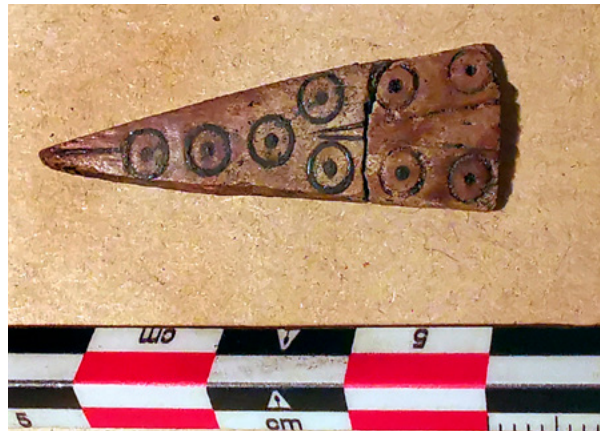
16. Koštani trokut s lokaliteta Gomila, stanje prije radova Bone triangle from Gomila, condition before conservation

Dekorativne strelice od roga ili kosti nisu bile oštećene vatrom. Na njima nisu uočeni tragovi koji bi upućivali na to da su bile pričvršćene na neki veći predmet. Naime, vizualno nisu primijećeni tragovi lijepljenja, ni urezi ili rupice koji bi navodili na moguće zakivanje ili prišivanje. Na naličju strelica također izostaju tragovi kontaminacije površine mineralima izazvani kontaktom s oksidiranom površinom kovine, koji u slučaju bronce obično boje kost zeleno (mineral malahit), 48 a željezo crvenkasto-smeđe (minerali hematit 49 i hidrohematit 50 kao dva primjera mogućih željeznih oksida). Samo je jedan manji ulomak strelice kontaminiran tamnim površinskim nečistoćama koje vjerojatno potječu od pepela u zemlji. Strelice su