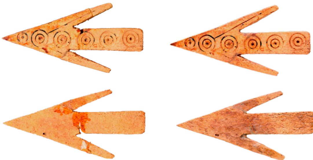
15. Cjelovita koštana strelica s prednje i stražnje strane, stanje prije (lijevo) i nakon radova (desno). Dimenzije: 50 x 25 mm Complete bone arrow from front and back, condition before (left) and after (right) conservation. Dimensions: 50 x 25 mm