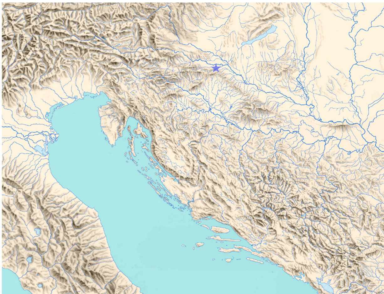
1. Položaj Jalžabeta u širem geografskom kontekstu (IA) Location of Jalžabet in a broader geographical context (IA)

zavoda postupno su restaurirani koštani i metalni nalazi iz tumula 2, uz istovremene radove na konzerviranju i restauriranju novih nalaza iz Gomile, pronađenih u istraživanjima u protekle tri godine. Uz to, provedene su i prve interdisciplinarnе analize uzoraka i nalaza iz Jalžabeta na Šumarskom fakultetu Sveučilišta u Zagrebu, na Katedri za biofiziku Medicinskog fakulteta Sveučilišta u Zagrebu, Zavodu za paleontologiju i geologiju kvartara HAZU-a te na Institutu za fiziku i Institutu za antropologiju iz Zagreba. 3 Dok se pisao ovaj tekst, dio slikanih koštanih predmeta iz Jalžabeta poslan je na analizu u briselski Royal Institute for Cultural Heritage (KIK-IRPA). Osim toga, i druge analize su još u tijeku pa će biti objavljene u drugoj publikaciji. 4 U tekstu se daje pregled rezultata dosadašnjih arheoloških istraživanja u Jalžabetu te se predstavljaju postupci konzerviranja i restauriranja pokretnih arheoloških nalaza iz starijega željeznog doba pronađenih u Jalžabetu.