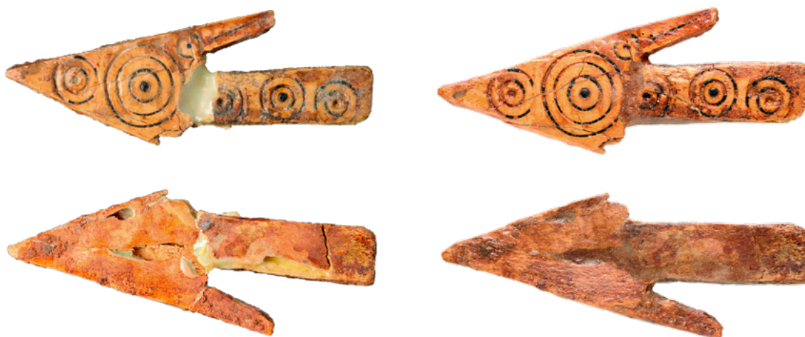
14. Koštana strelica na kojoj su uklonjeni stari restauratorski zahvati s prednje i stražnje strane, stanje prije (lijevo) i nakon radova (desno). Dimenzije: 48 x 20 mm Bone arrow head on which the removal of old restoration interventions from the front and back was performed, condition before (left) and after (right) conservation. Dimensions: 48 x 20 mm