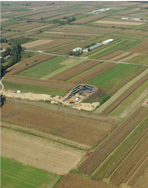
5. Zračna fotografija Gomile u Jalžabetu tijekom zaštitnih istraživanja 2018. (snimili M. Šimek i T. Trubić, 2018.) Aerial photographs of Gomila in Jalžabet during protective excavations in 2018 (M. Šimek, T. Trubić, 2018)