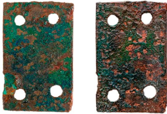
9. Pločica oklopa od bakrene legure, stanje prije (lijevo) i nakon radova (desno). Dimenzije: 27 x 17 mm

Iron armour scale, condition before (left) and after (right) conservation. Dimensions: 30 x 23 mm