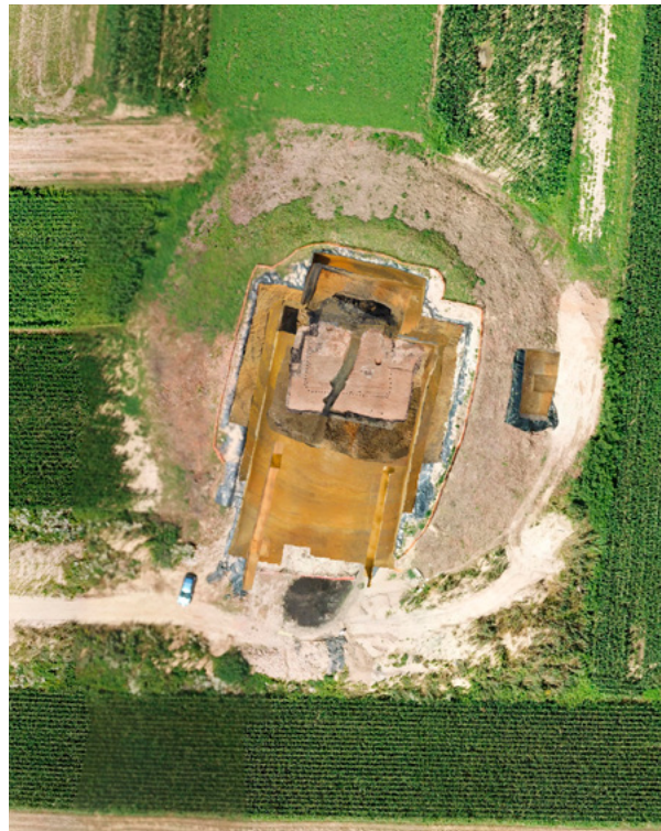
6. Fotogrametrijski prikaz arheoloških istraživanja grobne komore tumula 1 – Gomile u Jalžabetu, s položajem sonde 2 na istočnoj padini (izradio M. Maderić, 2019.) Photogrammetric presentation of archaeological excavations of the tomb chamber in tumulus 1, Gomila, in Jalžabet, with the position of probe 2 on the eastern slope (M. Maderić, 2019)

strane, pronalazak tumula 2 dugo je ulijevao nadu da se u neposrednoj okolini tumula 1 – Gomile i tumula 2 na Bistričaku, među naborima niza niskih uzvišenja i greda, nalazi još grobnih gomila koje je nemoguće prepoznati golim okom. 19 Rezultati geofizičkih istraživanja provedenih oko Gomile na proljeće 2019. godine unutar projekta „Iron-Age-Danube“ Interreg DTP upućuju na nekoliko zanimljivih položaja koje bi vrijedilo arheološki testirati. Tijekom istraživanja tumula 2 potvrđeno je da se radi o cjelini iz starijega željeznog doba, o pogrebnom spomeniku istočnoga kruga halštatske kulture, iz razdoblja Ha D1. Među nalazima iz tumula 2 na Bistričaku u Jalžabetu posebno su važne ukrašene strelice izrađene od kosti ili roga, kao i ostaci ljuskastog željezno-brončanog oklopa istočnog tipa. 20 Paljevina je, u kojoj su prema rezultatima zooarheoloških analiza prepoznate kosti konja, bila razasuta po podu grobne komore. 21 Cijeli je dromos bio posut drvenim ugljenom i garom, koji su vjerojatno doneseni s lomače, kao i namjerno razbijenim keramičkim posuđem, i onda prekriven finim žutim pijeskom. Nakon svega, na komoru je nasut zemljani humak.