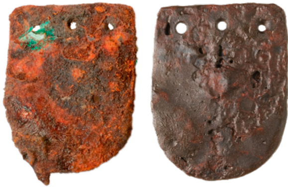
8. Željezna ljuska oklopa, stanje prije (lijevo) i nakon radova (desno). Dimenzije: 30 x 23 mm

Iron armour scale, condition before (left) and after (right) conservation. Dimensions: 30 x 23 mm