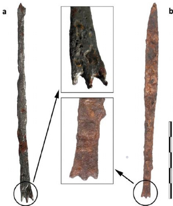
7. Dvije alatke za ukrašavanje predmeta od roga iz Caričina grada (NEMANJA MARKOVIĆ, SONJA STAMENKOVIĆ, 2016.) Two tools for decorating horn objects from the Empress's City (NEMANJA MARKOVIĆ, SONJA STAMENKOVIĆ, 2016)

godini. 25 S druge strane, projekt je činio niz intenzivnih promotivno-edukacijskih i popularno-znanstvenih aktivnosti kojima je osnovna svrha bila senzibilizirati što više ljudi za probleme iznimno osjetljive prapovijesne arheološke kulturne baštine. Održan je niz seminara, okruglih stolova, predavanja i školskih radionica u Varaždinu, Jalžabetu i drugim mjestima, a na razini projekta izrađene su i Strategije za monumentalne (pra)povijesne krajolike Podunavlja te baza podataka s lokalitetima starijega željeznog doba ( Strategies for monumentalized (pre)historic landscapes in the Danube Region https://www.iron-age-danube.eu/ ). Postavljanjem arheološko-turističke staze u Jalžabetu 2019. godine, počela je prezentacija toga iznimnog arheološkog krajolika. 26 Nažalost, ujesen 2017. godine, usred provedbe projekta Iron-Age-Danube otkriveno je da je gigantski tumul 1 – Gomila u Jalžabetu opljačkan i teško oštećen. Taj je događaj bio pokretač zaštitnih istraživanja koja je financiralo Ministarstvo kulture Republike Hrvatske, koja su se nastavila 2018. i 2019. godine (sl. 5 i 6). Pokretni arheološki nalazi, osobito monumentalna grobna arhitektura, i kompleksni pogrebni ritual potvrđuju da je Gomila jedan od najvažnijih prapovijesnih spomenika te vrste istraženih u posljednje vrijeme u Europi. U tekstu ćemo predstaviti zahtjevno konzerviranje i restauriranje izabranih pokretnih arheoloških nalaza iz Jalžabeta i tako dati prilog raspravi o izgledu i funkciji predstavljenih nalaza.