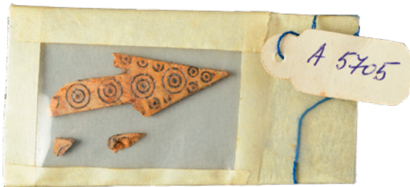
11. Improvizirano, nepravilno pakiranje oštećene koštane strelice Improvised, improper packaging of a damaged bone arrow head

različitim predmetima. Osim metalnog oklopa i predmeta ukrasne namjene, obrađena su i tri vrha željeznih strelica. Opsežnost i složenost konzervatorsko-restauratorskih radova najbolje pokazuju brojevi. Zaprimljeno je 86 vrećica i kutija s ukupno 2281 predmetom, od čega su 1692 brončana i 589 željeznih. Od toga je čitavih ili bolje sačuvanih s pripadajućim inventarnim brojevima bilo 109, dok su ostali u većem ili manjem stupnju termički oštećeni – od blago deformiranih do sasvim amorfnih nakupina rastopljene bronce (sl. 10). Od koštanih predmeta zaprimljeno je devet potpuno ili djelomično sačuvanih dekorativnih strelica i četiri ulomka. Pri preliminarnom pregledu i fotografiranju postojećeg stanja zaprimljenih predmeta iz tumula 2, uočeni su problemi: neprikladno pakiranje i prethodni pokušaji restauratorskih zahvata. Pakiranje je bilo raznovrsno. Predmeti su bili upakirani u plastične kutije za sitni alat, u metalne kutije od krema, papirnate vrećice i salвете, kartonske kutije i, u manjoj mjeri, u polietilenske vrećice. Neki nalazi su pakirani i u kombinaciji više neadekvatnih materijala, npr. koštana strelica zamotana je u dijelove plastične folije, papira i papirnate ljepljive trake (sl. 11). Upotrijebljeni kartoni i papiri nisu