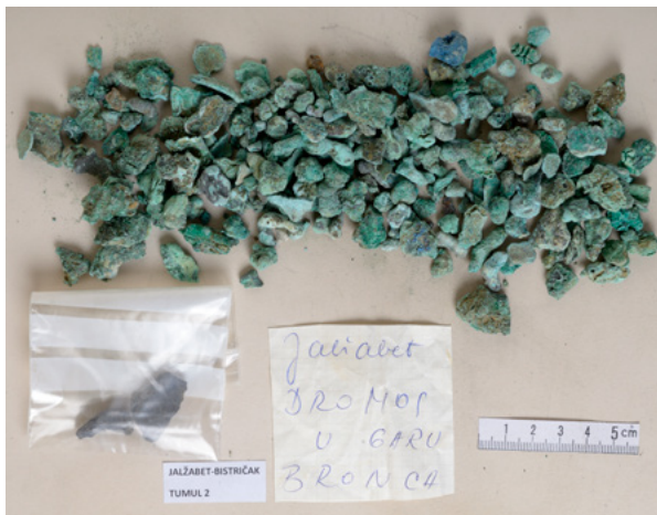
10. Ostaci rastopljene bronce i željeza iz tumula 2, stanje prije radova Remains of melted bronze and iron from tumulus 2, condition before conservation