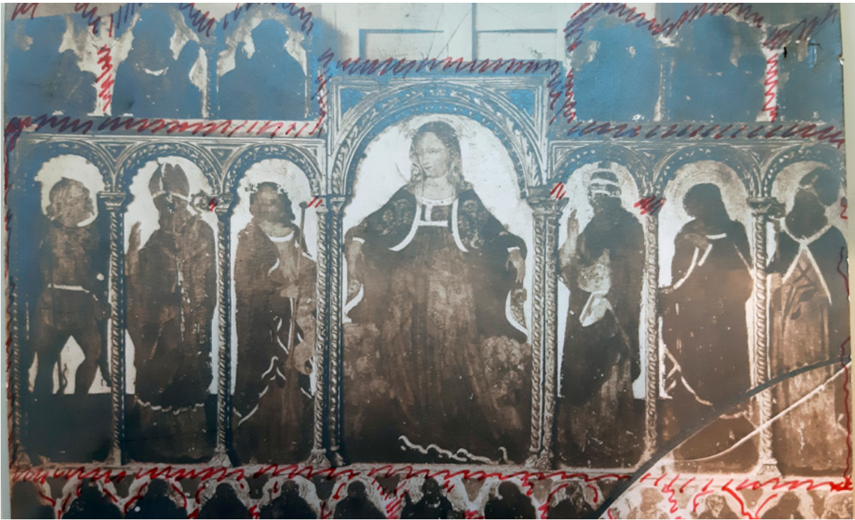
15. MKM, KO ST – Fs Fotografija šibenskog poliptiha Nikole Vladanova, zatečeno stanje s ucrtanim mjestima oštećenja okvira, snimio Matej Sternen (s.a.) MKM, KO ST – Fs The Šibenik polyptych by Nikola Vladanov, condition before restoration with damage to the frame, photo by Matej Sternen (s.a.)

fotografirana djela iz samostana te je naveo da je autor fotograf Stühler. 98 No već iz idućeg dopisa doznajemo da snimke slika nisu uspjele te da će se morati ponovno fotografirati nekom drugom prilikom. 99 Razlog su možda bili loši uvjeti snimanja ili manjak iskustva u fotografskom dokumentiranju slikarskih djela, budući da je takav proces zahtijevao velik trud, složena znanja i iskustvo terenskoga rada, a to su ipak bila jedna od prvih sustavnih snimanja slikarskih djela u Dalmaciji. 100 U međuvremenu je do konzervatora Karamana došla vijest o tome da je neki gospodin iz Beča, dan nakon njegova posjeta, također fotografirao umjetnine iz samostana sv. Nikole u Trogiru te da je negative i pozitive odmah poslao u Beč. Izradio ih je po svoj prilici s nakanom posredovanja u kupnji starinskih predmeta iz Dalmacije, na što je Karaman odmah reagirao, upozoravajući mjerodavno Starješinstvo u Trogiru da su prodaja i izvoz umjetnina izvan teritorija Dalmacije strogo zabranjeni. 101 Godine 1932. na Karamanov zahtjev, Stühler je snimao ikone u Splitu i okolici. 102