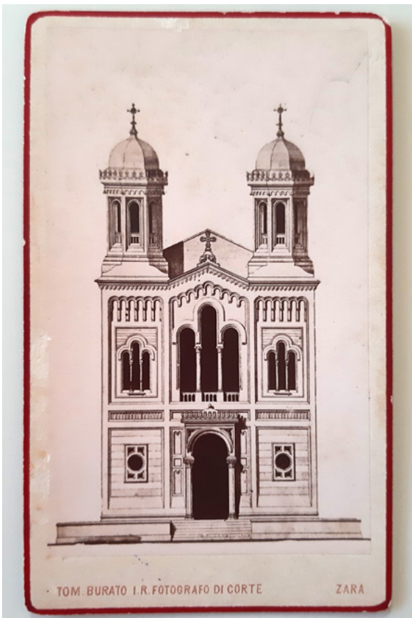
3. MKM, KO ST – Fs Fotografija projekta pravoslavne crkve u Dubrovniku, snimio Tommaso Burato, oko 1877. godine MKM, KO ST – Fs Project of the Orthodox Church in Dubrovnik, photo by Tommaso Burato, around 1877