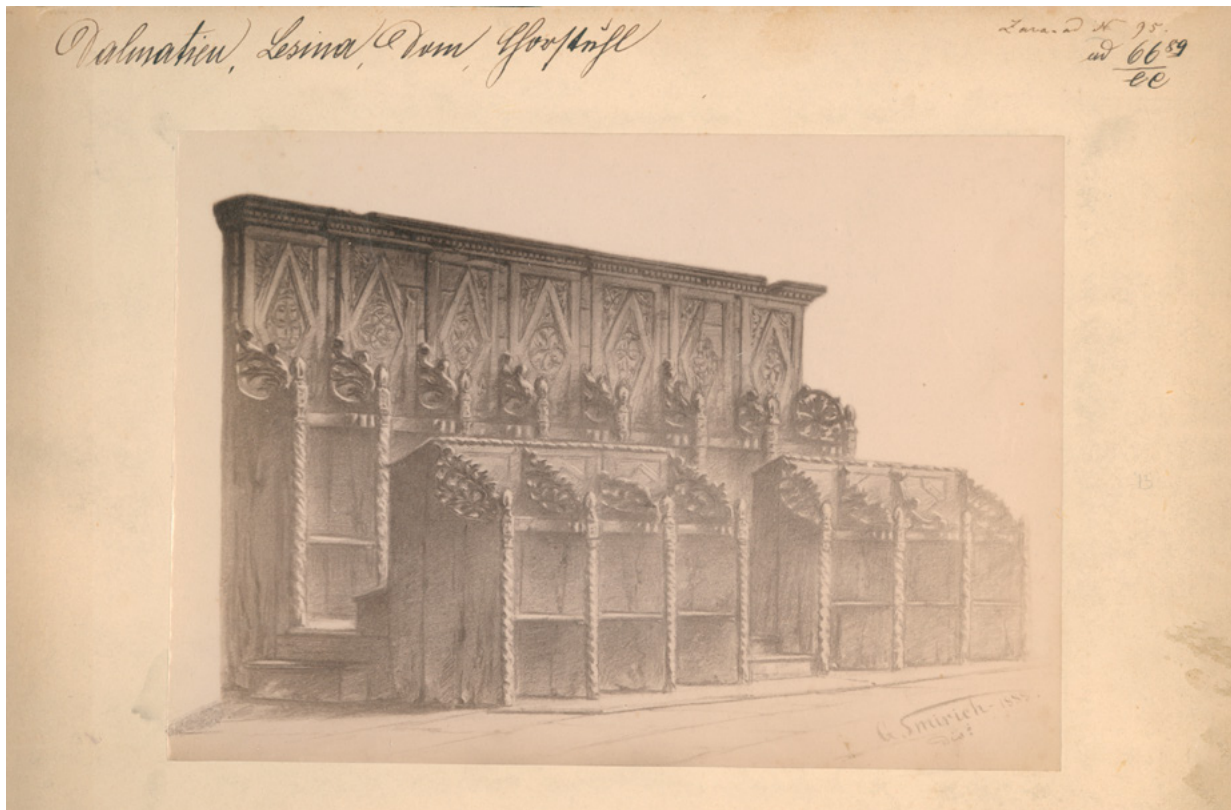
5. MKM, KO ST – Fs Fotografija crteža zatečenog stanja korskih klupa hvarske katedrale prije restauriranja, snimio Tommaso Burato, 1889. godine MKM, KO ST – Fs Drawing of the condition of choir benches from the Hvar Cathedral before restoration, photo by Tommaso Burato, 1889