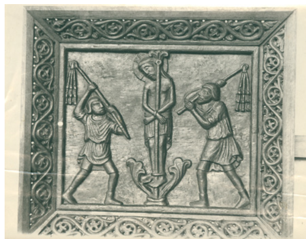
11. MKM, KO ST – Fs Fotografija kasete Buvininih vratnica tijekom restauriranja, snimio Ivan Znidarčić, 1908. godine MKM, KO ST – Fs Cassette from Buvinina's door during restoration, photo by Ivan Znidarčić, 1908

tiskao u Beču 1914. godine pod nazivom Illustrierter Katalog des historisch. Kunstverlages von Josef Wlha . U njemu, među ostalim, donosi popis od 38 fotografija koje je snimio u Perastu, Korčuli, na Lokrumu, u Splitu, Šibeniku, Dubrovniku, Trogiru, Zadru, Rabu i Puli. 67