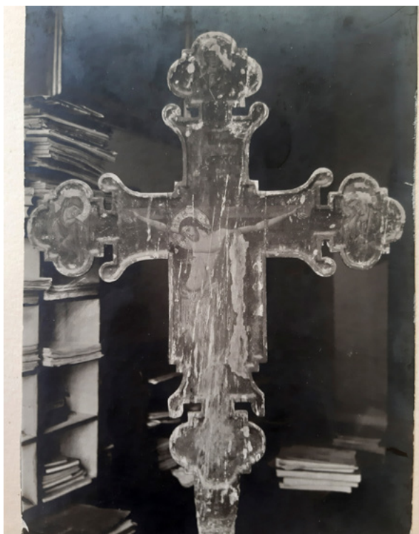
13. MKM, KO ST – Fs Fotografija slikanog raspela iz 14. stoljeća iz župne crkve u Segetu prije restauratorskog zahvata Mateja Sternena 1925. godine MKM, KO ST – Fs Painted crucifix from the 14 th century from the parish church in Seget before the 1925 restoration by Matej Sternen