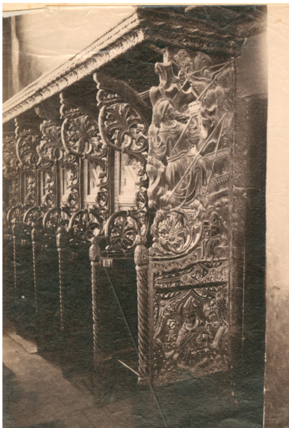
7. MKM, KO ST – Fs Fotografija korskih klupa franjevačke crkve u Zadru MKM, KO ST – Fs Choir benches from the Franciscan Church in Zadar

je konzervator točno crtežom dokumentirao zatečeno stanje klupa (a vjerujemo da nema razloga da tako ne bude), onda bi opsežnu restauratorsku rekonstrukciju predstavljao gornji niz lisnatih vitica kojima su odijeljene sekcije klupa.