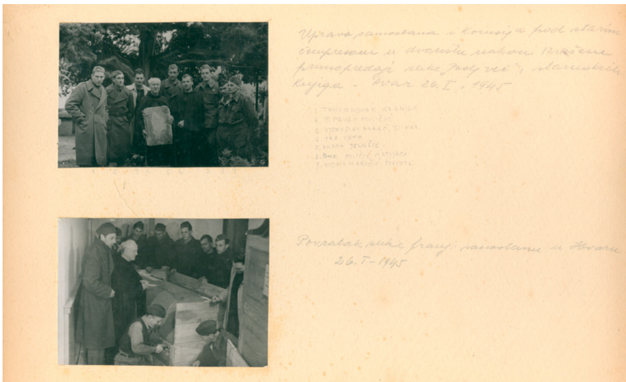
16. MKM, KO ST – Fs Fotografija slike Posljednja večera iz franjevačkog refektorija u Hvaru; a) detalj slike, b) tijekom demontaže, snimio Foto Benčić, 1944. godine MKM, KO ST – Fs Painting Last Supper from the Franciscan Refectory in Hvar. a) detail of the painting b) during disassembly, photo by Foto Benčić, 1944

Uprava zavodstana i komisija pod starim čuvarima u dvorštu nakon primopredaje slike „Posljednja večera“ i starinskih knjiga - Hvar 26. I. 1945