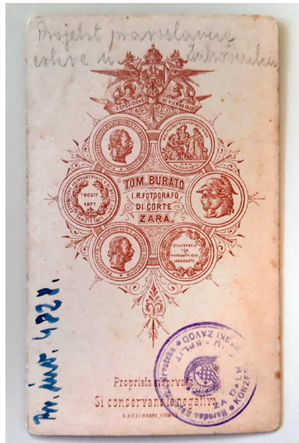
4. MKM, KO ST – Fs Fotografija projekta pravoslavne crkve u Dubrovniku, stražnja strana s logotipom fotografa Tommaso Burata, oko 1877. godine MKM, KO ST – Fs Project of the Orthodox Church in Dubrovnik, back of the church with the logo of photographer Tommaso Burato, around 1877

dijelove tih dokumenata može se smatrati nekim od najranijih primjera konzervatorsko-restauratorske dokumentacije, budući da katkad donose opis stanja umjetnina, vrstu konzervatorsko-restauratorskog zahvata, odnosno sumarni program restauriranja pojedine umjetnine te troškovnik cjelokupnog zahvata. 14