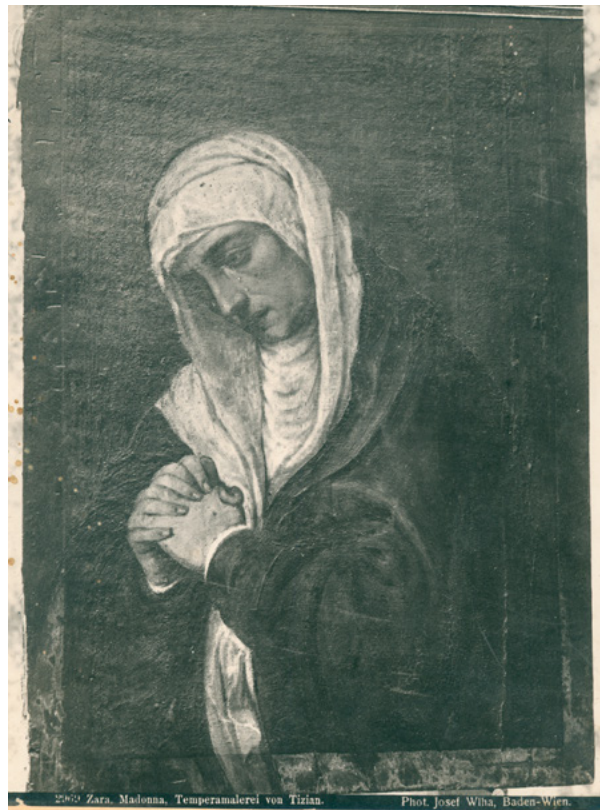
9. MKM, KO ST – Fs Fotografija Gospa Žalosne iz benediktinskog samostana u Zadru, snimio Josef Wlha, 1889. – 1893. godine MKM, KO ST – Fs Photograph of Our Lady of Sorrows from the Benedictine monastery in Zadar, photo by Josef Wlha, 1889–1893

u katalogu iz 1893. godine. Iznimku čine dvije fotografije pod rednim brojevima 2095a i 2095b, koje su snimljene u Zadru i prikazuju škrinju sv. Šimuna.