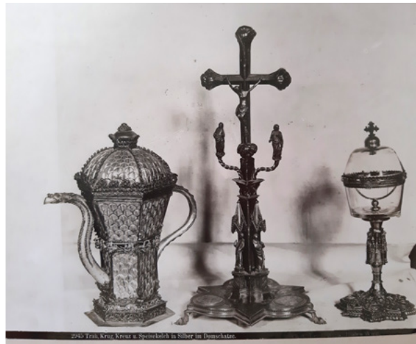
8. MKM, KO ST – Fs Fotografija srebrnog posuđa iz riznice trogirске katedrale, snimio Josef Wlha, 1889. – 1893. godine MKM, KO ST – Fs Silverware from the treasury of the Trogir Cathedral, photo by Josef Wlha, 1889–1893

Wlha u Dalmaciju ponovno dolazi 1899. godine. O njegovu dolasku u Dalmaciju izvijestio je lokalni Narodni list u svibnju 1899. godine: „Stigao je u Dalmaciju fotograf Josip Vlha iz Beča. On namjerava načiniti zbirku svih umjetničkih tvorevina, koje se nalaze u Dalmaciji. Tu zbirku hoće da izloži na pariškoj izložbi. Ova njegova namjera u velike koristi našoj zemlji, tim, što, svraća pažnju internacionalne publike na Dalmaciju i pozivlje je da ju posjeti. S druge strane služi Dalmaciji na čast. Zato „Društvo za promicanje narodno-gospodarskih interesa kraljevine Dalmacije“ moli najučtivije sve one, kojima se rečeni Vlha obrati za dopust i pomoć, neka budu gotovi da mu pomognu i neka mu pokažu sve ono, što je vrijedno da se snimi.“ 64 Wlha je 6. listopada 1899. godine izdao račun Društvu Bihać za snimanje nadgrobnog natpisa hrvatske kraljice Jelene koji je otkriven u istraživanjima 1898. godine. 65 Za taj mu je posao isplaćeno 15 fiorina, odnosno 30 kruna, no ta fotografija za sada nije poznata, niti se spominje u bilo kojem za sada poznatom Wlhinu katalogu. Naime, nakon boravka u Dalmaciji 1899. godine, Wlha je već sljedeće, 1900. godine otisnuo poseban katalog fotografija spomenika u Dalmaciji i Istri, koji je objavio u Beču pod naslovom Denkmale der Kunst und Archäologie in Dalmatien und Istrien: fotografisch aufgenommen von Josef Wlha . 66 Međutim, taj katalog sastoji se gotovo isključivo od popisa onih snimki koje su prethodno bile objavljene