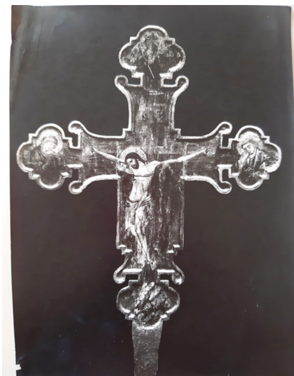
14. MKM, KO ST – Fs Fotografija slikanog raspela iz 14. stoljeća iz župne crkve u Segetu nakon restauratorskog zahvata Mateja Sternena 1925. godine MKM, KO ST – Fs Painted crucifix from the 14 th century from the parish church in Seget after the 1925 restoration by Matej Sternen

novoizrađenim dijelovima 90 (sl. 15). S tim u vezi, Sternen i kipar Josip Grošelj (koji je surađivao sa Sternenom na projektu i bio zadužen za drvorezbarske dijelove) u nastavku dopisa traže Karamanovo mišljenje i odobrenje za provedbu svojega prijedloga o nadomjestku okvira. 91