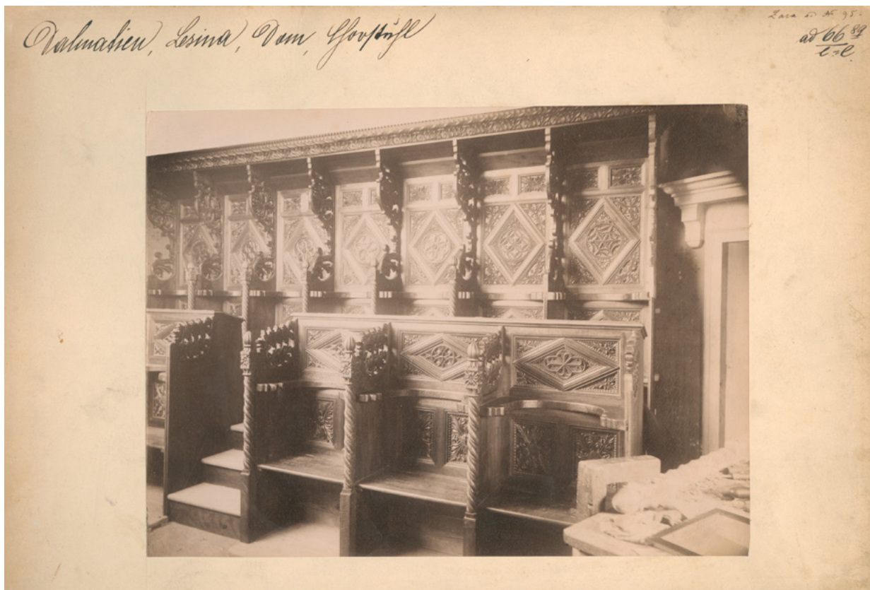
6. MKM, KO ST – Fs Fotografija korskih klupa hvarske katedrale nakon restauriranja, snimio Tommaso Burato, 1889. godine MKM, KO ST – Fs Choir benches from the Hvar Cathedral after restoration, photo by Tommaso Burato, 1889