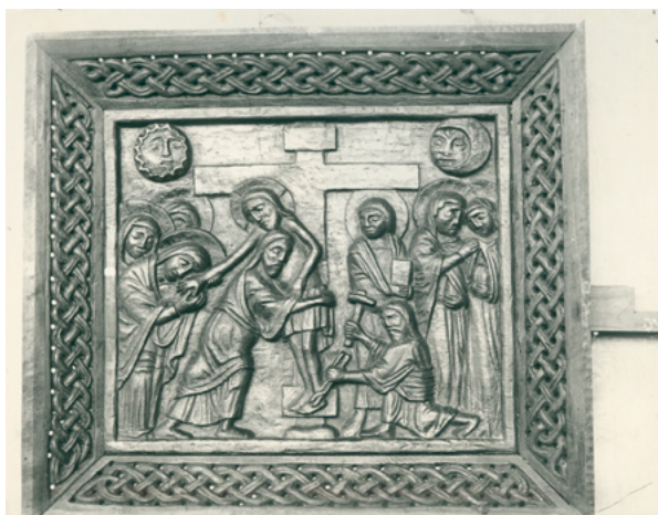
10. MKM, KO ST – Fs Fotografija kasete Buvininih vratnica tijekom restauriranja, snimio Ivan Znidarčić, 1908. godine MKM, KO ST – Fs Cassette from Buvinina's door during restoration, photo by Ivan Znidarčić, 1908