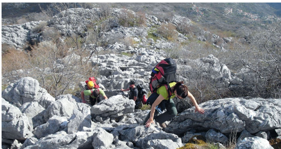
Iznad Bradarića staja

Jama M2 istražena je daleke 1987. g. u sklopu speleološkog logora na Bradarića stajama. Prema tadašnjem nacrtu bila je duboka 202 metara. Smještena je na sjevernim padinama mosorskog vrha Jabukovac čije je glavno obilježje teško prohodan krš. Na logoru je istražen veći broj jama od kojih je upravo M2 najdublja. Od 90-ih pa dalje područje se više ne istražuje, već se posjećuju neke pristupačnije jame. I M2 je bila posjećena i pri tome premjerena, bez izradbe nove topografske snimke, a ti podatci nikada nisu izašli u javnost. Nova istraživanja na sjevernoj strani Jabukovca započinju 2005. g. kada se na obližnjem lokalitetu Javor drage pronalazi više objekata od kojih je najdublje istražena jama Marganuša – 160 m. Rekognosciranjem terena zalazi se u područje na kojem je bio logor i ponovno se rađa želja za dodatnim istraživanjem starih objekata. Polazu se nade u modernije tehnike napredovanja u podzemlju koje se nisu primjenjivale za vrijeme logora – proširivanje prolaza i tehničko penjanje. S obzirom na to da Bradarića staje više nitko ne posjećuje, pristupni su putovi potpuno zarasli. Odlazak u jamu s opremom po takvu terenu nije imao smisla i stoga se organizira radna akcija krčenja staze. U cjelodnevnoj akciji, uz mnogo rada i truda, prosječna je staza do staja.