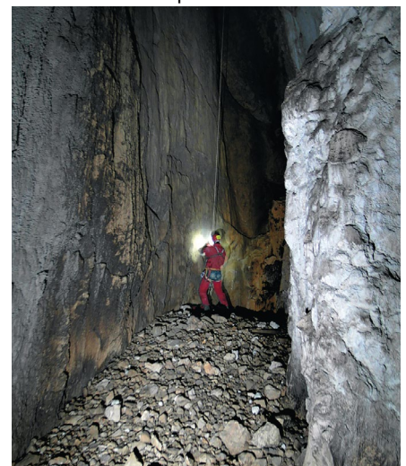
Polica na 150 m dubine