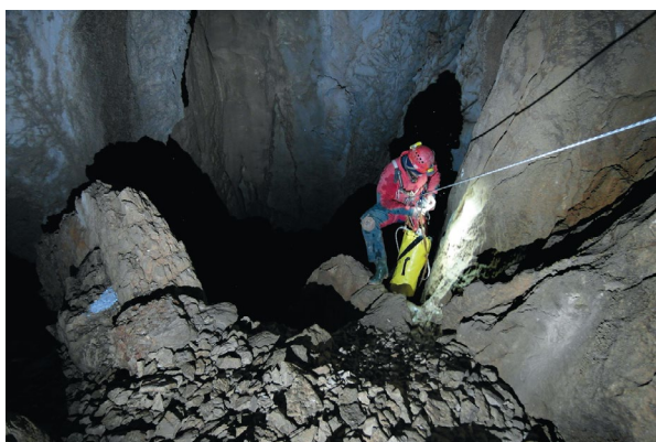
Ulaz u zadnju vertikalu

radnom nacrtu: 188. Naši će se stari malo razočarati, ipak su se ponosili tom jamom. Nažalost, više nije najdublja na Mosoru. Smanjili smo je. Ipak, mjerenje laserom kudikamo je preciznije od rastezanja metra. Pomalo raspremamo i povlačimo se iz dubina. Dan je već odmakao i valja se izvući na stazu jer noć nije poželjna na tome neprohodnom terenu. Iako je ova naporna akcija planirana u jednom danu, to nije bio razlog da se izostavi vrlo bitna speleološka oprema – gradele. Tri kilograma čevapa nestalo je za tren uz gutljaje piva... U zalaz sunca napuštamo Jabukovac pa uz svjetla čeonih lampa stižemo na parkiralište. Još jedno pivo u birtiji za nadoknadu izgubljene tekućine i elektrolita i možemo kući.