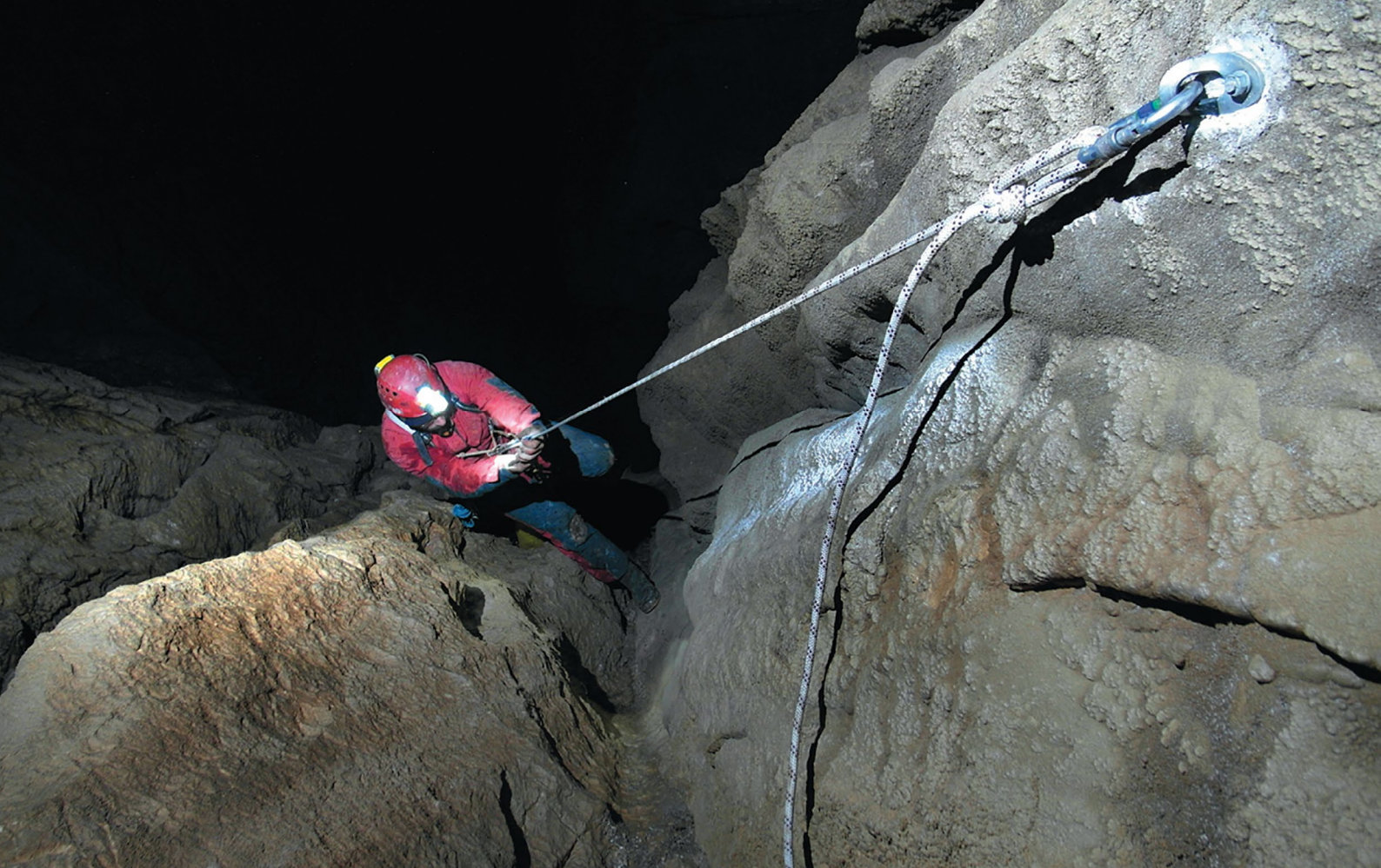
Zadnja vertikalna

Ovom smo akcijom ozbiljno zaprijetili mosorskom klubu – 200 m. Ostala je još samo jedna, davno istraжена jama koja ide više od toga. M2 je upravo ispala s popisa i nije sigurno da će s premjeravanjem Javorska 2 imati više