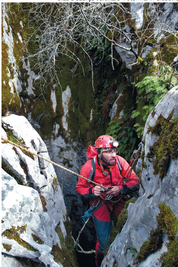
Prva sidrišta