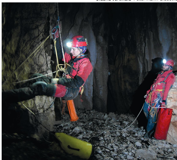
Na dnu ulazne vertikale