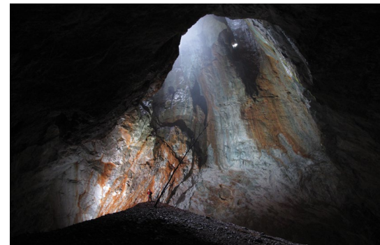
Ispod ulaza u jama u Krogu