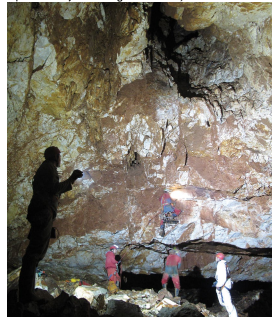
Penjanje u znatiželju (Kaverna u tunelu Učka)