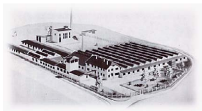
Sl.2 Varaždinska industrija svile u početku rada