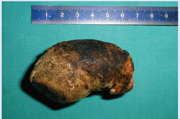
Slika 3. Prikaz žučnog kamenca ekstrahiranog iz pilorusa, dimenzija 7 x 3,5 x 2,5 cm.

U prikazanom slučaju pacijentice, akutni abdominalni bol te laboratorijski i slikovni nalazi ukazali su na bilijarnu etiologiju akutnog abdominalnog bola. Diferencijalno dijagnostički posumnjalo se na kolecistitis i patologiju vezanu uz prethodno dokazanu kolelitijazu. Tek je nakon dva dana, zbog pogoršanja kliničke slike, pacijentici na EGD-u dokazan etiološki uzrok akutnog abdominalnog bola. Naime, žučni kamenac pronađen u području pilorusa bio je toliko velik, da je uz opstrukciju pilorusa došlo i do pojave upalnog pro-