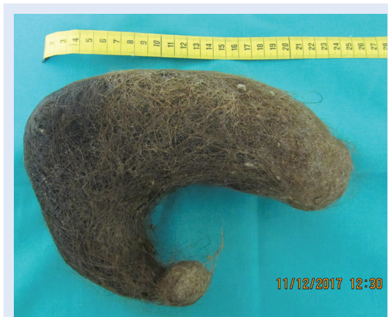
Slika 2. Trihobezoar želuca i početnog dijela duodenuma.

Dlake se nakupljaju u želucu jer nisu podložne razgradnji želučanim enzimima. Zbog svoje glatke površine prilikom djelovanja peristaltike ne giba-