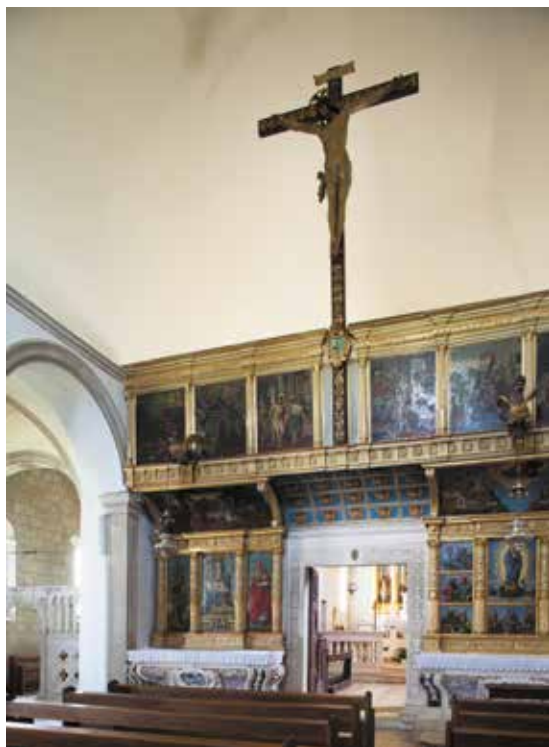
Septum franjevačke crkve u Hvaru iz 16. st., rad Martina Benetovića

Posljednjih godina života Duknović je bio u problemima. Dokumenti bilježe njegovu prisutnost u rodnome gradu u vezi sa sudskom parnicom koju je godine 1497. vodio s kamenarom Nikolom Suđevićem zbog neisplaćena računa. 43 Godine 1498. Duknović je započeo gradnju oltara za bratimsku dvoranu u Scuola Grande di S. Marco u Veneciji, koji nije dovršio te je morao platiti odštetu bratovštini. 44 Vraća se u Trogir 1500. i nastavlja raditi. Tada nastaje kip sv. Ivana Evanđelista, vjerojatno godinu dana prije njegova posljednjeg poznatog djela u ankonitanskoj