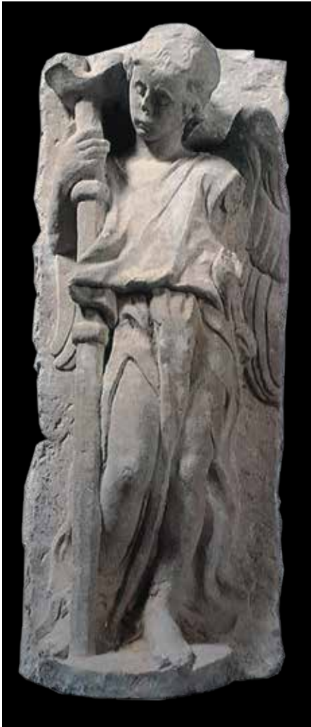
Nikola Firentinac, anđeo bakljonoša iz katedrale u Trogiru. Izglednije je da je bio dio septuma 15. st., nego neizvedenog oltara kapele bl. Ivana Trogirskog

katedrali sv. Cirijaka, gdje godine 1509. radi grobnicu blaženog G. Gianellija. 45