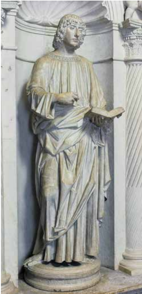
Ivan Duknović, kip sv. Ivana Evanđeliste u niši kapele bl. Ivana Trogirskog

ih sa skulpturama iz kapele sv. Ivana Trogirskog. 24 Smatrao je da su se dva mala anđela, koja kleče nad ovalnim bazama držeći objema rukama posude nad svojim ramenima, nalazili uz kip Krista Uzašašća, u kapeli svetog Ivana Trogirskog. Isklesani su u pokretu, zabačenih glava i pogleda prema nebu, dok u pozi punoj poštovanja kleče noseći plitke vaze na ramenima.