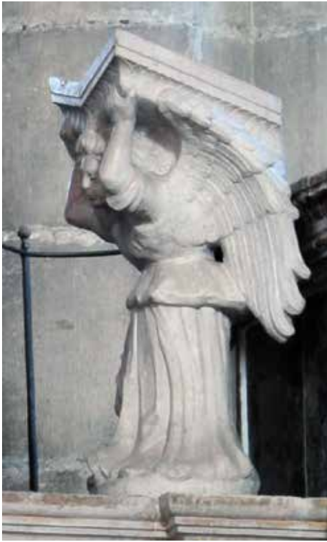
Anđeo koji nosi Riječ Kristovu na septumu kora crkve S. Maria Gloriosa dei Frari u Veneciji