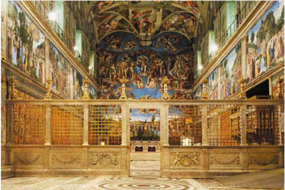
Septum Sikstinske kapele, 15. st. Prijedlog Ernsta Steinmanna da se dio pregrade pripiše Duknoviću je odbačen.

Duknovićev kip morao biti njegova ranija faza, iz sedamdesetih ili osamdesetih godina 15. st., naprotiv, mogao je biti i kip naručen za Trogirsku katedralu 1508. godine.