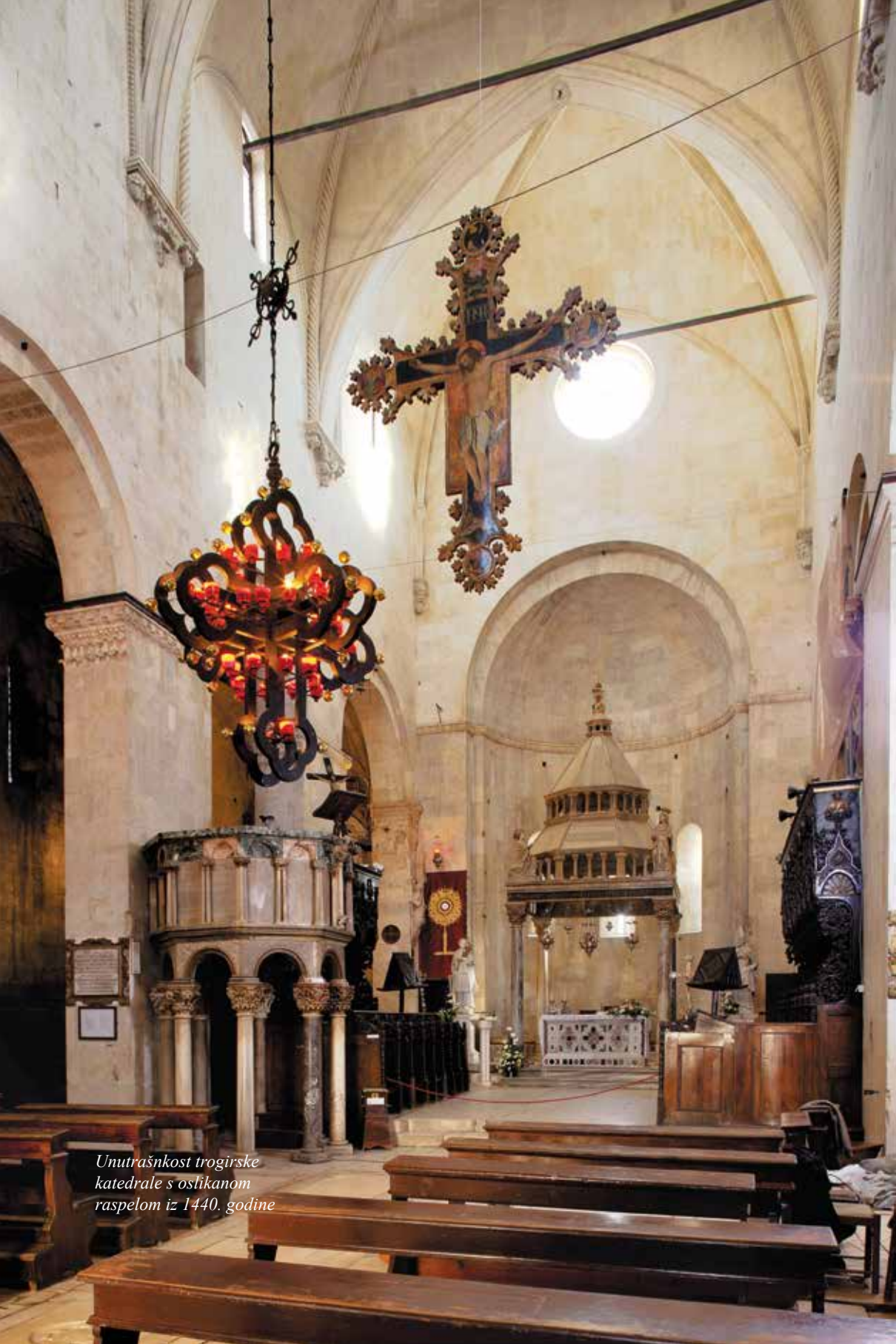
Unutrašnjost trogirске katedrale s oslikanom raspelom iz 1440. godine