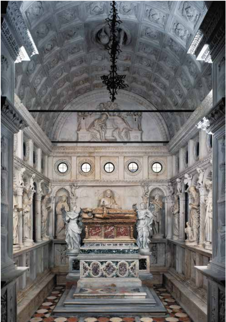
Kapela bl. Ivana Trogirskog