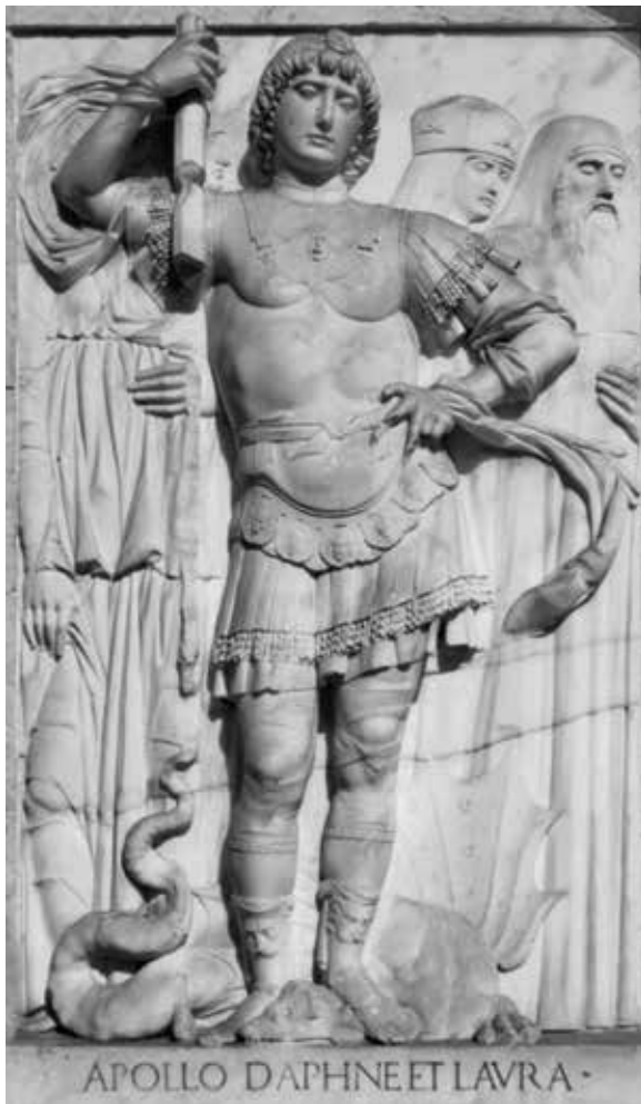
Duknovičev sv. Teodor; Reljef za oltar bratovštine sv. Marka u Veneciji, danas u vrtu vile Brenzoni, Lago di Garda

Samo Štefanac u svojoj knjizi posvećenoj kiparstvu Nikole Firentinca samo se na jednom mjestu dotaknuo figura anđela nosača zdjele, ponavljajući ranije postavljenu hipotezu kako su oni flankirali stariji kip Krista Uzašašća uz koji su još dva anđela, pa bi s ova dva bila četiri kao u ugovoru. 30 U katalogu trogirске izložbe posvećene Nikoli Firentincu u Trogiru Vanja Kovačić donosi anđele nosače vaza, ne definirajući kojoj su skulpturi pridruženi, već samo navodi da pogledom adoriraju Krista. 31