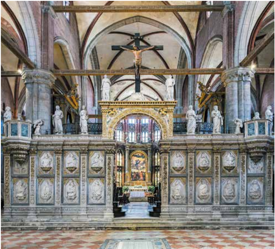
S. Maria Gloriosa dei Frari u Veneciji, septum s Kalvarijom

već za neki drugi opus na kojem je radio Nikola Firentinac. Mogao bi biti jedna od ploča spomenutog septuma kora katedrale na kojem je pretpostavljeno mjesto i drugih dvaju njegovih anđela nosača zdjela.