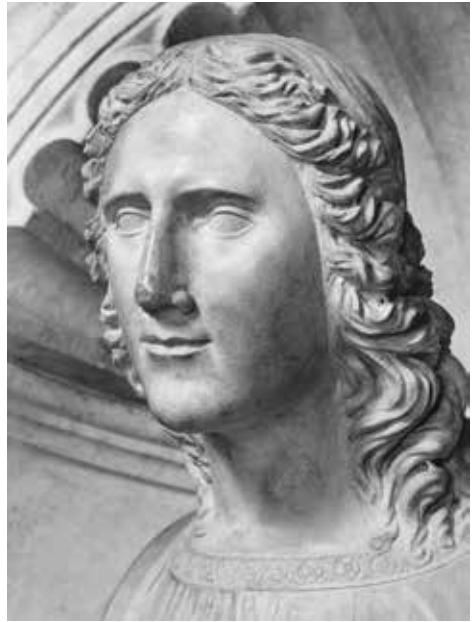
Ivan Duknović, Sv. Toma Evanđelist, glava