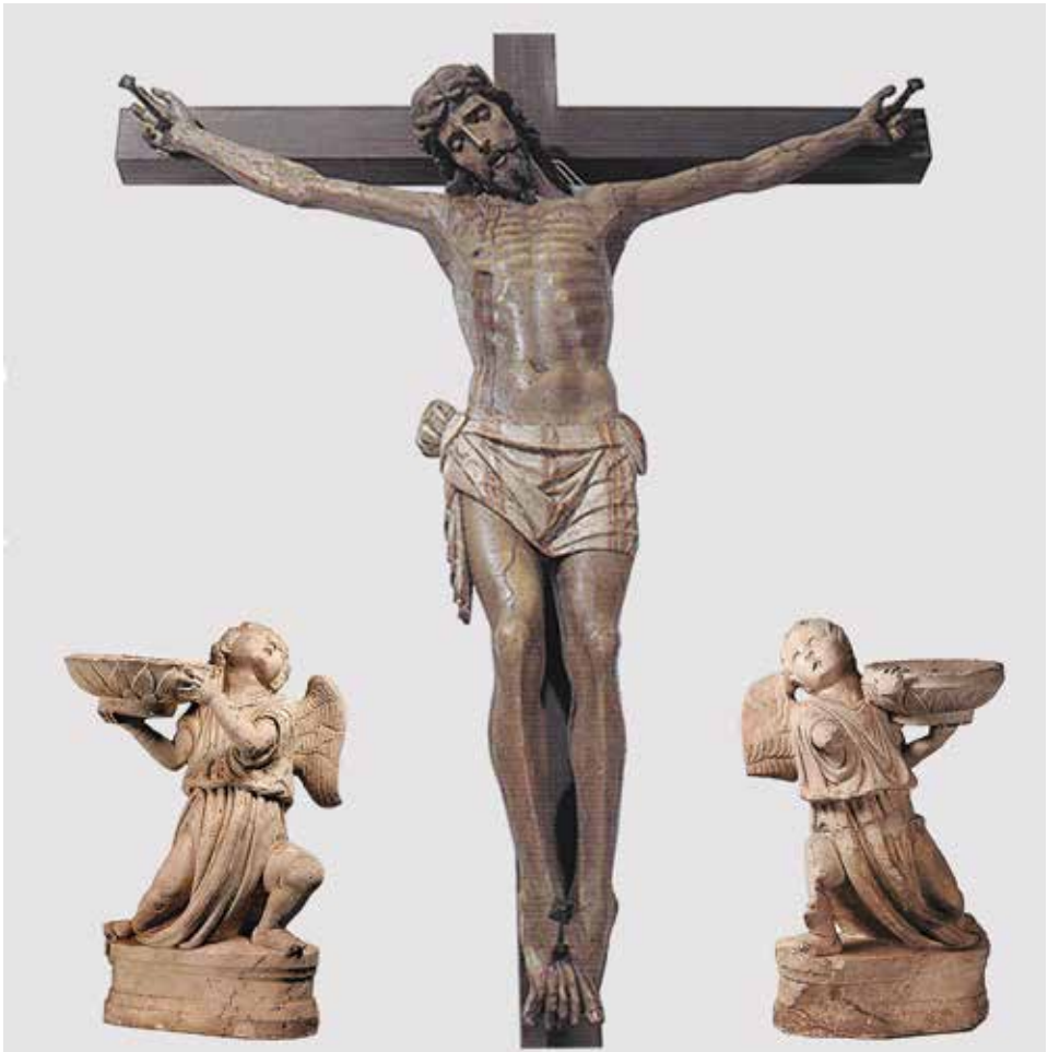
Drveno raspelo iz 1508. s anđelima koji skupljaju krv Kristovu, rad Nikole Firentinca nakon obnove septuma početkom 16. st.