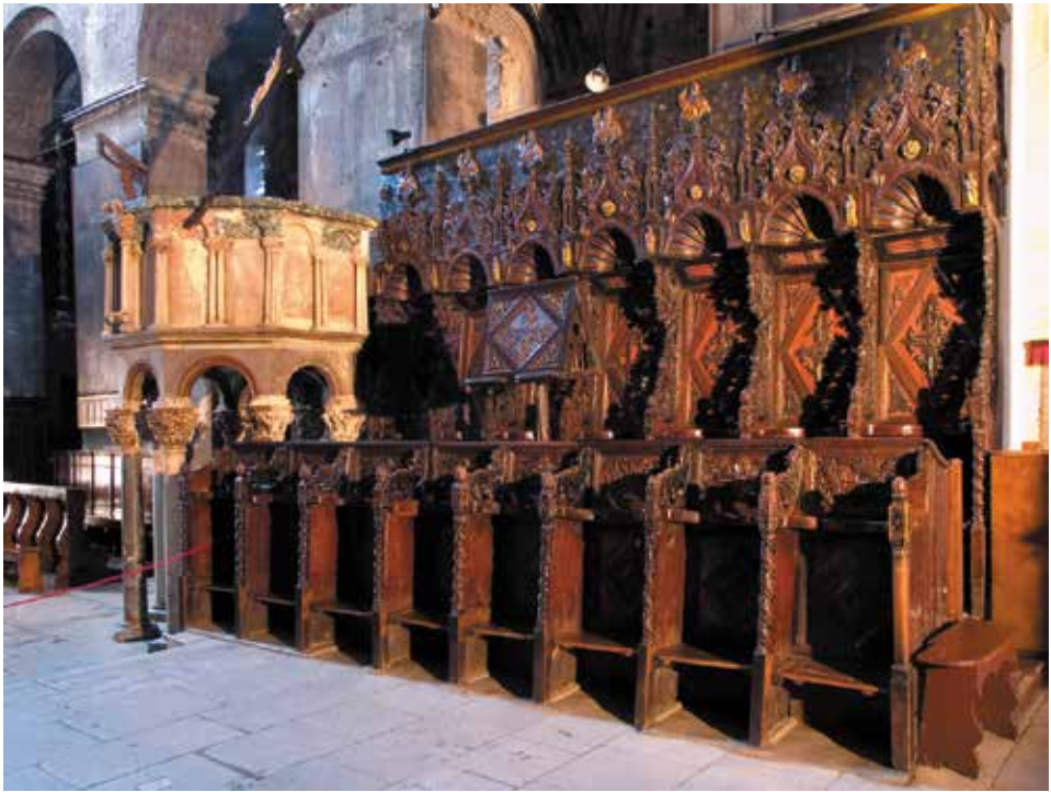
Trogirska katedrala, korske klupe izravnete 1731. zajedno s rušenjem septuma i oltara sv. Ivana Evanđeliste

mijenilo postojeće monumentalno. Posrijedi je, naravno, bila neka nova zamisao o modernizaciji interijera crkve.