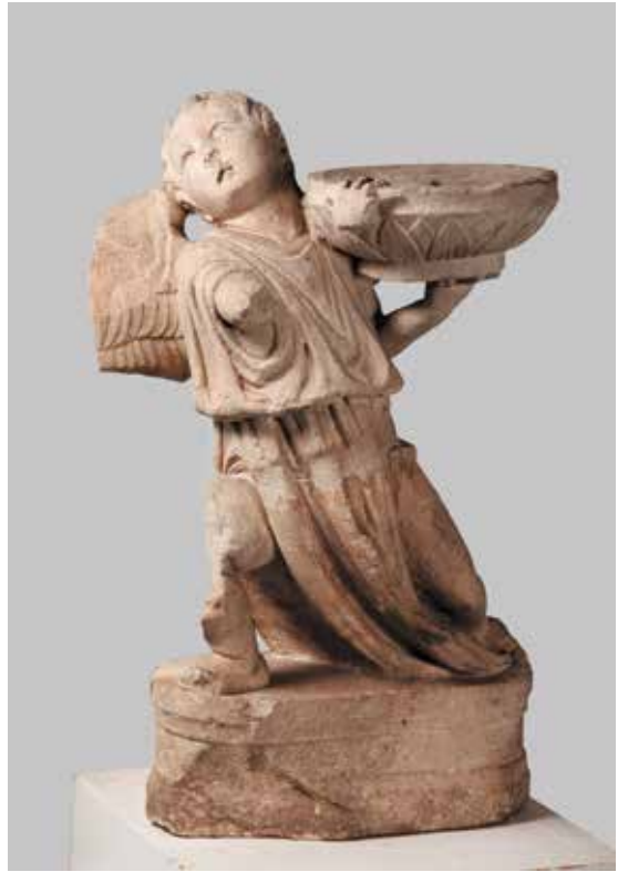
Nikola Firentinac, Anđeo sa septuma kora trogirске katedrale u zdjelu skuplja kapi Krvi Kristove koje kapaju s križa