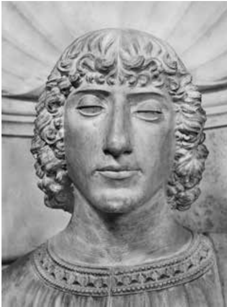
Ivan Duknović, Sv. Ivan Evanđelist, glava