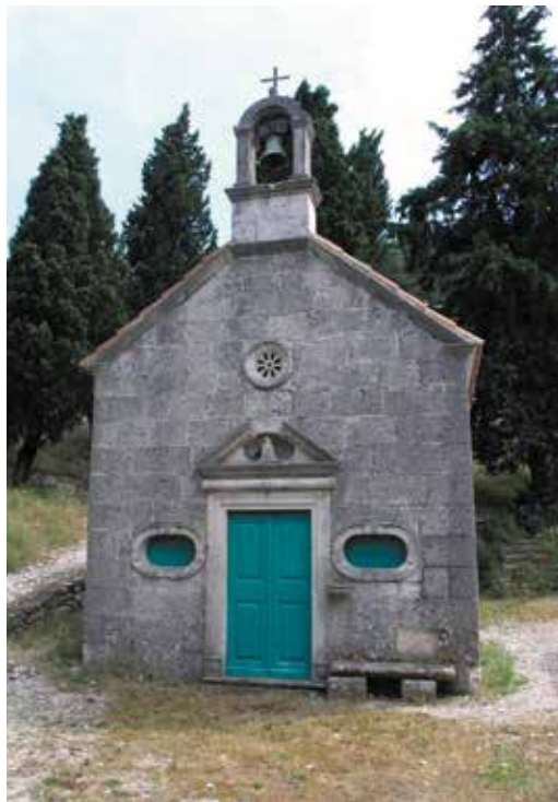
Crkva Gospe od Milosti na otoku Vrniku