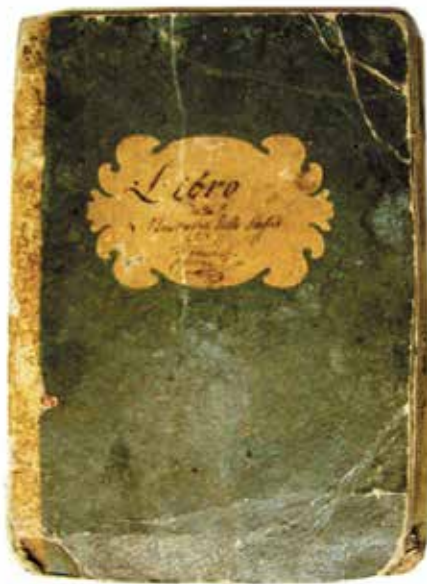
Rukopis Libro della Maestranza dello Scoglio Vernich , Opatski arhiv u Korčuli

„Faros od ovih nije mnogo udaljen otok, a osnovali su ga Parijci, dok Crnu Korkiru nastavaju nasljednici Knidani – a u ovom kraju je vrlo široka močvara i kod nje kamen koji zovu lihnit“.