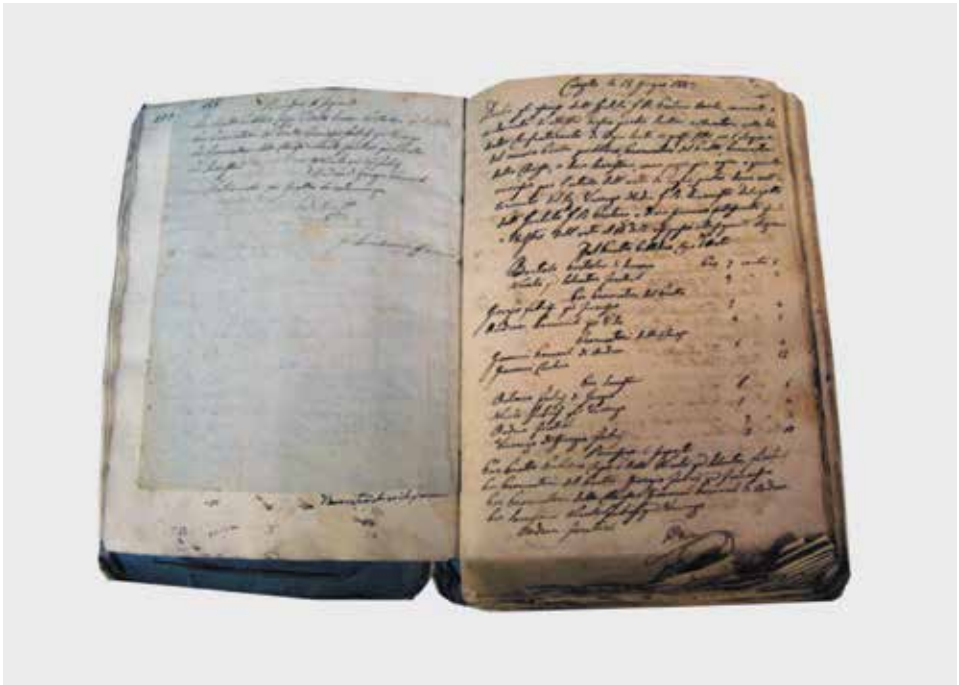
Primjer zapisnika iz 1843. o glasovanju u korčulanskoj bratovštini Svih Svetih s brojem „punata“ uz pojedina imena majstora kamenoklesara

Najčešće zapisnici započinju kako slijedi: