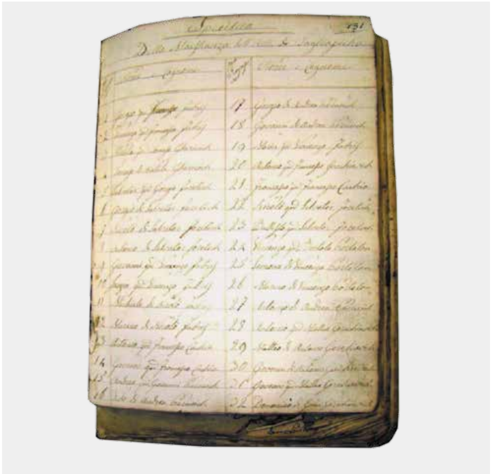
Popis kamenoklesara Specifica della Maestranza dell'Arte di Tagliapietra iz 1806. godine

lazimo i popis klesara po imenu i prezimenu. Ukupno je upisano 47 klesara ( dell'arte di Tagliapietra ) 7 i 7 naučnika ( curzoni ).