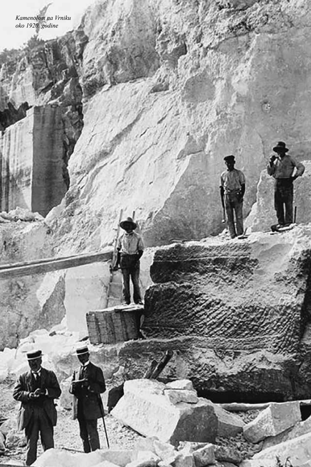
Kamenolom na Vrniku oko 1920. godine