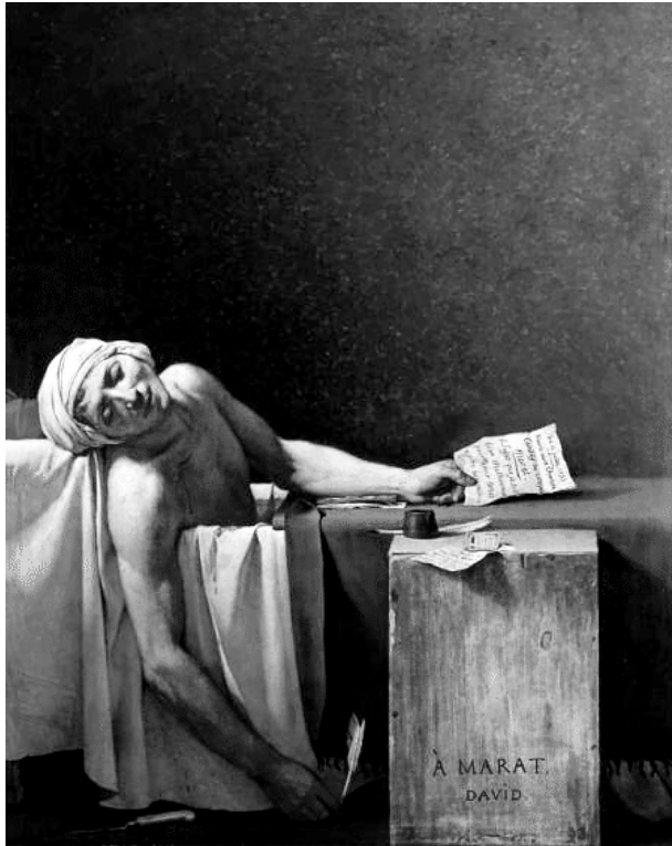
Slika 1: Jacques-Louis David, Maratova smrt ( Marat assassine ), 1793. Ulje na platnu, 165 × 128 cm. Kraljevski muzej umjetnosti u Belgiji (Musees Royaux des Beaux-Arts de Belgique). 3

nadići naizgled bezizlaznu situaciju nemogućnosti predstavljanja ‘istine’ koja bi zadovoljila sve uključene strane. Drugim riječima, kao što to tvrdi Clark, čin svrgavanja kralja s prijestolja, u svojim širim konzekvencama, mijenja kut gledanja koji traje do današnjih dana, u tijelo Marata upisuje se političko, ono postaje svojevrsna apstrakcija, kao i praznina iza njega.