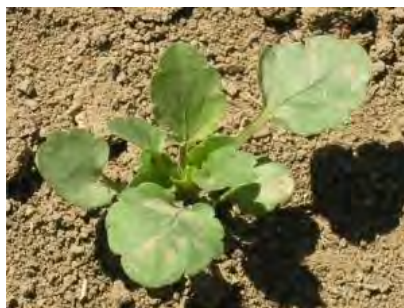
Slika 5. Rana vegetativna faza V. arvensis (poljska ljubica)

Figure 4. Seedlings of field pansy ( Viola arvensis )