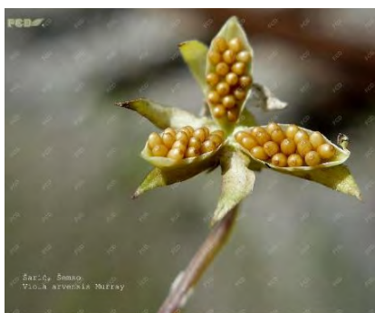
Slika 6. Plod poljske ljubice ( V. arvensis ) (Izvor: https://hirc.botanic.hr/ )

Figure 5. Early vegetative stage of V. arvensis (field pansy) (Source: Damalas i sur., 2018)