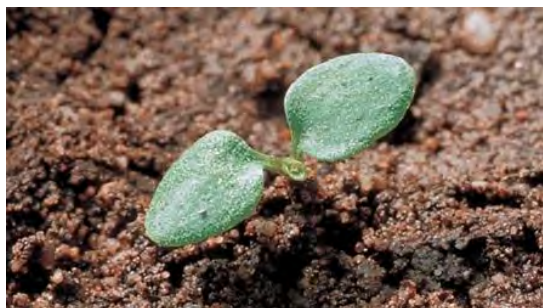
Slika 4. Kotiledoni poljske ljubice ( Viola arvensis )

boje, veličine 1 - 1,7 mm (slika 6 i 7), a u jednom plodu razvija se od 32 do 75 sjemenaka (Doohan i Monaco, 1992; Damalas i sur., 2014). Masa 1000 sjemenaka je oko 0,50 g, a u jednom kilogramu nalazi se 2 000 000 sjemenaka (Hulina, 1998). Rasprostranjuje se diszoohorijom (slučajno životinjama), stomatozoohorijom potpomognutom elajosomima i suhim pucavcima (Nikolić T. ur., 2020).