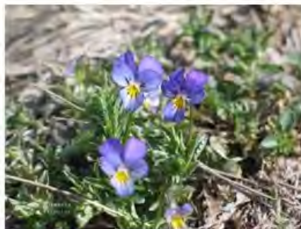
Slika 3. Viola arvensis (poljska ljubica) (lijevo) i Viola tricolor (maćuhica) (desno)