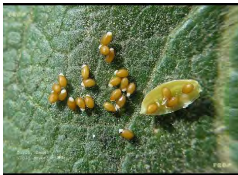
Slika 7. Sjeme poljske ljubice ( V. arvensis )

Figure 6. Fruit of field pansy ( V. arvensis )