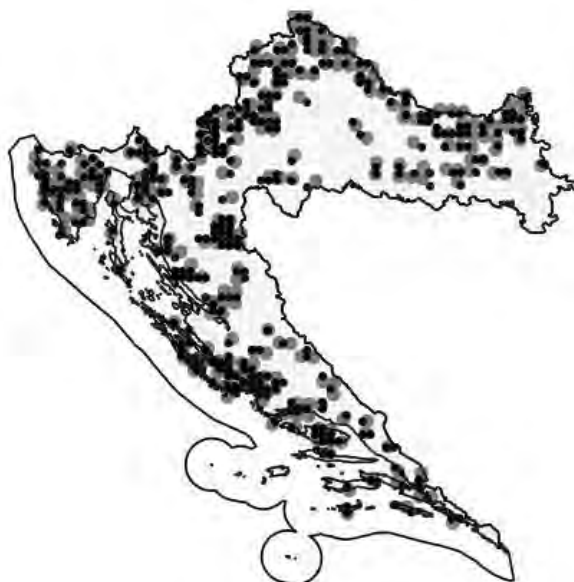
Slika 2. Rasprostranjenost poljske ljubice ( V. arvensis ) u RH