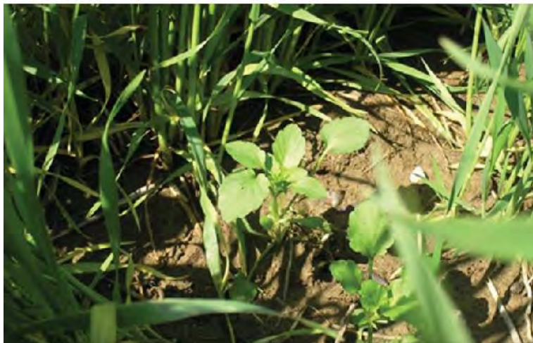
Slika 8. Korovna vrsta V. arvensis (poljska ljubica) u usjevu pšenice

Bodendorfer, 1998; Degenhardt i sur., 2004). Kod V. arvensis važnije su neizravne štete (Bachthaler i sur., 1986) jer problem nastaje pri žetvi usjeva kad je prisutno oko pet sjemenaka po jednoj biljci V. arvensis u žetvi, a osim sjemena kombajnom zahvaćeno biljno tkivo V. arvensis može utjecati na povećanje vlage sjemena žitarica.