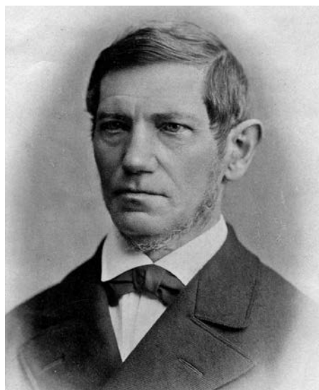
Slika 3. Prof. dr. Ferdinand von Arlt (1812. – 1887.), šef Prve bečke očne klinike od 1856. do 1883.

Reformirao je ovu svjetski poznatu sveučilišnu očnu kliniku. Obavio je brojna istraživanja u oftalmologiji i posjedovao iznimne operacijske vještine te je znatno utjecao na razvoj oftalmologije. Dok je prije vodio Sveučilišnu očnu kliniku u Pragu, 1848. i 1850.