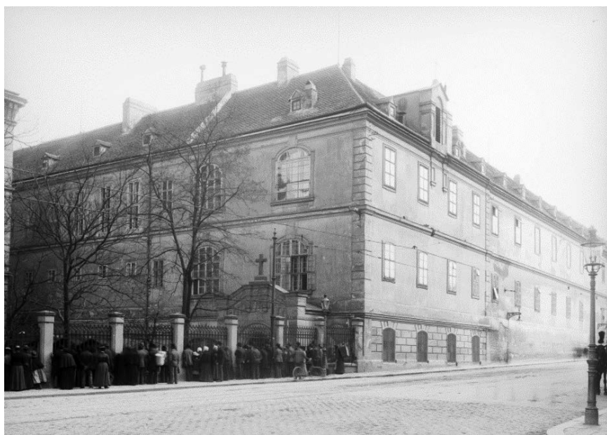
Slika 2. Prva sveučilišna očna klinika u svijetu, osnovana 1812. u Beču.

oftalmologija . Otad su studenti medicine bili obvezni pohađati predavanja iz oftalmologije. Klinika je bila smještena u petom dvorištu Opće bolnice u Spitalgasse 2 na prvom katu (slika 2.). Sastojala se od predavaonice, koja je služila i kao operacijska dvorana, i dviju soba sa po devet kreveta. Prije