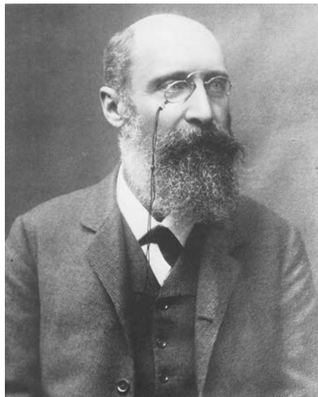
Slika 5. Prof. dr. Ernst Fuchs (1851. – 1930.), šef Druge bečke očne klinike od 1885. do 1915.

deset godina, najduže od svih, tj. od 1885. do 1915. (slika 5.). Nekad su tu kliniku zvali Fuchsova klinika . Bio je asistent F. von Arltu od 1876. do 1880. Otkrio je i opisao mnoge očne bolesti i anomalije. Neki od njegovih oftalmoloških eponima su Fuchsova pjega, kornealna distrofija, kolobom žilnice i heterokromni ciklitis. Bio je „otac patološke anatomije oka“. Napisao je 1889. udžbenik oftalmologije Lehrbuch der Augenheilkunde koji je pedesetak godina bio „oftalmološka Biblija“. Osnovao je 1887. medicinski časopis Wiener Klinische Wochenschrift , koji i danas izlazi. Njegovi učenici su bili W.