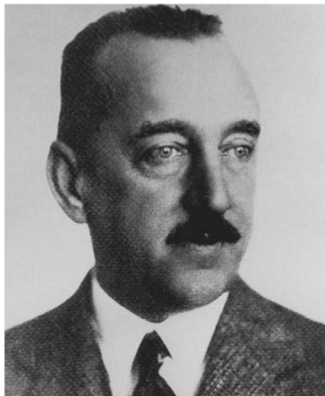
Slika 8. Doc. dr. Kurt Hühn (1875. – 1963.), predstojnik Očnog odjela Bolnice milosrdnih sestara u Zagrebu od 1904. do 1940.

Godine 1911. na njegovu odjelu bilo je hospitalizirano 1155 bolesnika i izvedeno 1159 operacija. Najčešće su operacije bile abrazijska spojnice oboljelih od trahoma (48%) i ekstrakcija mrežne (14,5%). Veće operacije izvođene su u općoj anesteziji kloroformom, a one manje u lokalnoj anesteziji kokainskim i novokainskim preparatima. Pod njegovim mentorstvom odgojen je čitav niz