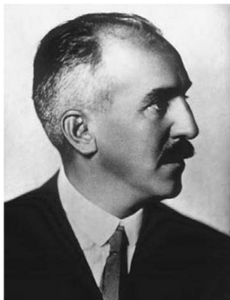
Slika 6. Prof. dr. Albert Botteri (1879. – 1955.), osnivač i predstojnik Prve sveučilišne očne klinike u Hrvatskoj od 1923. do 1951.

godina) (slika 7.). Prije početka specijalizacije surađivao je u Beču s Karlom Landsteinerom (1868. – 1943.), poslije dobitnikom Nobelove nagrade za otkriće krvnih grupa. Od 1906. do 1908. specijalizirao je oftalmologiju kod prof. Ernsta Fuchsa, šefa na Drugoj sveučilišnoj očnoj klinici u Beču. 17 Od 1908. do 1911. radio je kao prvi asistent Očne klinike prof. Stefana Bernheimera (1861. – 1918.). Botterijeva klinika bila je suvremeno opremljena po uzoru na srednjoeuropske klinike. Ta povezanost s europskom oftalmologijom očitovala se i 1923. kada su kliniku posjetili ugledni gosti Karl Lindner,