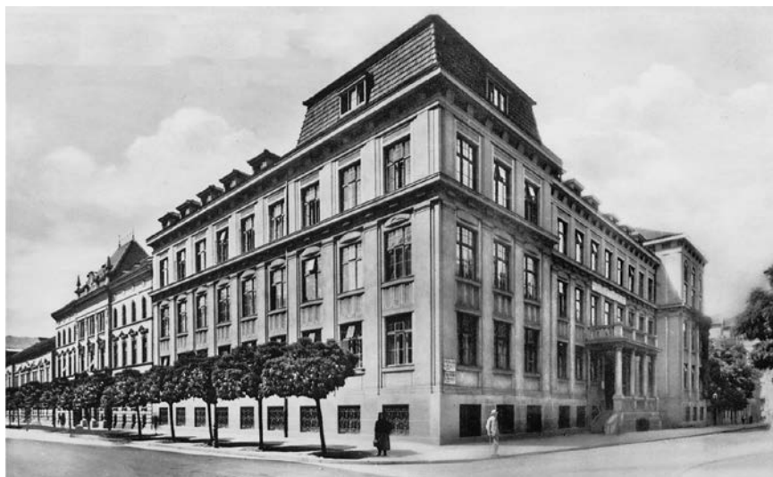
Slika 7. Prva sveučilišna očna klinika u Hrvatskoj, Zagreb, Marulićeva ul. 1, osnovana 1923.