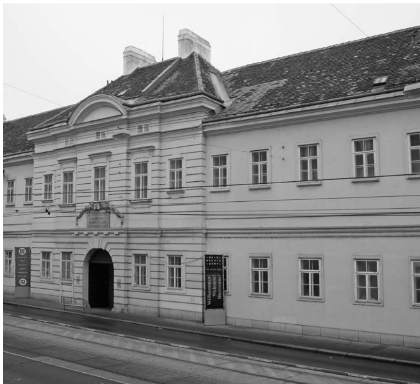
Slika 4. Druga sveučilišna očna klinika u Beču, osnovana 1883.

Druga bečka sveučilišna očna klinika bila je smještena u Općoj bolnici, Alserstrasse 4, na prvom katu iznad glavnog ulaza, a osnovana je 1. listopada 1883. jer je prva postala pretijesna, a i sve je više studenata medicine (slika 4.).