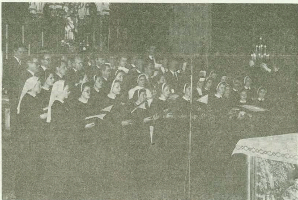
Mješoviti zbor Instituta na svečanom koncertu u Katedrali