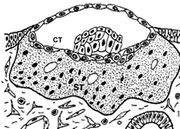
Slika 2. Blastocista u potpunosti okružena stromom endometrija

Slika 1. Blastocista se pričvršćuje na površinu epitela decidue