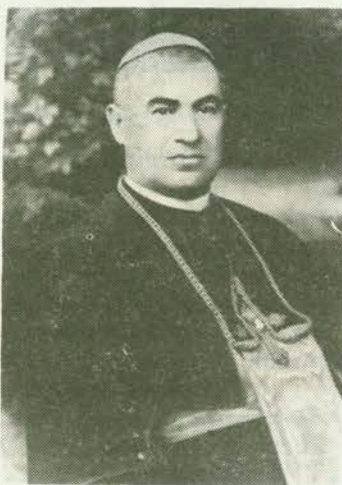
Biskup Lajčo Budanović

1. Naslov moje rasprave o Budanovićevoj zauzetosti oko crkvenog pjevanja može se pričiniti manjkavim. Nisam, naime, ispisao uz njegovo ime visoku crkvenu službu koju je obavljao skoro četiri desetljeća — bio je poglavarom Bačke crkvene pokrajine od 10. veljače 1923. do svoje smrti 16. ožujka 1958. Obično mu se, dakle, uz ime dodaje biskupska služba. No, nisam tako postupio jer je