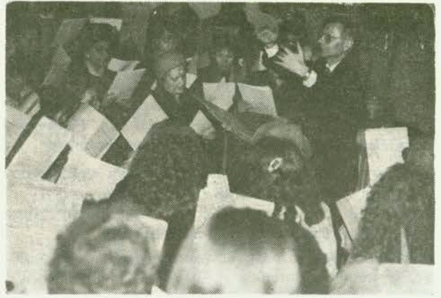
Katedralni zbor »Sveta Terezija«

5. O Lajči Budanoviću napisano je niz članaka, ušao je svojim radom među one o kojima pišu enciklopedijske knjige. O njegovim pak pjesmaricama malo se raspravlja jer dio povjesničara glazbe jedva što znade o bačkim Hrvatima i njihovoj glazbe-